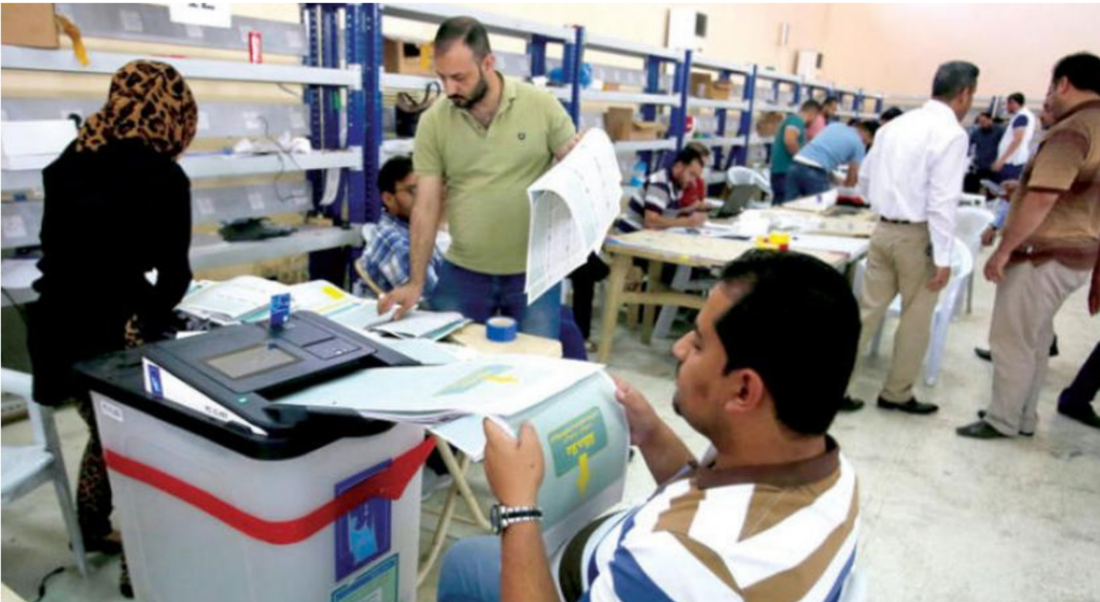
الانتخابات النيابية "رشيف"