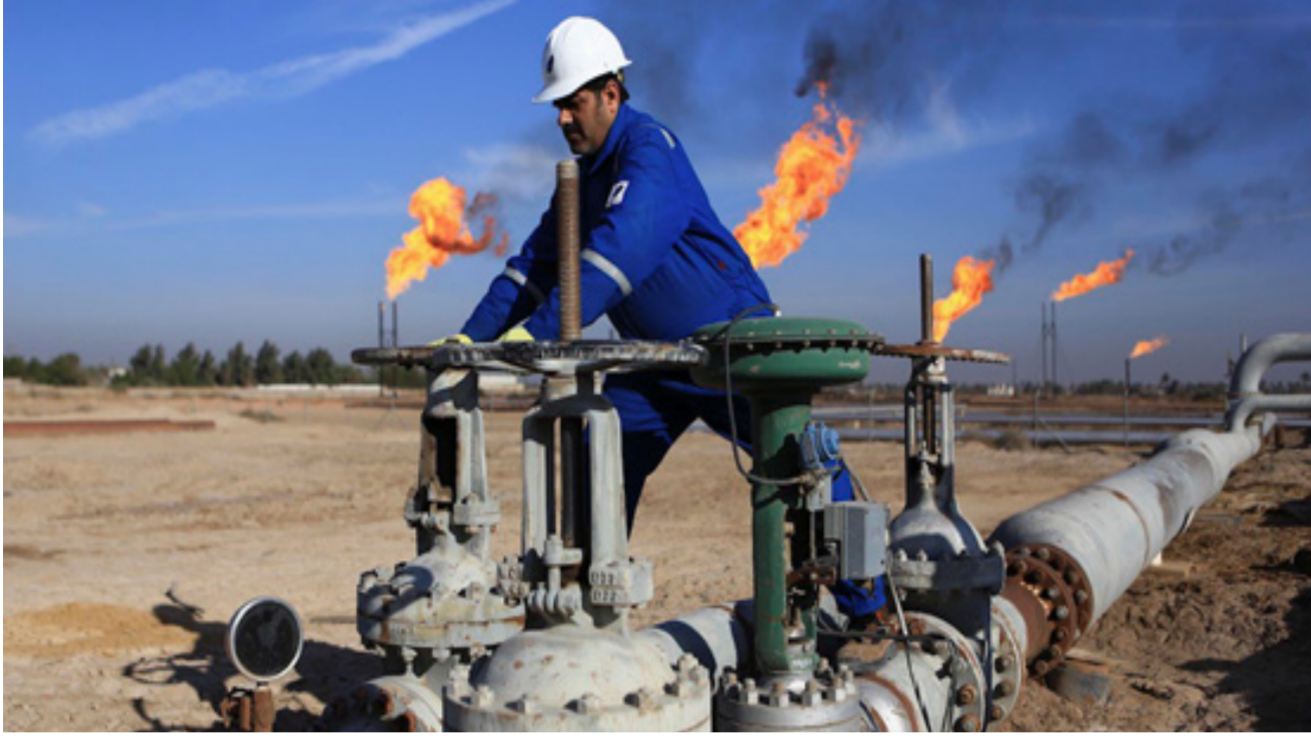
حقول نفط في البصرة

تنفيذ خططنا التوسعية هناك بكفاءة وفعالية عالية ونحن نعمل حالياً على تنفيذ مشروعنا التوسعي هناك. والذي يشمل بناء خط معالجة غاز بسعة 250 مليون قدم مكعب يوميا. لتمضي الأعمال الإنشائية على المسار الصحيح ومن المقرر الانتهاء منها وبدء إنتاج الغاز في الربع الثاني من عام 2023. وكانت الشركة قد تسلمت توزيعات نقدية من Pearl Petroleum بقيمة 48.3 مليون دولار خلال النصف الأول من هذا العام.