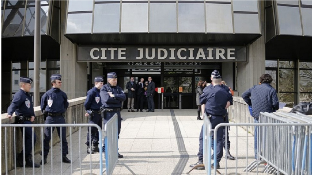
نيابة مكافحة الفساد في باريس