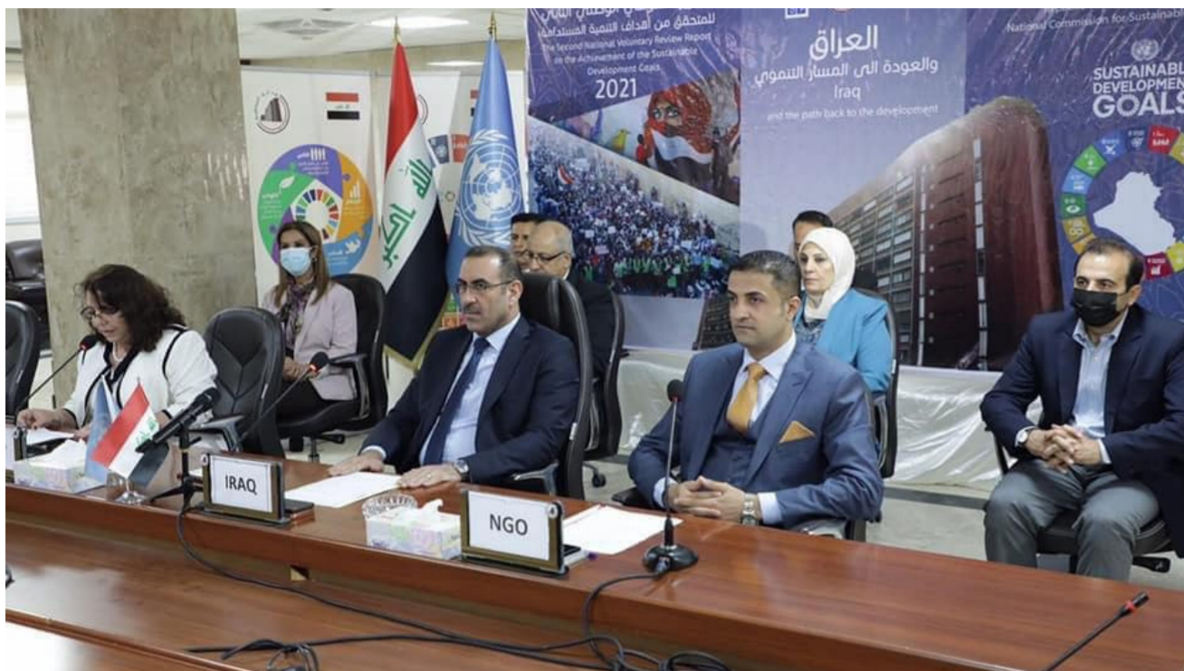
وزير التخطيط الدكتور خالد بتال

ومؤشرات البطالة، وتفصيل مهمة عن واقع سوق العمل. مؤكدا ان السبع سينضم الحضر والريف في جميع المحافظات. داعيا الاسر المشمولة بالسبع الى التعاون مع الباحثين والادلاء بالبيانات الدقيقة، لافتا الى ان جميع البيانات سيتم التعامل معها بسرية تامة ولا يتم استخدامها الا للاغراض الاحصائية والتنمية، مطمئنا المواطنين بان الباحثين الذين سيقيمون بزيارة الاسر سيبرودون ببطاقات تعريفية صادرة عن الجهاز المركزي للاحصاء