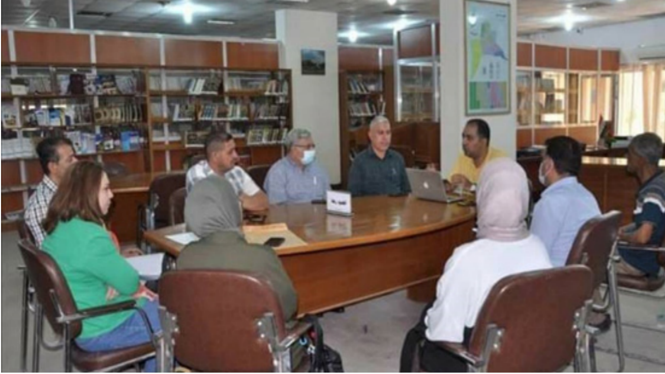
جانب من ندوة مقدمة في علم اللسانيات التقابلي

الافتراضي. وتضمنت الندوة محاور عدة، تناولت التغيير الاجتماعي وما يصاحبه من تغيرات في القيم والاتجاهات وأنماط السلوك المختلفة، فضلاً عن التطرق إلى التغيرات الاقتصادية والسياسية والثقافية وما رافقها من تغيرات جوهرية في بنىة ووظائف المؤسسات الاجتماعية المختلفة. وأوصت الندوة بضرورة إعادة النظر في دور أدوات التنشئة مثل الأسرة، المدرسة، والجامعة، فضلاً عن التأكيد على ضرورة تطوير التعليم من حيث الجودة والنوعية، ووضع ميثاق أخلاقي تقفي لوسائل الإعلام المختلفة تكون من أولوياته الحفاظ على الهوية والوحدة بين الشعب وحماية القيم المجتمعية.