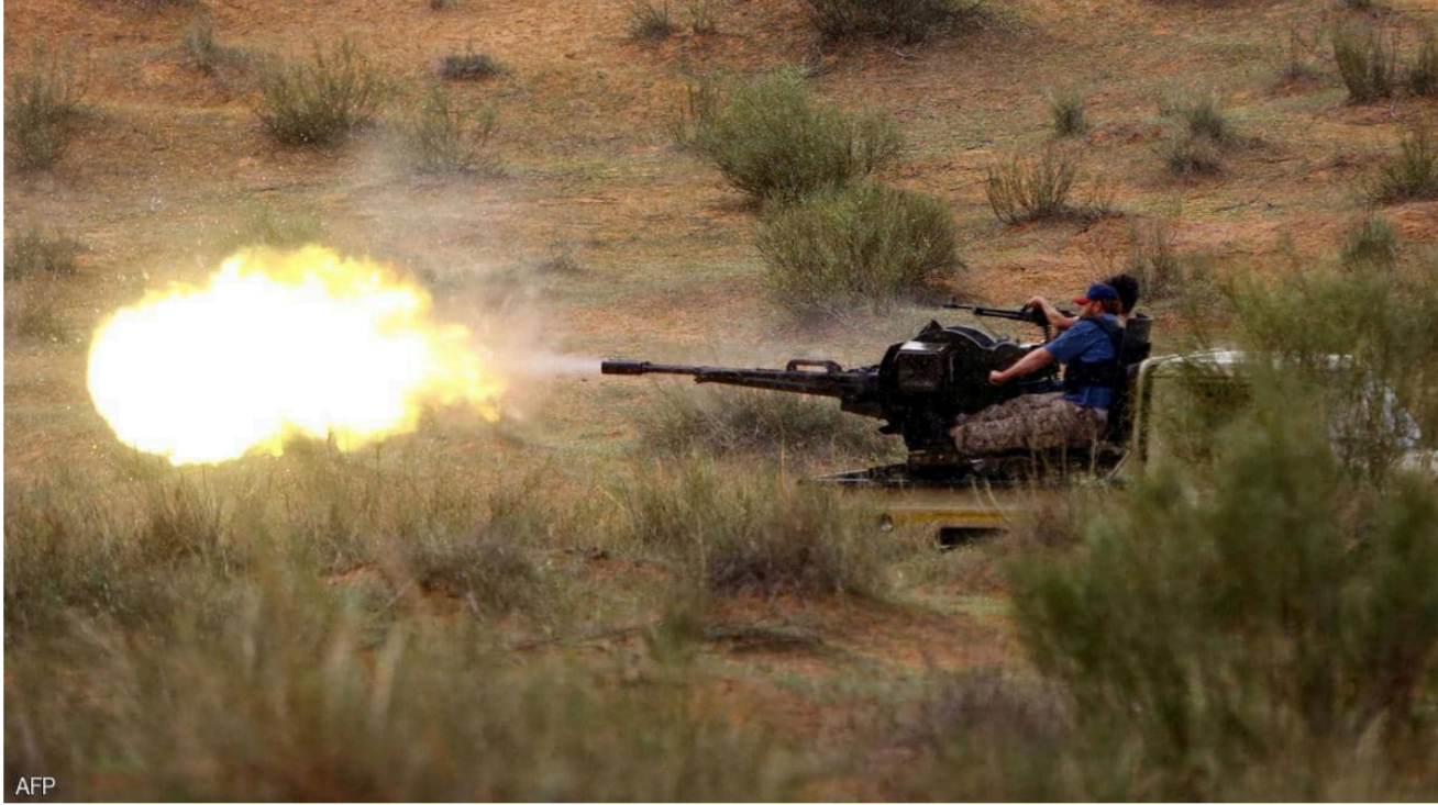
عناصر من الميليشيات الليبية