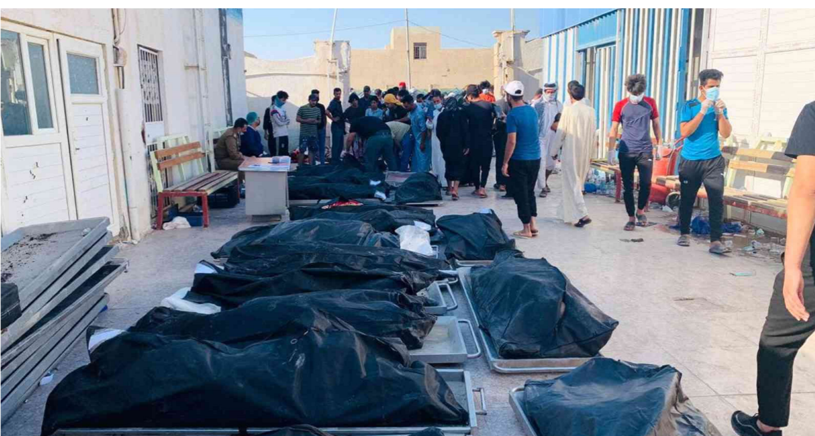
مستشفى الحسين في الناصرية

منع من حصول اخفاق وحرق للمرضى. وشدد، على أن "الجهات المعنية يبدو أنها لم تلتزم بتلك التوصيات وخصوصاً ما يتعلق بالتنسيق والتعاون مع فرق الدفاع المدني". ومضى خلاط، إلى أن "التنسيق بين مديريات الدفاع المدني ودوائر الصحة بهذا الشأن قد تباين بين محافظة وأخرى، ولكن هذا لم يفرق كوروناً".