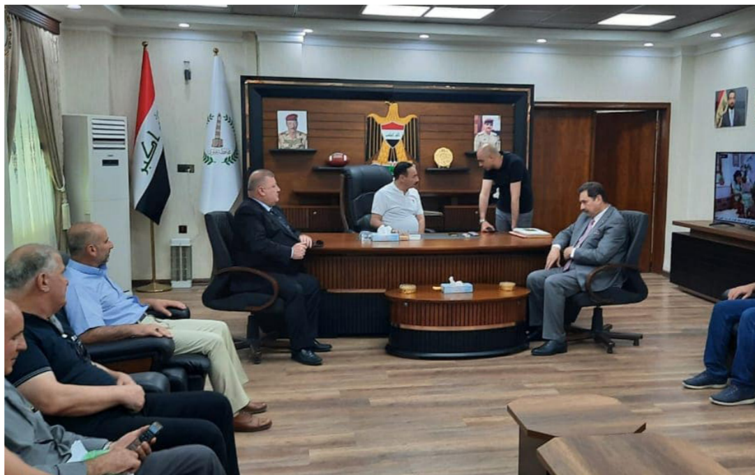
وزارة الشباب والرياضة تبحث مشاريعها في محافظة نينوى

لمتابعة تنفيذ إستراتيجية التطرف العنيف المؤدى إلى الإرهاب أن وزارة الشباب والرياضة داعمة للشباب الناشطين في تنفيذ البرامج والخطط التي تصب في الإستراتيجية الوطنية لمكافحة التطرف العنيف المؤدى إلى الإرهاب. وأضاف أن حضورنا الورشة يهدف إلى تفعيل دور الشباب في الإستراتيجية الوطنية لمكافحة التطرف العنيف. وسيسبل تنفيذها على المستوى الوطني والمحلي والورشه جزء من أنشطة اللجنة الوطنية لمراقبة تنفيذ الإستراتيجية الوطنية لمكافحة التطرف العنيف للتواصل مع مختلف فئات المجتمع العراقي والشباب والنساء على وجه الخصوص بهدف شرح مفاهيم الإستراتيجية وسبل تطبيقها من أجل الحد من التطرف المؤدى إلى العنف في المجتمع العراقي. والاستفادة من دور الشباب الفاعل في المجتمع والتعرف بالمشاكل التي تواجهها. وعزز ذلك ببعض المقدمه فيها.