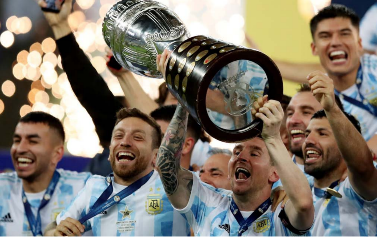
تتويج الأرجنتين ابطالا لكوبا اميركا

ومن مدريد، اعتبرت صحيفة (ماركا) أن «منتخب الأرجنتين توج بطلا مستحقا لأنه في مباراة بدون كرة قدم. أخطأ أقل من لودي (ظهير البرازيل)، الذي ارتكب خطأ دفاعيا، فتح الباب أمام دي ماريا لتسجيل هدف الفوز.وأبرزت الصحيفة أنه بذلك الفوز، جنب ميسي بلقب مع المنتخب الأول للأرجنتين، وهو الأمر الذي كان يرغب فيه بشدة. كان سيظل الأفضل على مر العصور على أي حال. لكن مع هذه الكأس في خزانته الأمر مختلف».