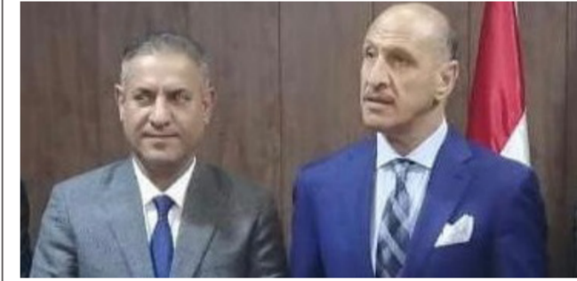
محافظ الناصرية ورجال

الاستخدامات،"ولفت الى ان الوزير وعد بدعم مارتون أور للدرجات الهوائية الذي سينظم قريباً