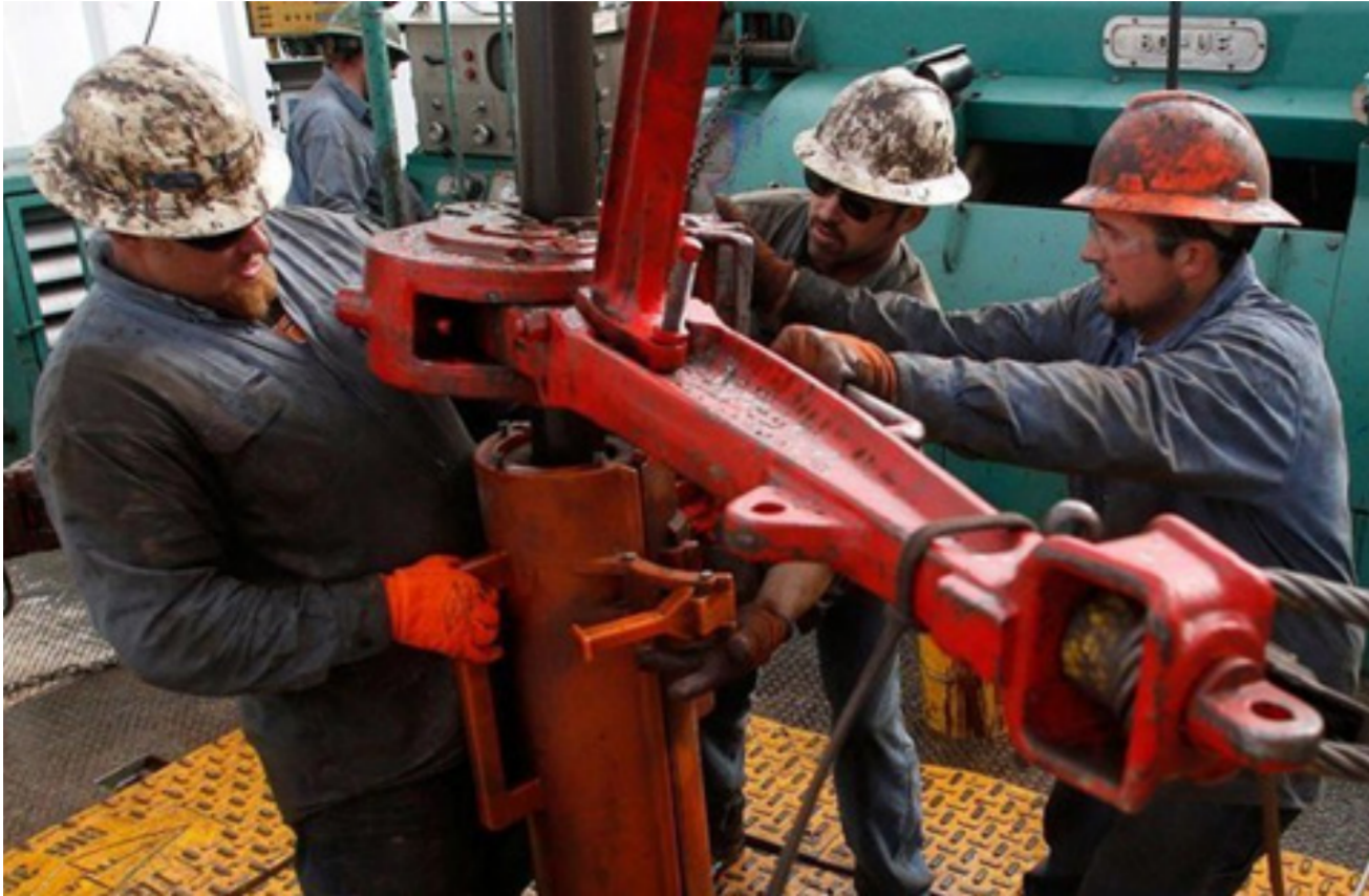
عمال في حقل نفطي في البصرة

الفترة من 31 تشرين الأول إلى 12 تشرين الثاني في جلاسكو في بريطانيا. ونوه بقول محمد باركيندو أمين عام للمنظمة بشأن المناخ تستمر في توفير مرحلة ديناميكية وشفاقة لتبادل الآراء والمعرفة حول قضايا تغير المناخ والتنمية المستدامة التي تهم المجتمع العالمي. بما في ذلك الدول الأعضاء في "أوبك".