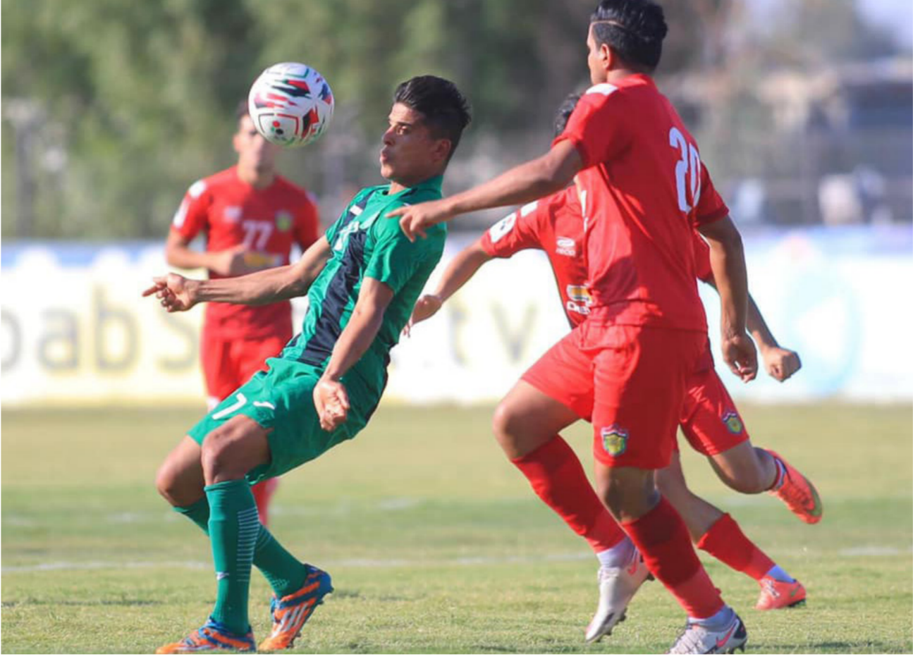
لقطة من مباريات دوري الكرة الممتاز

اليوم.. الجوية في ضيافة الميناء بافتتاح الجولة 37 لدوري الكرة الممتاز