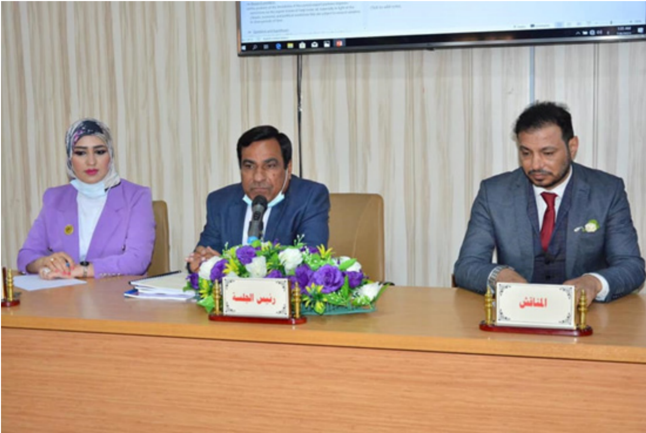
جانب من مناقشة بحوث تخرج طلبة قسم إدارة وتسويق النفط والغاز