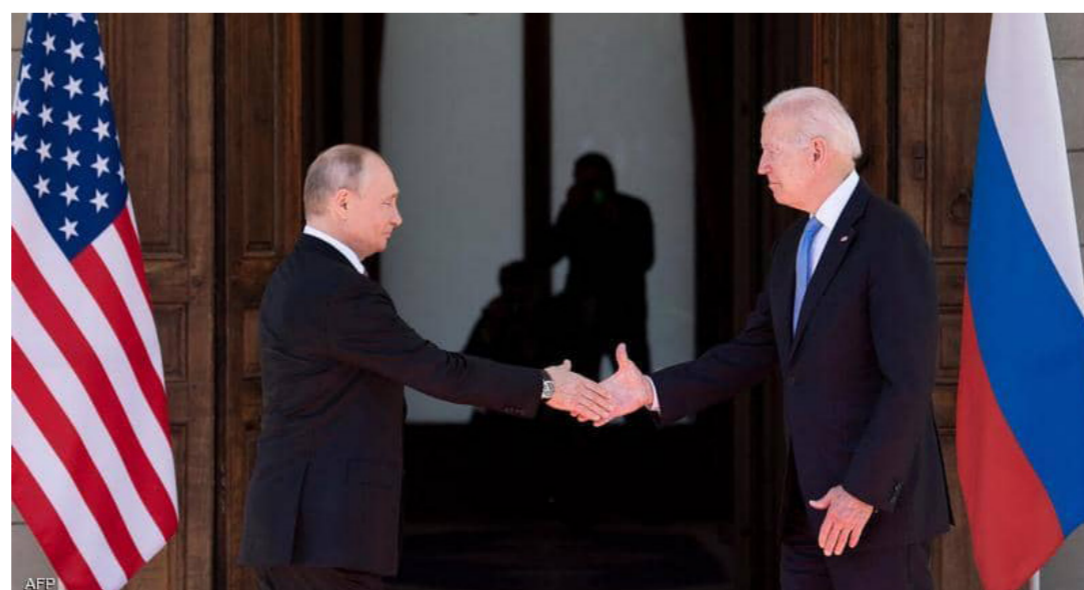
وأشار بايدن لاحقا إلى أن المناقشة "جرت على ما يرام. أنا متفائل". ولدى سؤاله عن "تبعات" محتملة. أكد أنه ستكون هناك عواقب "نعم". من دون

تعمل من الأراضي الروسية. وشنت قرصنة قبل أسبوع هجوما جديدا واسعا استهدف شركة أنظمة المعلومات "كاسيا" التي أعلنت أنها لن تعيد تشغيل خوادمها قبل الأحد. منذ ذلك الحين. يتعرض بايدن لضغوط للتحرك. ومع ذلك. يبدو أن البيت الأبيض يريد تجنب مواجهة مباشرة مع موسكو. وأكدت المتحدث باسمه جين ساكي الجمعة أنه لا تتوافر "معلومات جديدة تشير إلى احتمال أن الحكومة الروسية قادت تلك الهجمات". لكنها شددت على أن موسكو "عليها مسؤولية التحرك". مرددة ما قاله بايدن. "دائمة وغير سياسية" إلى جانب "كاسيا". هاجم قرصنة إلكترونيون مؤخرا شركة اللحوم العملاقة "جي بي إس". ومشتغل خط أنابيب النفط "كولونيسال بايبلاين" وكذلك إدارات محلية ومستشفيات أمريكية. وخلال قمتها في سويسرا. تطرق بايدن وبوتين إلى القضية واتفقا على