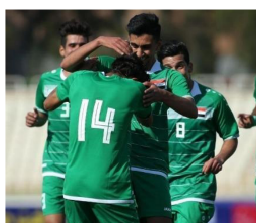
الأولمبي في بطولة سابقة

كانت جيدة. ويتوجب علينا تقديم الأداء المطلوب والفوز لضمان التأهل عن المجموعة الثالثة. وأكد التشيكي ميروسلاف سوكونب: جميع المجموعات لها جودتها. والجميع لديهم فرصة التواجد في نهائيات آسيا تحت 23 عاماً. وأضاف: المجموعة الثالثة التي تضم البحرين وأفغانستان والمالديف تقريباً جيدة. وبالنسبة لي فأنا أعرف البحرين وأعرف بعض اللاعبين وكذلك البيئة هناك. ولكن بشكل عام يتوجب علينا تقديم الأداء المطلوب لتحقيق الانتصارات في هذه المجموعة وضمان التأهل لنهائيات آسيا 2022 تحت 23 عاماً. يشار إلى أن المنتخبين صاحب المركز الأول في كل مجموعة يتأهل إلى نهائيات آسيا 2022 تحت 23 عام في أوزبكستان. إلى جانب أفضل أربعة منتخبات تحصل على المركز الثاني في المجموعات الـ11.