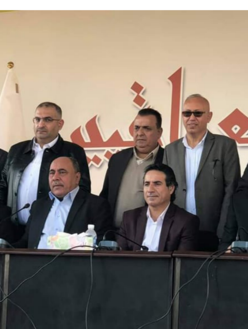
تشكيله الآخاد العراقي للصحافة الرياضية