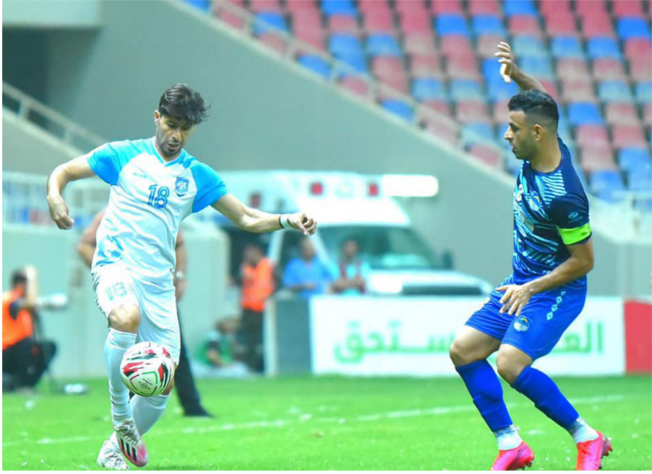
لقطة من مباريات دوري الكرة الممتاز