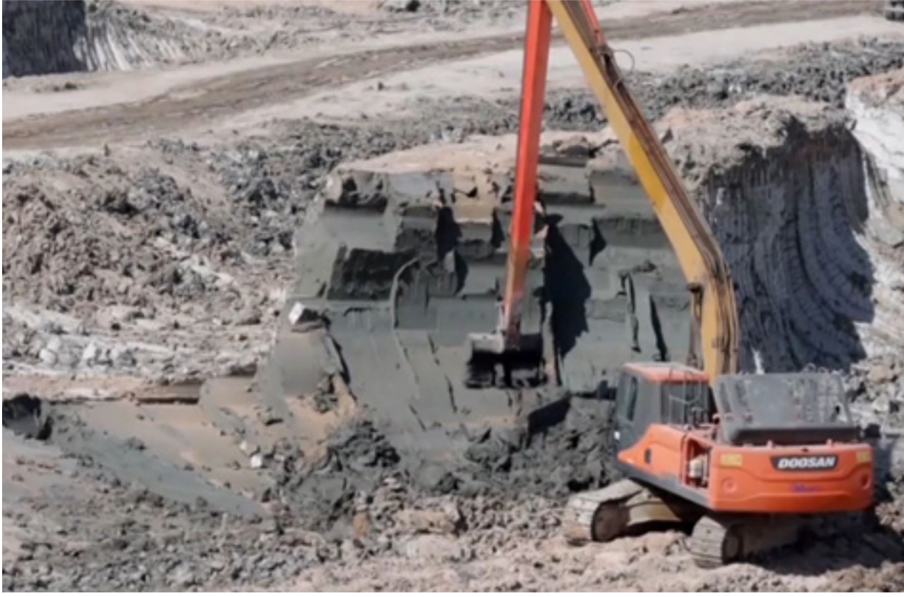
اعمال الحفر في أكبر نفق مغمور في الشرق الأوسط

تدقيق، فضلاً عن استخدام البطاقة الالكترونية". وتابع: "من ضمن مشاريع الوزارة الخاصة بالموانئ مشروع النفق المائي (نفق الحرير) وهو من المشاريع الفريدة في الشرق الأوسط. وهو عبارة عن نفق مغمور يربط ميناء الفاو بالطريق الدولي من خلال طريق بحر الفاو عبر القناة للملاحة بحور الزبير. أي بين ميناء أم قصر وخور الزبير. كما أن هذا النفق يربط ميناء الفاو بطريق الحرير من خلال نفق الزبير. أم قصر الدولي إلى بغداد". مشيراً إلى أنه "تم تشييد القواعد الكونكرتية للصبة الخرسانية الخاصة بالنفق".