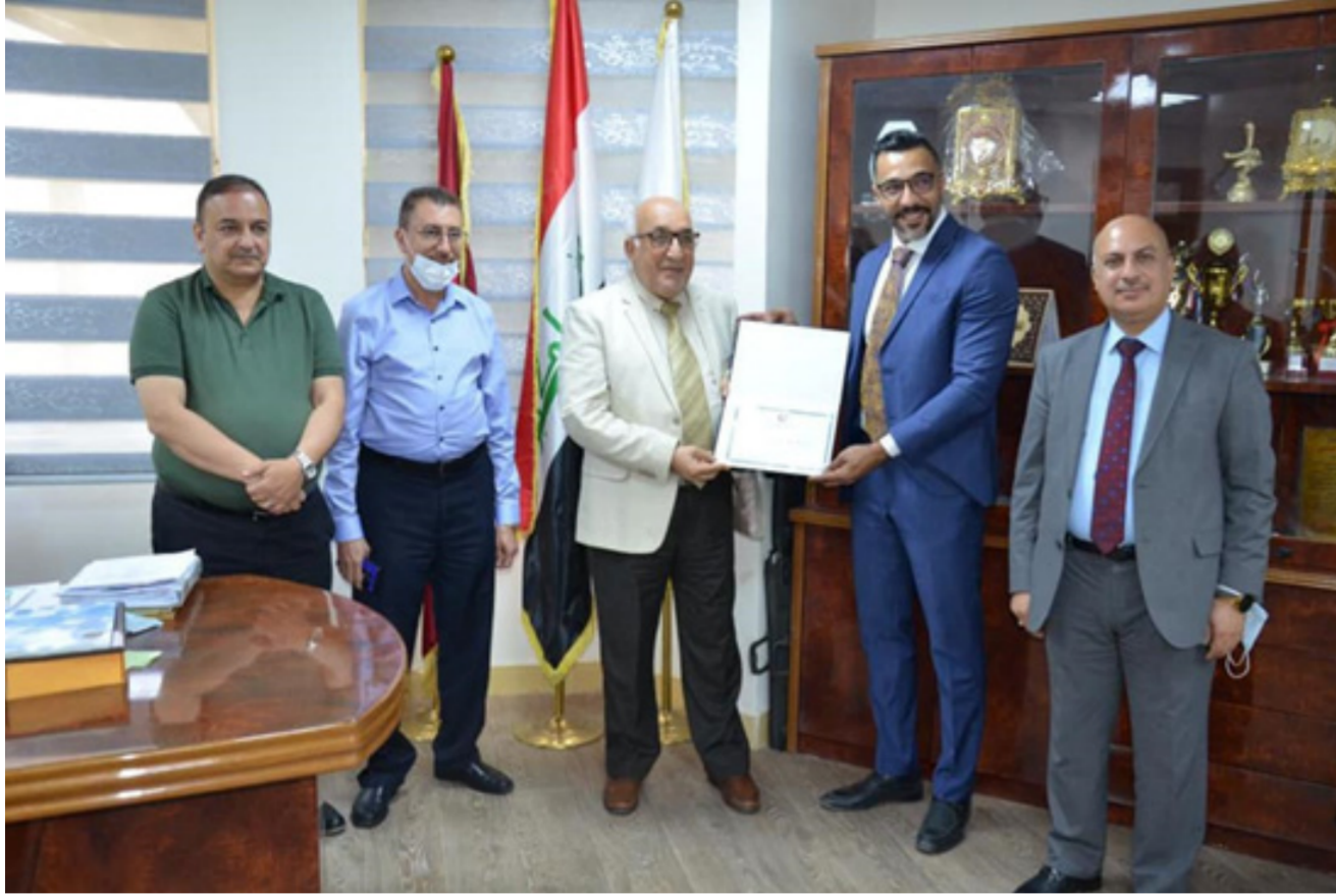
ادارة مستشفى الصدر التعليمي تزور عمادة كلية الطب بجامعة البصرة