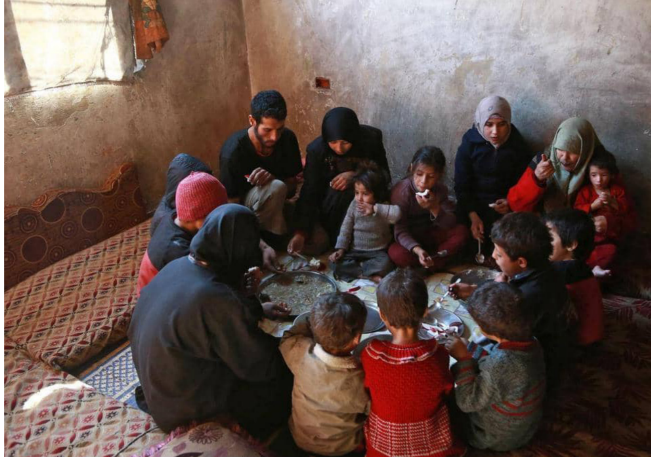
ملايين السوريين تتهددهم المجاعة