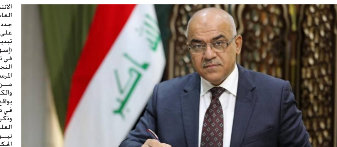
وزير التعليم العالي والبحث العلمي نبيل كاظم عبد الصاحب

الانتخابات التشريعية المقررة في العاشر من تشرين الأول (المقبل) فيما جدد رئيس مجلس القوميين (شكره على التعاون والتواصل المستمر الذي تبديه وزارة التعليم) مشيراً الى أن (إسهام أساتذة وتدرسيي الجامعات في تفاصيل هذه المهمة سيعزز فرص النجاح في الوصول الى الأهداف المرسومة). من جانب اخر سجلت الجامعات والكليات العراقية. نشرًا عالمياً متزايداً بواقع أكثر من مئة ألف بحث علمي على مستوعبات سكوبس وكلايفيت. وذكرت وزارة التعليم العالي والبحث العلمي في بيان ورد لـ السنوسمية نبوز. أن المؤسسات الأكاديمية الحكومية والأهلية العراقية عززت موقعها في النشر العالمي حيث