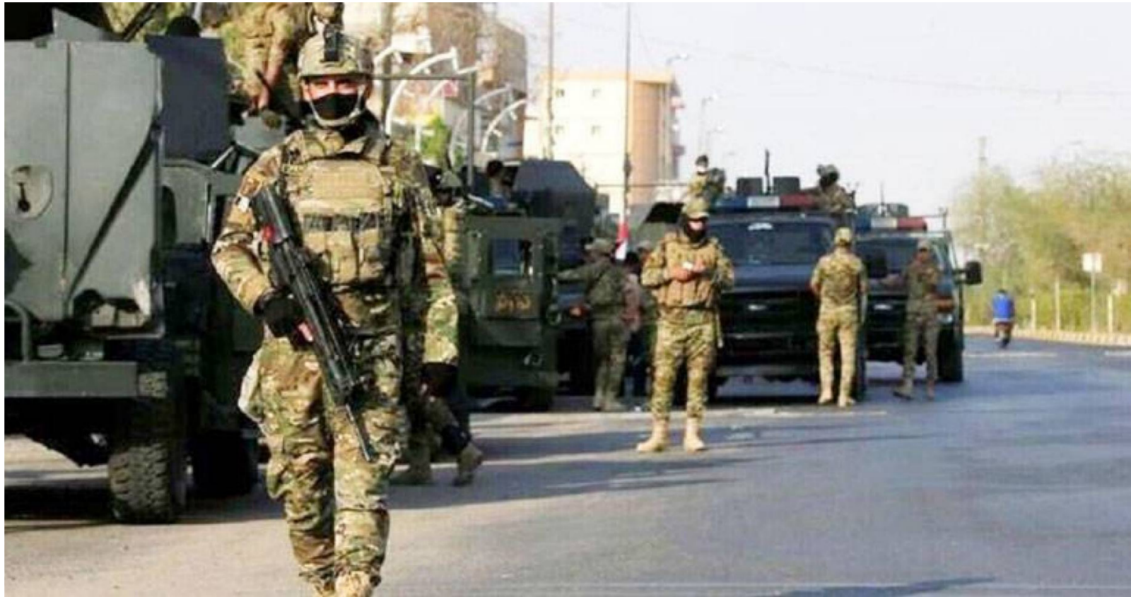
قوات العمليات المشتركة "رشيف"