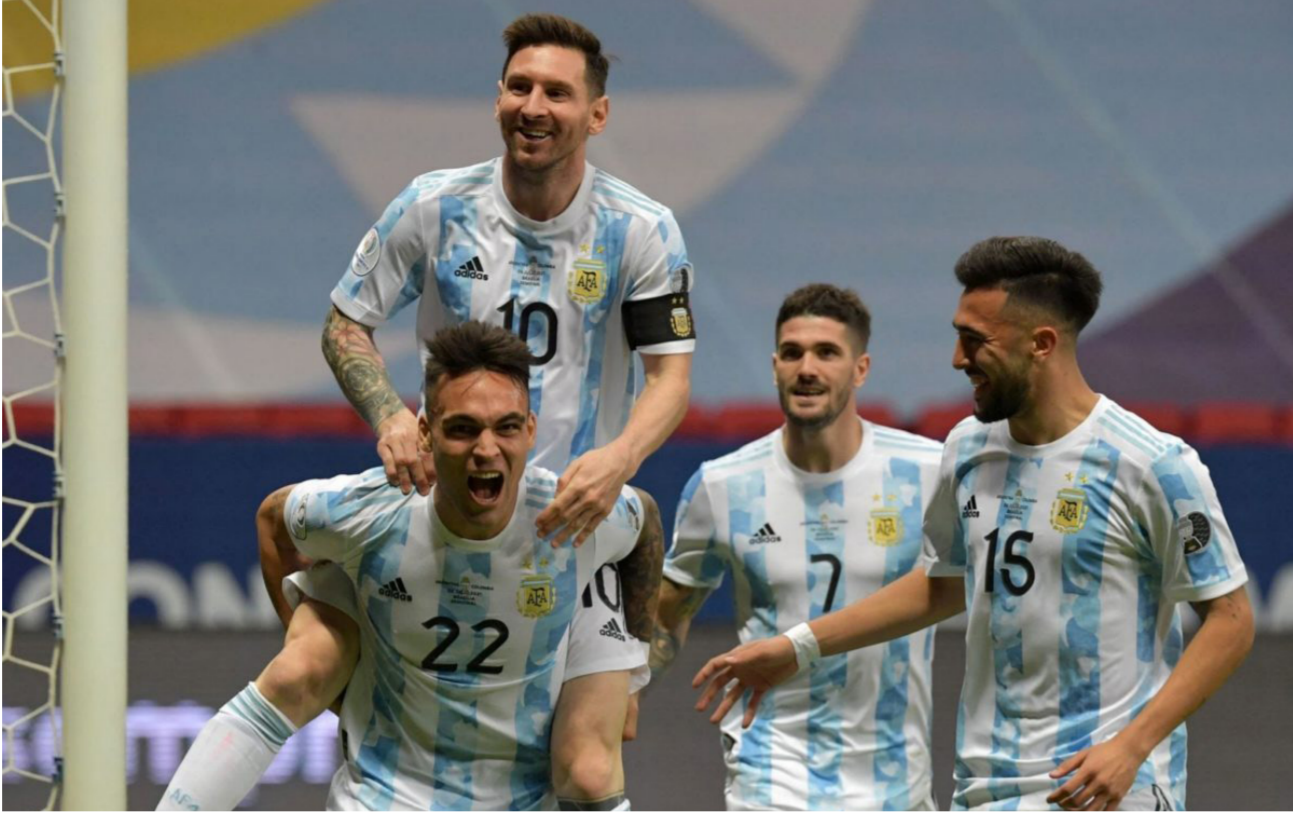
فرحة أرجنتينية بالتأهل إلى النهائي

ومرمت كولومبيا من استضافة البطولة بعد احتجاجات مناهضة للحكومة واعتقال الكثيرين. في حين انسحبت الأرجنتين في اللحظات الأخيرة من التنظيم بسبب ارتفاع أعداد المصابين بكوفيد19. وغاب نيمار عن فوز البرازيل بكوبا أميركا على أرضها منذ عامين. لكنه سبق أن قادها لخصد لقب كأس القارات 2013 والميدالية الذهبية في أولمبياد ريو دي جانيرو في 2016. وفي المقابل. أحرز ميسي كل لقب ممكن مع ناديه برشلونة. لكنه لا يزال يبحث عن أول لقب كبير للأرجنتين منذ الفوز بكوبا أميركا 1993. من ناحية أخرى. انتقد نيمار الحكم التشيلي روبرتو توبرار. الذي طالبه لاعب منتخب بيرو بعدم احتساب ركلة جزاء له ولم يذهب بالفعل لمراجعة اللعبة عبر تقنية «الفار» ليبريد من سخط لاعبي البرازيل. وقال حول الحكم: «إنه حكم متعرج للعباية. يبدو ذلك من الطريقة التي ينظر بها. إنه يفترض الاحترام». وتابع: «هو يمكن أن يخطئ أو يصيب. هذا جزء من اللعبة. لكن لا يمكن أن يكون حكماً لنصف نهائي كوبا أميركا».