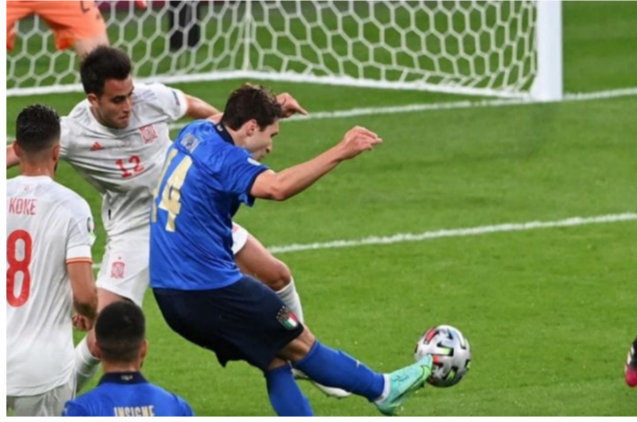
لقطة من لقاء إيطاليا وإسبانيا

وهي. لكن بعد ذلك حصلنا على الإحاديث الصحيحة ولم نخاطر كثيراً. كنا نعلم منذ البداية أن إسبانيا هم أسيا الاستحواذ. لذا فقد سببوا لنا المشاكل لكن كان علينا التكيف والقتال بقوة». وتابع: «فكرة كرة القدم تهاجم وتدافع. لا يمكنهم الهجوم فقط. كلانا كان لديه فرص. والفريقان عظيمان. كل الفرق تدافع وليس إيطاليا فقط». وعن التغييرات بإيطاليا بعد فشل التأهل لمونديال 2018. أتم: «الفضل يعود للاعبين. لأنهم آمنوا بكل هذا قبل 3 سنوات. لكن الأمر لن ينته بعد. علينا أن نستجمع قوتنا. وما تبقى لدينا والاستعداد للنهائي».