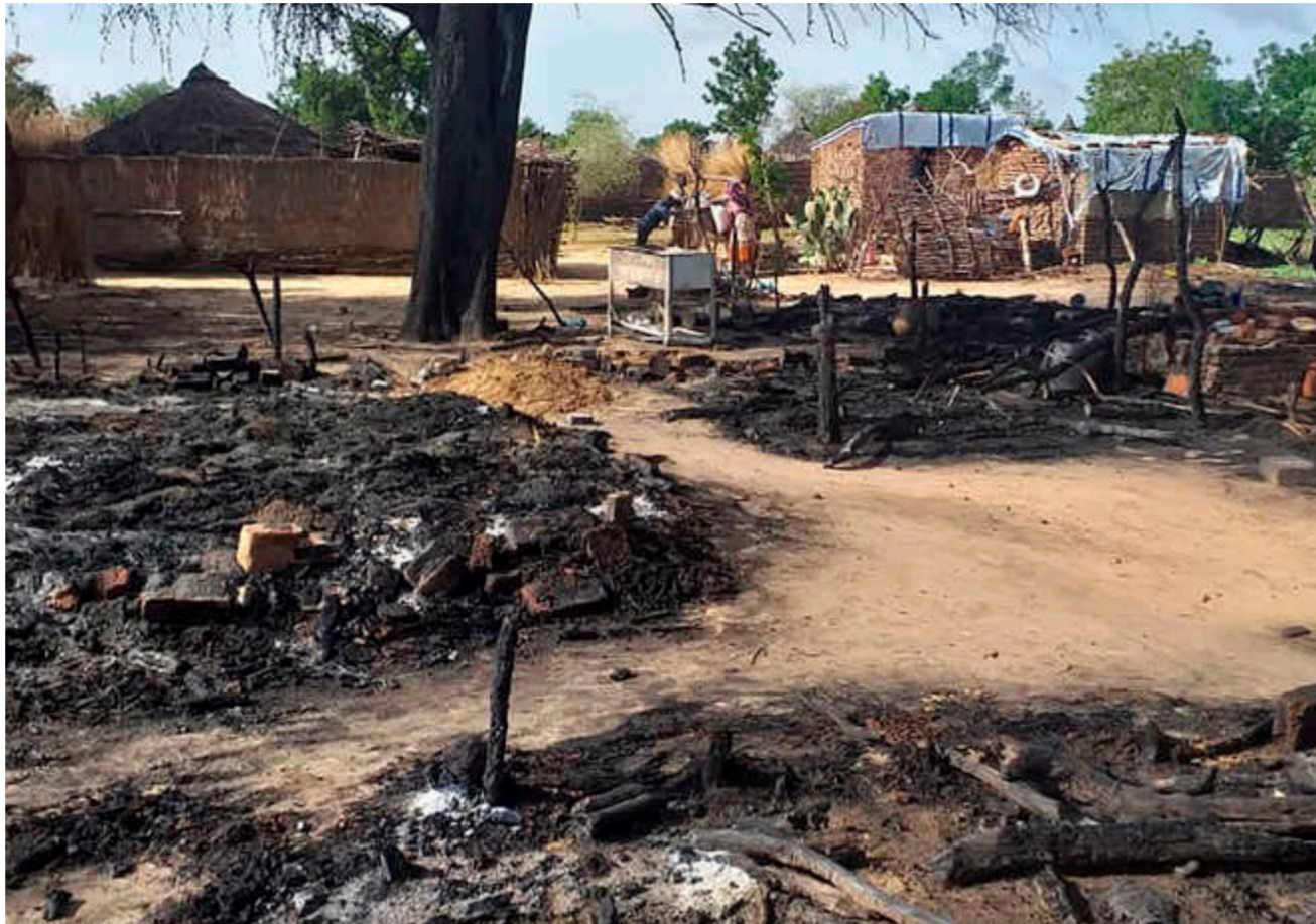
آثار هجوم مسلح على قرية مستري في ولاية غرب دار فور

الصباح الجديد - متابعة: كان المسلحون يرتدون الزي العسكري وملثمين، ولا نعلم من هم، وأطلقوا الذخيرة الحية مباشرة بعد إيقاف السيارة وسط النهار