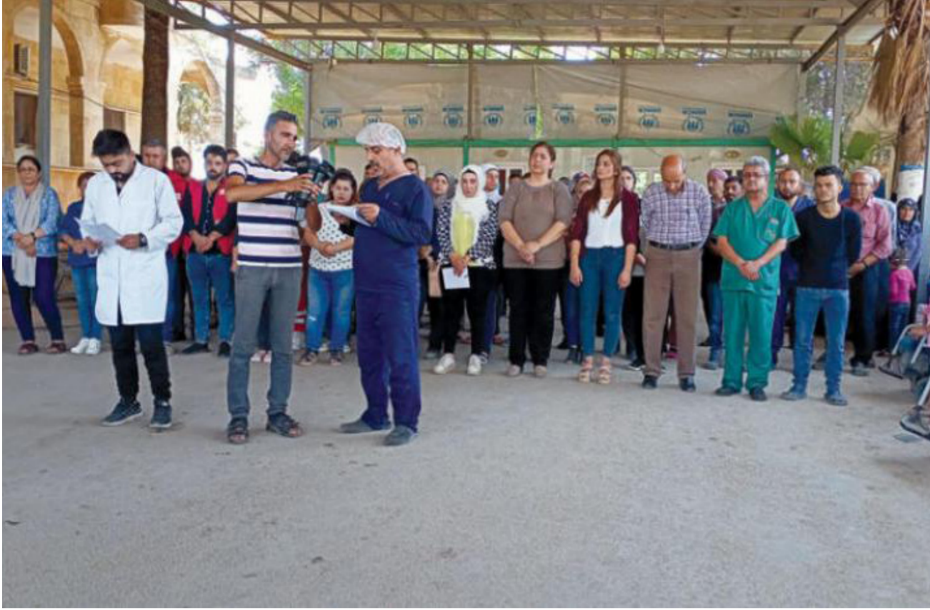
كوادر طبية في مستشفى افرين بريف حلب الشمالي

من مليون و200 ألف. بينما توفي 25719 شخصاً. يذكر أن الأعداد الرسمية لوزارة الصحة التابعة للنظام السوري منذ دخول الجائحة إلى الأراضي السورية، هي 25619 إصابة، توفي منها 1885، بينما بلغت حالات الشفاء 21845، وأحصى المرصد السوري لحقوق الإنسان وفاة 211 طبيياً ضمن مناطق نفوذ النظام السوري متأثرين بإصابتهم بفيروس كورونا منذ بداية الجائحة، بينهم 172 توفوا خلال عام 2020 الماضي، وتقهّم المرصد السوري بالأسم.