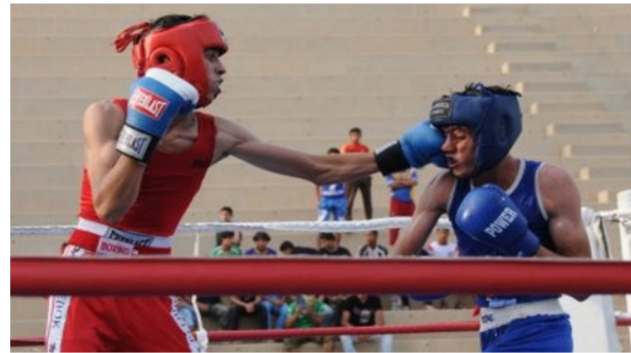
بطولة للناشئين بالمالكمة