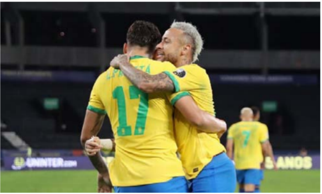
نيمار يعانق باكينيا احتفالا بالفوز