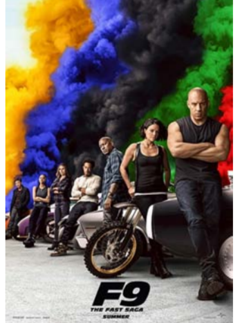
كورونا التي أدت إلى إغلاق جميع دور العرض حول العالم. ووفقا

حقق فيلم الكيشن السرعة والغضب (9 Fast and Furious). إيرادات كبيرة حول العالم. حيث حقق 500 مليون دولار وهو الفيلم الذي يعرض في ثمانية أسواق عالميا. منهم كوريا وهونج كونج وروسيا. والإمارات العربية. والملكة العربية السعودية. ومصر والصين. ويقوم ببطولة السلسلة الأبطال الرئيسيين في ديزل وميشيل رودريجز للقيام بشخصيتي دومينيك وحبيبتة ليثي. واتضم إليهم في الجزء التاسع كل من جون سينا وجوردانا بروستر للقيام بدور أشقاء دومينيك وناتالي إيمانويل ونشازاليز ثيرون وهيلين ميرين. وشهد الجزء التاسع العديد من التآجيات والتغيرات في موعد العرض. وذلك بسبب جائحة