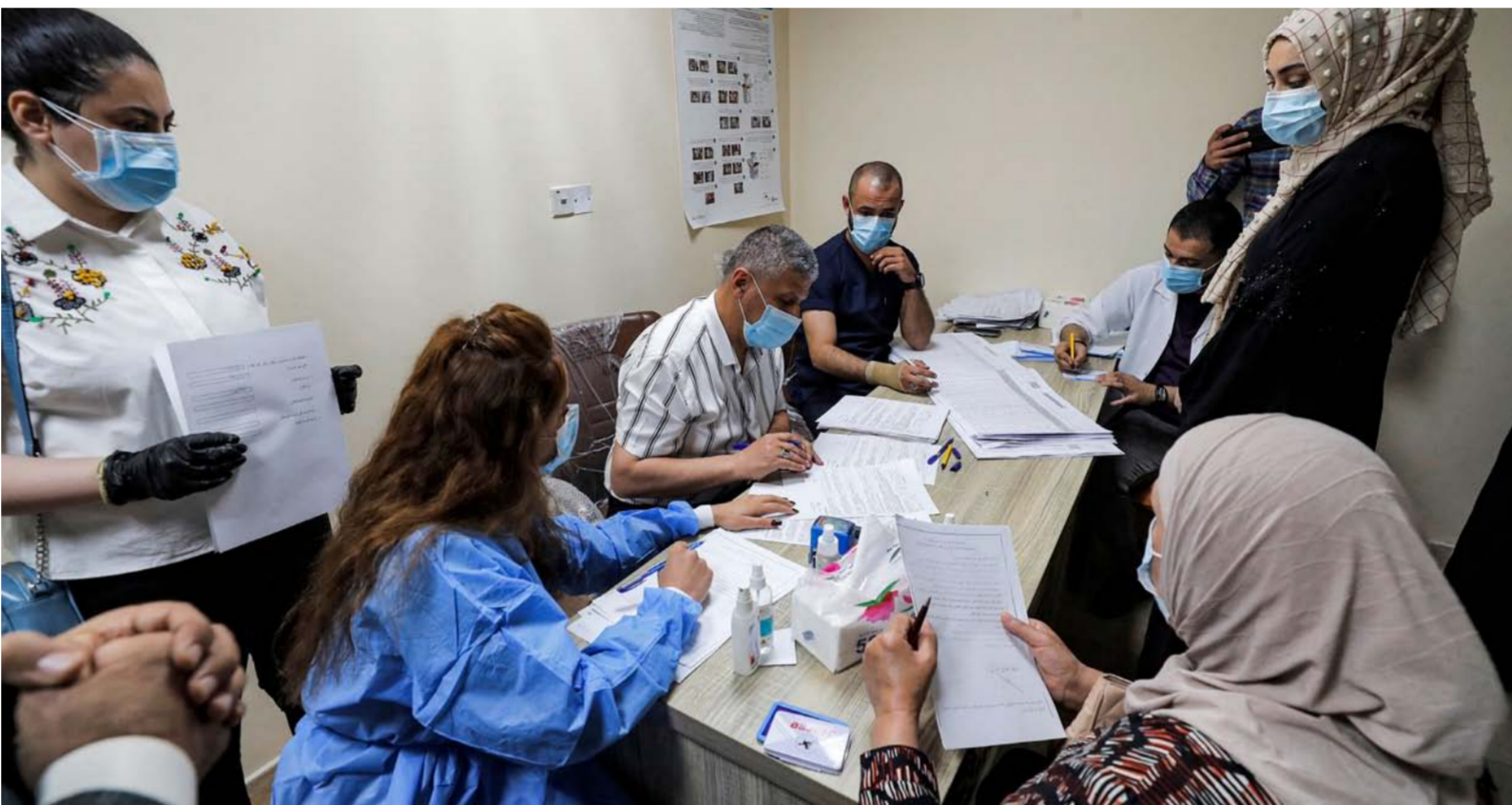
ارتفاع اعداد المصابين بالفايروس في الفترة الأخيرة