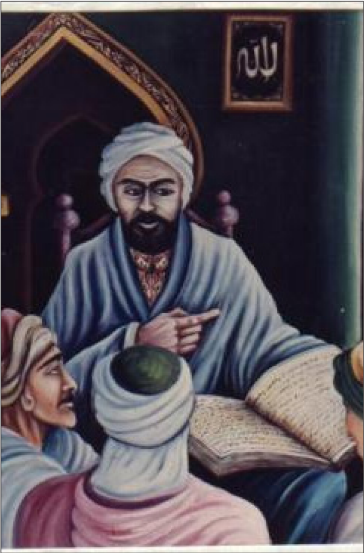
ابن سعيدي المغربي

من الجهاز الاصطلاحي للنقد المشرقي القديم. فمصطلح (الاختراع) - في النقد المشرقي - يعني خلق المعاني التي لم يسبق إليها والإيمان بما لم يكن منها قط. ومصطلح (المؤلد - التوليد) يتلخص بأن يأخذ الشاعر معنى من شاعر آخر تقدمه ويعمل على الزيادة فيه زيادة تضيف جديداً إلى الأصل. ولا يحمل هذا المصطلح معنى الإختراع غير