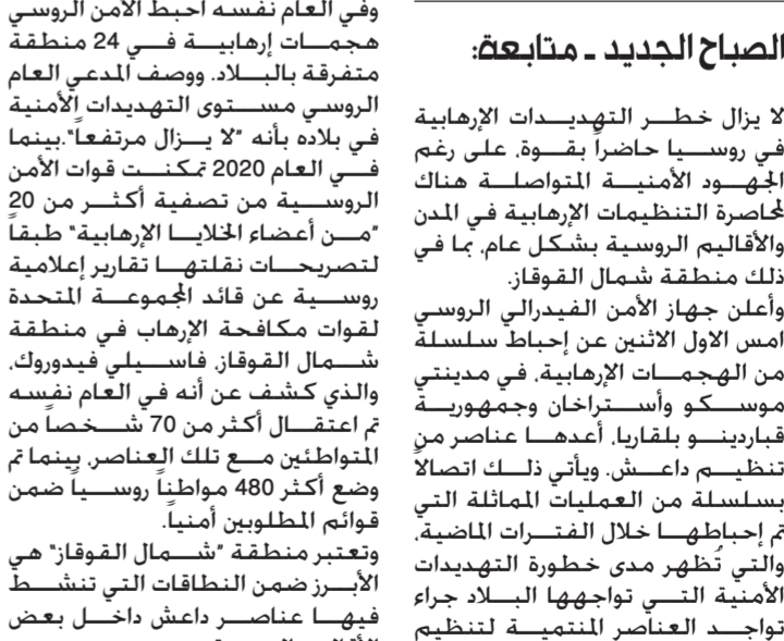
تمكن الأمن الروسي من إحباط العديد من الهجمات الإرهابية

الصباح الجديد - متابعة: لا يزال خطر التهديدات الإرهابية في روسيا حاضراً بقوة، على رغم الجهود الأمنية المتواصلة هناك لمحاصرة التنظيمات الإرهابية في المدن والأقاليم الروسية بشكل عام، بما في ذلك منطقة شمال القوقاز. وأعلن جهاز الأمن الفيدرالي الروسي أمس الأول الاثنين عن إحباط سلسلة من الهجمات الإرهابية، في مدينتي موسكو وأستراخان وجمهورية قباردينو بلقاريا، أعدها عناصر من تنظيم داعش، ويأتي ذلك اتصالاً بسلسلة من العمليات المماثلة التي تم إحباطها خلال الفترات الماضية، والتي تظهر مدى خطورة التهديدات الأمنية التي تواجهها البلاد جراء تواجد العناصر المتميزة لتنظيم داعش والمالية له. ويتحدث محللون بموازاة ذلك عن خطر العائدين من سوريا والعراق بعد هزيمة تنظيم داعش هناك، إلى روسيا، وسعيهم لبناء قواعد جديدة، لا سيما أن المقاتلين الروس كانوا يشكلون النسبة الأكبر ضمن قائمة المقاتلين الأجانب داخل التنظيم الإرهابي بصفة عامة. في العام 2019 ارتفعت نسبة العمليات الإرهابية داخل روسيا والتي تم إحباطها، بنسبة 98 بالمئة، مقارنة بالعام السابق عليه، طبقاً لما أعلنه المدعي العام الروسي، إيغور كراسنوف، والذي لفت إلى تزايد خطر الإرهاب في بلاده.