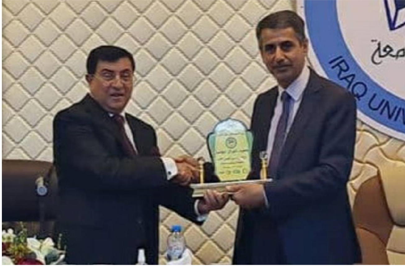
رئيس جامعة البصرة يتسلم درع الابداع من عميد كلية العراق الجامعة