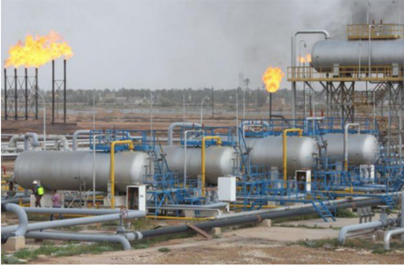
محطات غاز عراقية

أن إيران أوقفت إمداداتها الحيوية من الطاقة إلى العراق. ما غدى المخاوف من اندلاع احتجاجات وسط حالة من عدم الاستقرار. وأضافت الوكالة في تقريرها إن "إيران التي تعاني من ضائقة مالية ضغطت على الحكومة العراقية للإفراج عن الديون المتأخرة. في ظل درجات الحرارة الحارقة، وقبل الانتخابات في البلاد".