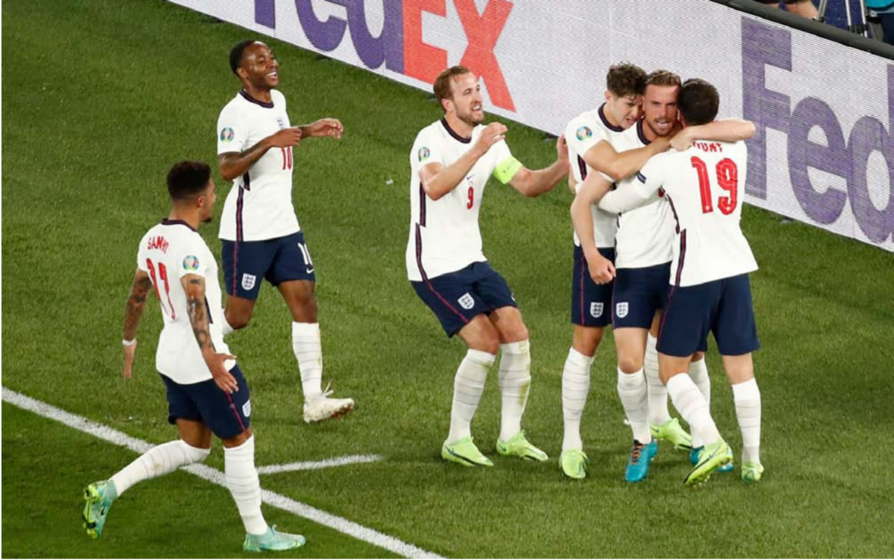
لاعبو منتخب إنجلترا

ويحل كين الذي سجل أمام ألتانيا في دور الستة عشر وأضاف ثنائية في فوز إنجلترا 0-4 في دور الثمانية على أوكرانيا خديبا دنيا هانلا للدنماركين، وقال كريستensen «يجيد اللعب بدمية وهو واحد من أفضل المهاجمين في كرة