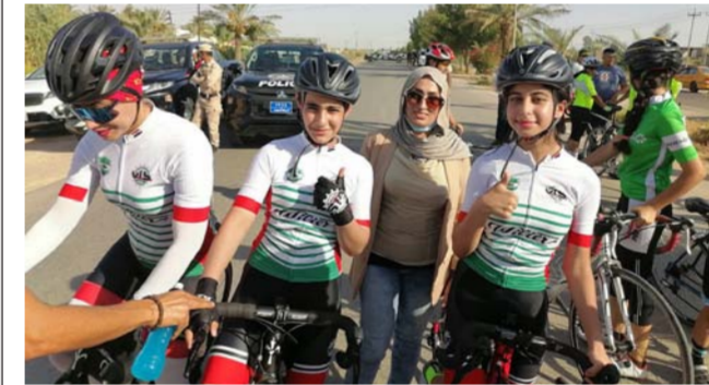
رشارفعت مع لاعبات الدراجات في البطولة

والتعاون بين اتحاد اللعبة والاتحاد الفرعي في المحافظة، منوهة إلى ان الجميع كان على قدر المسؤولية في البطولة وحثت الاندية الخمسة المشاركة في تحقيق النجاح والحصول على الفائزة الفنية من هذه المشاركة. واضافت ان فريق برايتي توج بالمركز الأول تلاه فريق الاعظمية