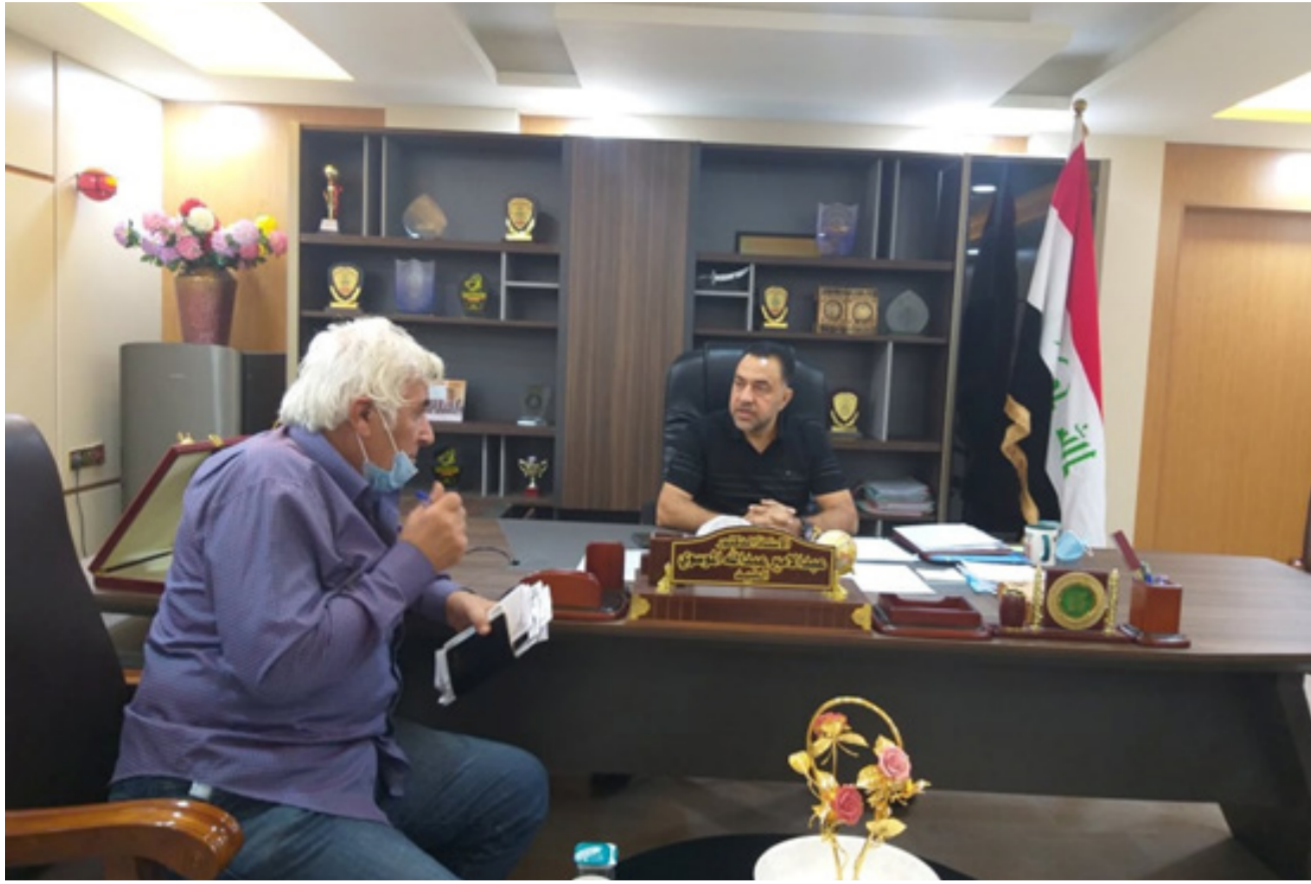
عميد كلية التمريض بجامعة البصرة يتحدث لمراسل الصباح الجديد

وتنمية مهارات التواصل عند الطلبة وتفاعلهم مع الاساتذة وهذا يندرج ضمن متطلبات جودة التعليم الإلكتروني . وأضاف عميد الكلية : الكلية أصبحت جزءا من كليات المجموعة الطبية لرفد المؤسسات الصحية بكوادر تمريضية متدربة في كافة علوم التمريض و على ايدي اساتذة ماهرين... وفي عام 2015 تم استحداث الدراسة المسائية فيها ليزداد بذلك اعداد الطلبة المقبولين فيها... وتمتاز الكلية بوجود مختبرات علمية متنوعة تغطي متطلبات الدراسة والتدريب فيها وأحد أهم هذه المختبرات هو مختبر (المهارات السريرية).