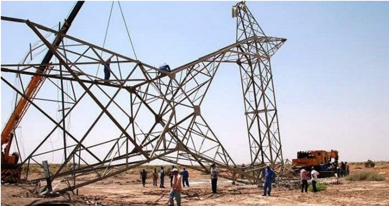
تخريب أبراج نقل الطاقة

هو إرهابي، فهناك من يحاول أن يوظف ذلك من أجل إيصال رسائل إلى العراق بلد غير مستقل ولم يستعد لإجراء الانتخابات المبكرة". يتابع هذه الخروقة، ويتواصل مع القوات الأمنية لإطلاع على خططها في حماية الأبراج وضمان عدم استهدافها مرة أخرى".