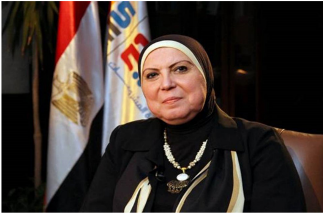
وزيرة التجارة المصرية

والشعوب العربية بأسرها. وأكد الرئيس المصري حرص مصر على الحفاظ على الأمن المائي العربي، والترحيب بموقف العراق والأردن المساندين للموقف المصري بشأن سد النهضة، وهي القضية التي تمثل إحدى أولويات السياسة المصرية، لتهددها المباشر للأمن القومي المصري بخلاف جوانبه، مجدداً التأكيد على أن موقف مصر الثابت يقضي بضرورة التوصل لاتفاق قانوني ملزم بشأن قواعد ملء وتشغيل سد النهضة.