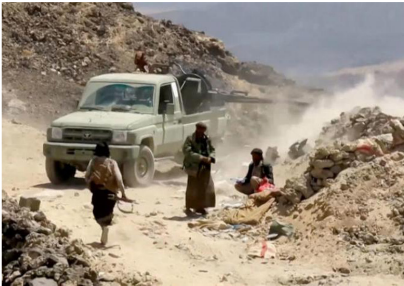
جانب من عمليات الدفاع التي نفذها الجيش اليمني اعلى