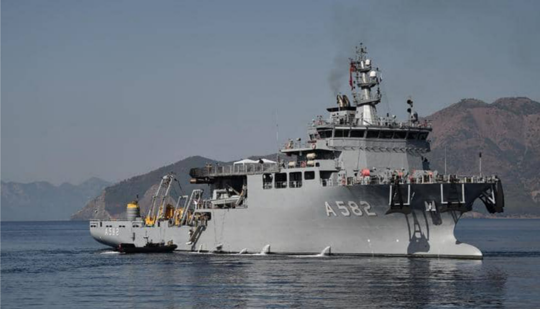
تركيا واليونان زادتا من وتيرة التسليح بعد أزمة شرق المتوسط

وقبول أستاذ علم الاقتصاد السياسي في كلية لندن، إيمانويل كاراغيانيس في حديثه: "المشكلة أنه يمكن استخدام هذه الغواصات لجمع المعلومات الاستخباراتية في المياه المتنازع عليها، كما أن الغواصات قد تكون مسلحة بصواريخ متوسطة النطاق مضادة للسفن، والتي يمكن أن خيد إلى حد كبير القدرات اليونانية