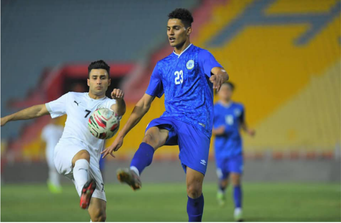
لقطة من مباراة الطلبة والميناء في دوري الكرة الممتاز

وفي سياق آخر تختتم اليوم الثلاثاء 6 تموز الجاري مباريات الجولة 35 لدوري الكرة الممتاز باقامة مباراتين. ارتيل يضيف الكهرياء في ملعب فرانسوا حبري في الساعة السابعة مساءً، ويلتقي في ملعب الشعب الدولي فريق الشرطة والحدود في الساعة التاسعة والنصف مساءً. كذلك، حقق فريق الطلبة فوزاً كبيراً على ضيفه الميناء 2-4، المباراة التي أقيمت مساءً أول أمس.