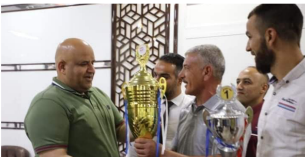
كأس المحافظات بالشايطية لمداظ صلاح الدين

استمرار دعم الرياضيين والفئات للألعاب والأنشطة الرياضية. وشكر الجبر الوفد الرياضي واكد