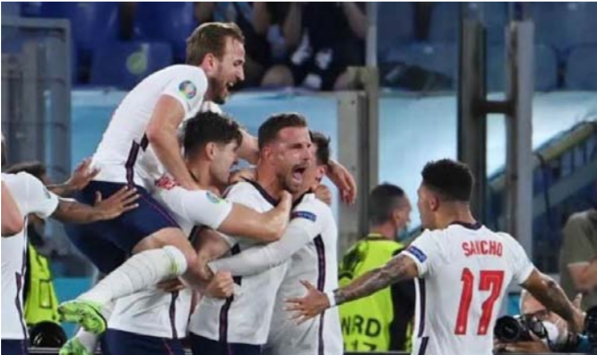
إنجلترا تعزز تفوقها الأوروبي

مهاجم جمهورية التشيك هدف بلاده الوحيد في مرمرى المنتخب التشيكي في المباراة التي انتهت بفوز التشيك (2-1) في إطار الدور ربع النهائي من بطولة أم أوروبا "يورو 2020". وهذا هو خامس أهداف شيك في البطولة فتساوى بذلك مع الأسطورة البرتغالية كريستيانو رونالدو على رأس قائمة هدافي البطولة. وأحرز شيك هدفين في شباك اسكتلندا وهدف في شباك كرواتيا في دور المجموعات قبل أن يسجل في شباك هولندا في ثمن النهائي.