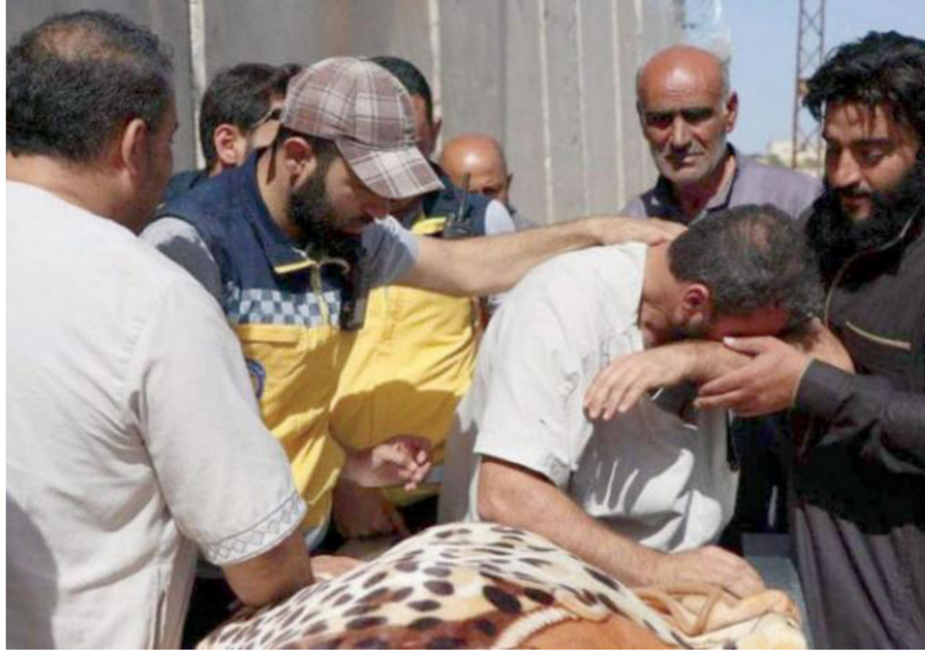
سوري يبكي احدي ضحايا قصف النظام السوري على جبل الزاوية