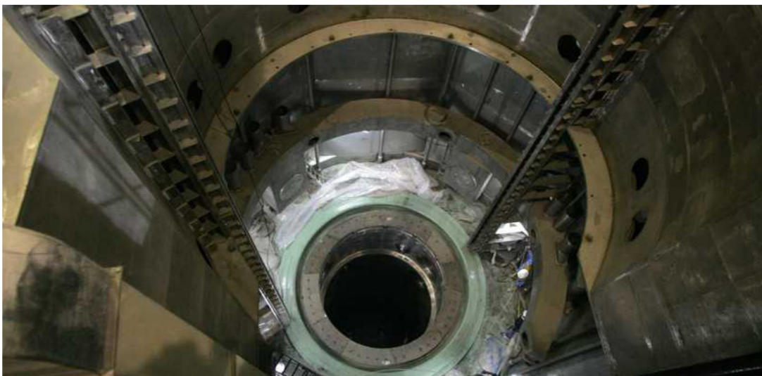
من موقع نطنز

على الأحداث الجارية في فيينا لإحياء الاتفاق النووي، الذي أبرم في العاصمة النمساوية، في 2015، بين إيران والدول الكبرى قبل أن تنسحب منه الولايات المتحدة في عهد الرئيس السابق دونالد ترامب. وأتاح اتفاق 2015 رفع عقوبات كانت مفروضة على طهران، مقابل الحد من أنشطتها النووية وضمان سلمية برنامجها. لكن فعالية هذا الاتفاق باتت في حكم اللغاة منذ أن قرر ترامب سحب بلاده عقوبات فاسية على إيران. وأبدى الرئيس الأمريكي، جو بايدن، عزمه على إعادة بلاده إلى الاتفاق، بشرط عودة طهران إلى كامل التزاماتها بموجب، والتي بدأت التراجع عن غالبيتها تدريجيا بعد عام من انسحاب الولايات المتحدة منه.