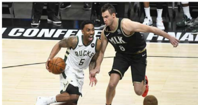
باكس يتألق سلويا

لعبه النجم ترائي ياغ في المباراة السادسة أمام باكس. لكن ذلك لم يغير من الأمر شيئاً. وكان ياغ بعيداً عن مستنواه ونجح في أربع تصويبات فقط من 17 محاولة في أجمل فشنل في تسجيل أي ثلاثية من ست محاولات في طريقه لإنهاء المباراة مسجلاً 14 نقطة. واستفاد ميلووكي من تألق ميلدنون الذي سجل 32 نقطة وهوليداي الذي أحرز 27 نقطة ليحقق انتصاره الثاني على التوالي بعد أن عادل هوكس النتيجة في السلسلة 2-2.