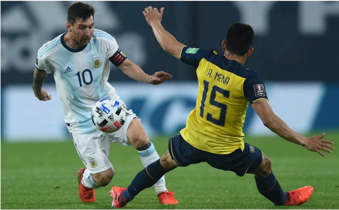
ميسي في محاولة لتجاوز مدافع الإكوادور

ركلات الترجيح تبثسم لكولومبيا على حساب أوروغواي