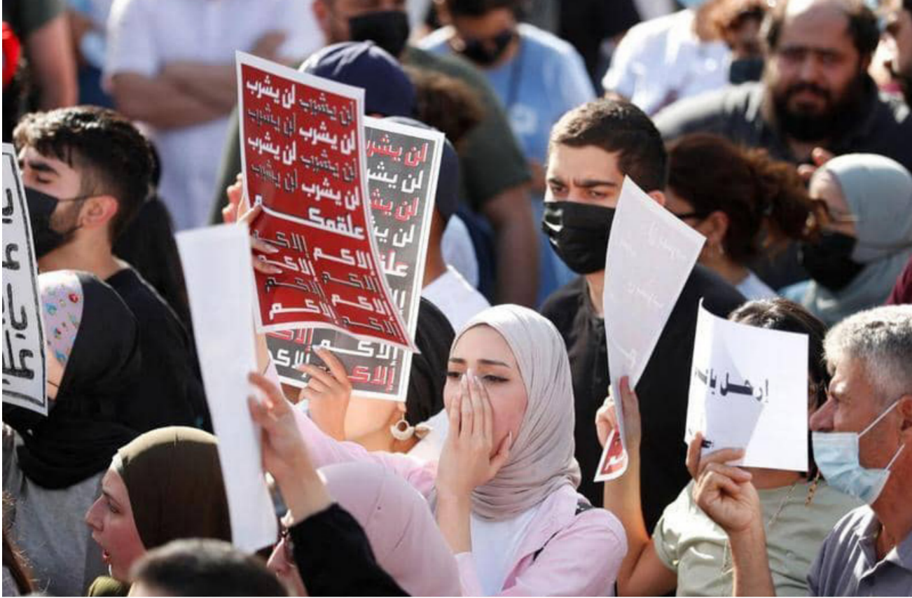
الامن الفلسطيني منع المتظاهرين من الوصول لمقر الرئيس عباس

يوم الخميس خيمة عزاء بنات في الخليل والتقسوا أرملته وأطفاله ودعوا في بيان لهم إلى "تحقيق مستنقل وشفاف يقدم الجناة للعدالة". كما كان من الناشطين على مواقع التواصل الاجتماعي المعروفين بتوجيه انتقادات حادة للسلطة الفلسطينية ولترئيسها محمود عباس وتم اعتقاله أكثر من مرة خلال السنوات الماضية. وزار دبلوماسيون من الاتحاد الأوروبي