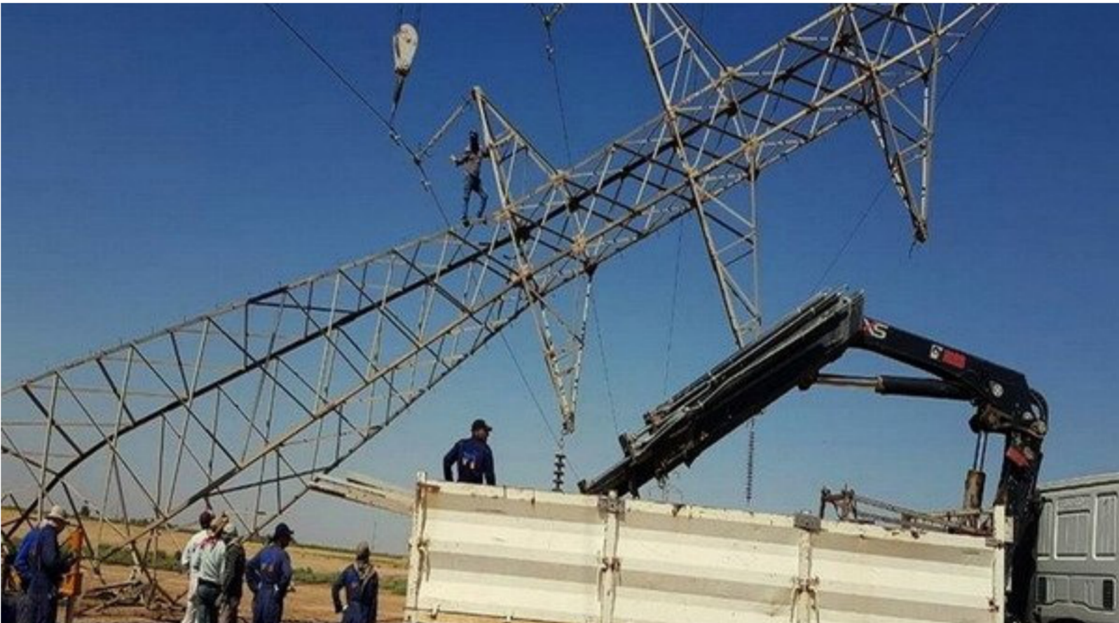
أحد خطوط الطاقة المتعرضة لعمليات التخريب

الآخرى". وذكر العقابسي، أن "الموضوع تشترك فيه أيضاً وزارة الأبراج في توفير الحماية للأبراج وخطوط النقل. فضلاً عن وزارة النفط المسؤولة عن تجهيز وزارة الكهرباء بمجزل عن الجهات