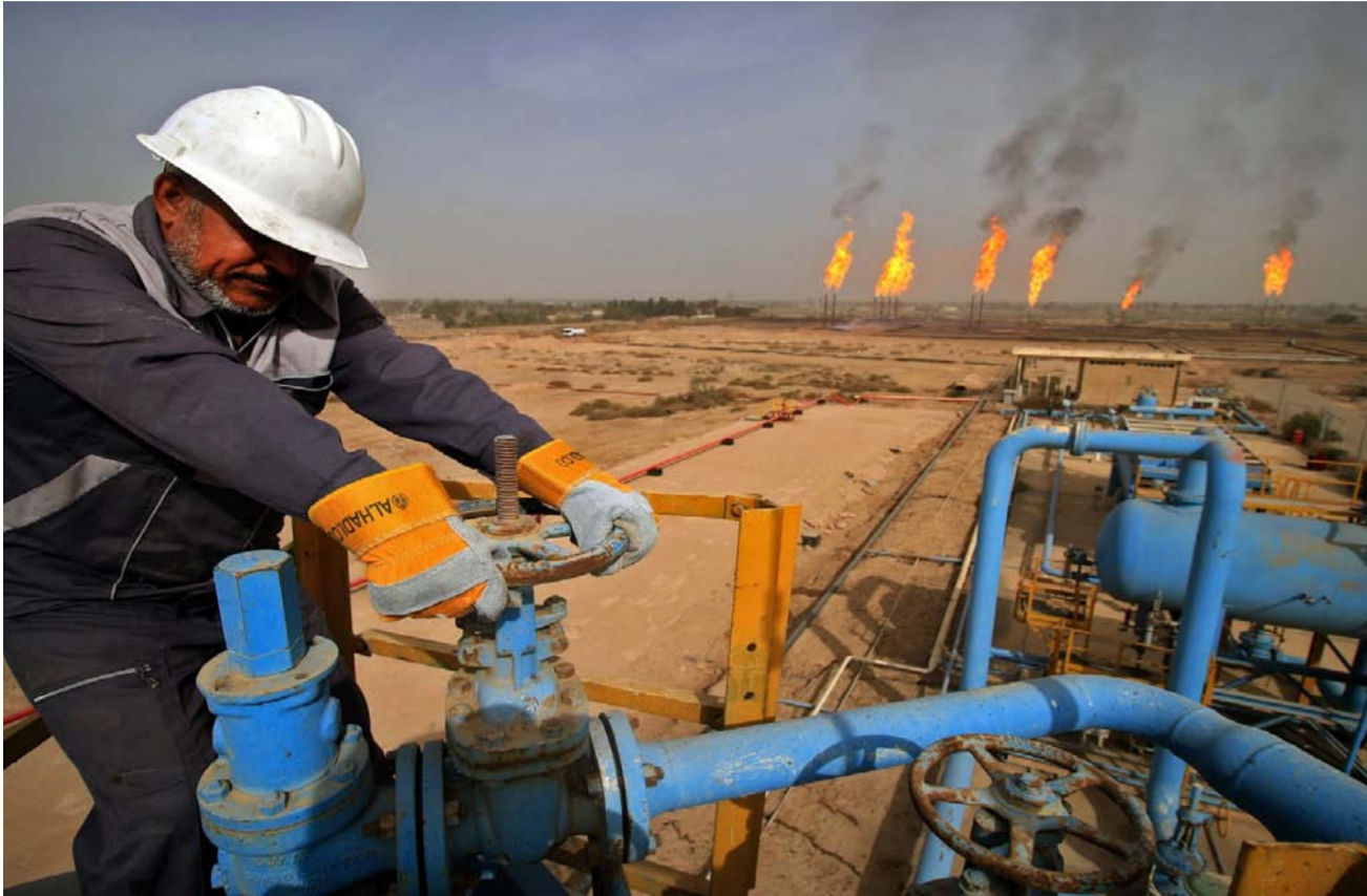
محطة نفطية في البصرة

الوقود. وقال الأمين العام لمنظمة أوبك+ محمد باركيندو يوم الثلاثاء إن الطلب في النصف الثاني سيكون خمسة ملايين برميل يوميا أعلى مما كان عليه في الأشهر الستة الأولى من العام. ومع ذلك، هناك العديد من العوامل التي يمكن أن تؤدي إلى التراجع عن الارتفاع، فإذا توصلت الولايات المتحدة إلى اتفاق نووي مع إيران، فقد يؤدي إنهاء العقوبات يوميا إلى تدفق إمدادات جديدة. وهناك تهديد لتعافي الطلب من سلالته "دلتا" للتحورة من كوفيد-19، شديدة العدوى، الذي يعيد بالفعل بعض البلدان إلى الإغلاق الجزئي، ويسببهم في ارتفاع مقلق في الحالات في دول أخرى. وقالت فاندانا هاري، مستشارة للاستشارات النفطية: "انفجار داخلي آخر في أوبك+، مثل نيسان الماضي غير مرجح". لقد عملوا بجد خلال العام الماضي لأجواز الانفاقية بشكل كبير حتى هذه المرحلة، أتوقع أن تتم الصفقة المبدئية بين المملكة العربية السعودية وروسيا، ولكن قد يتم تقديم نوع من الامتياز إلى الإمارات العربية المتحدة".