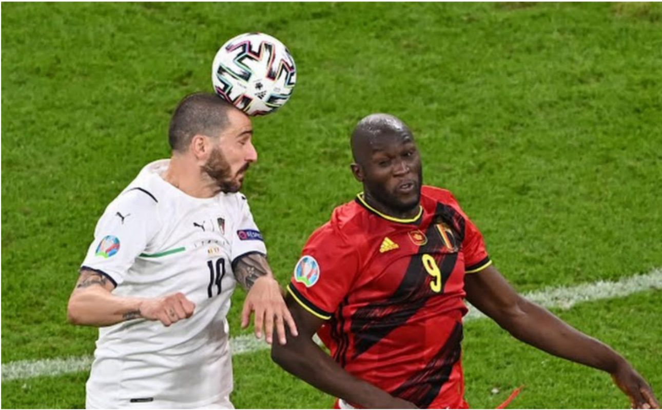
صراع على الكرة في مباراة إيطاليا وبلجيكا

وقشلت سويسرا في فك عقدة ربع النهائي في بطولة كبرى. إذ انتهت مشوارها عند هذا الدور للمرة الرابعة بعد كأس العالم 1934 و1938. عندما خسرت أمام النمسا 7-5 في أعلى مباراة تهديفية في تاريخ المونديال وكان المنتخبان تأملا إلى الدور ربع النهائي الاثني في يوم دراماتيكي الأكثر إثارة في البطولة القارية.