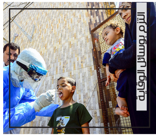
الترم بوسائل الوقاية

السنة الرابعة عشرة يومية سياسية مستقلة صاحب الميثار رئيس التحرير اسماعيل زاير alsabahajaded@gmail.com assabahajaded@yahoo.com www.newsabah.com