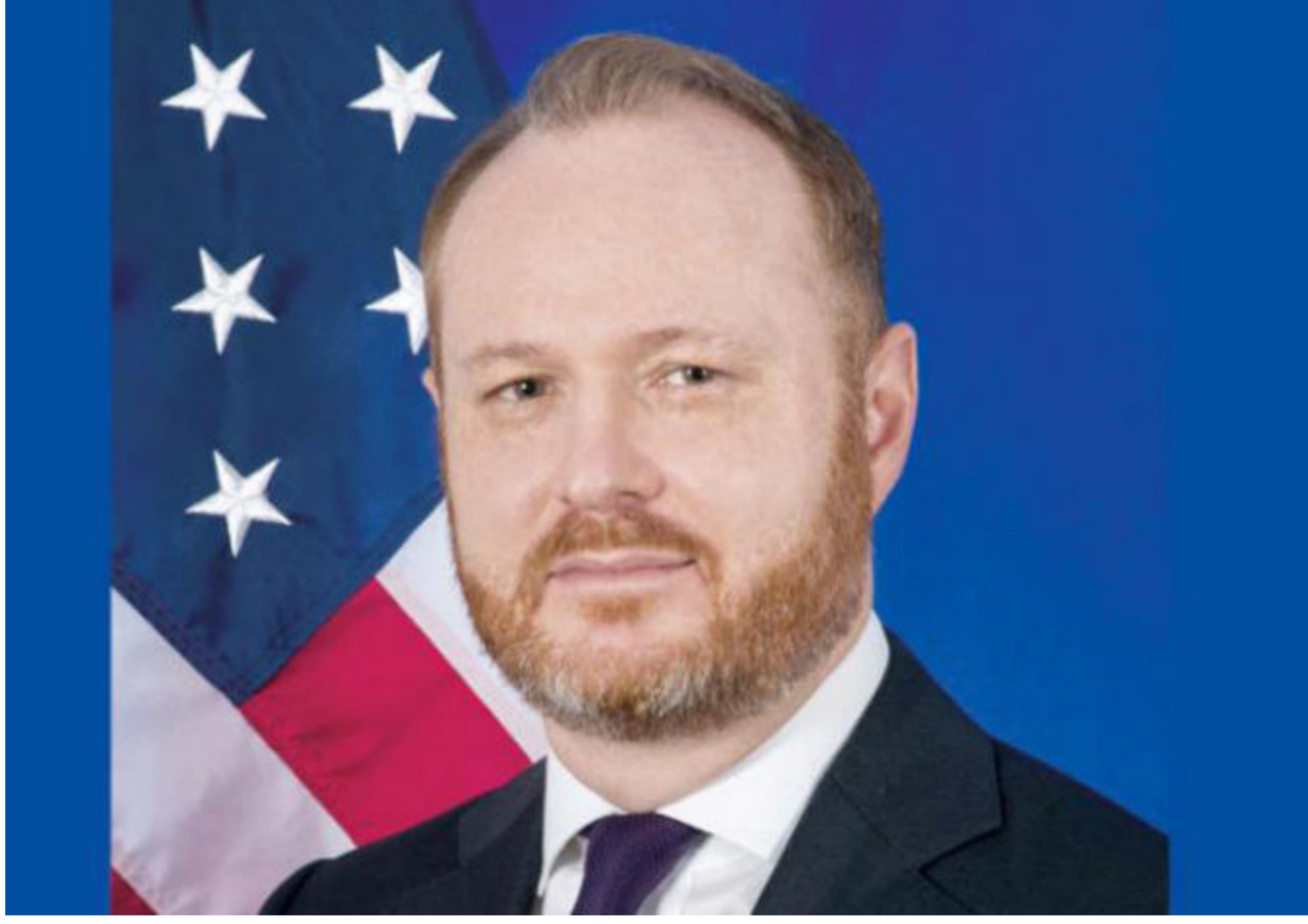
القائم بأعمال المبعوث الأمريكي للحلفاء الدولي ضد تنظيم داعش جون غودفري

قيادة "داعش" ما زالت تركز على سوريا والعراق؛ لما لهما من "رمزية" كونهما المنطقة التي انطلق منها "خلافتهم" المزعومة عام 2014