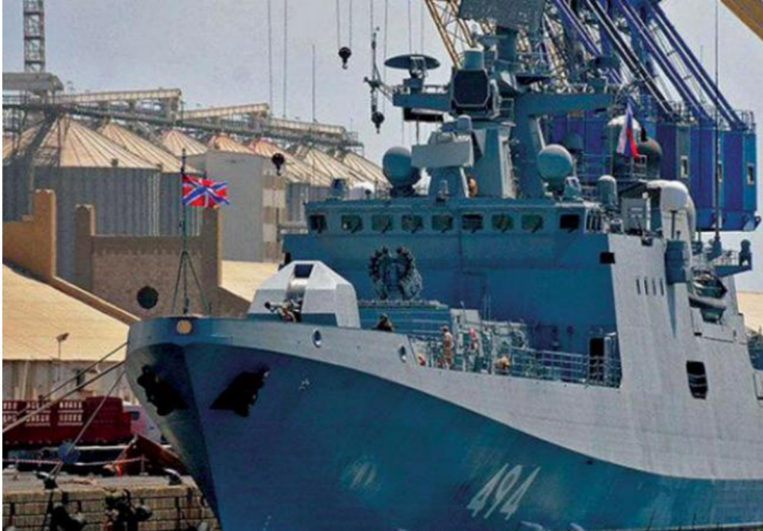
من قطع السلاح البحري الروسي

ووفقاً لبيان الكرملين، فقد "أحال" الرئيس الروسي فلاديمير بوتين مشروع الاتفاق الموقع مع الخرطوم