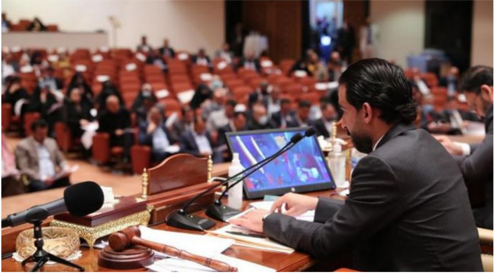
مجلس النواب "رشيف"

وبالتالي تأتي الحاجة إلى استضافة الخمداني". وقال أن "البرلمان ينبغي إطلاعه على الجهود الحكومية بشأن الحصول على حصص العراق المائية من دول الجوار، وما وصلت إليه المحادثات بهذا الشأن".