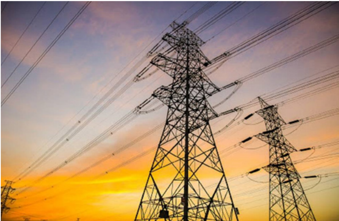
خطوط النقل الكهربائي

من جانب آخر، إضافة لمشروعات جار تنفيذها في العراق لحل الأزمة المرتمة التي تتفاقم في أشهر حزيران وتموز وأب. حيث تزيد درجة الحرارة في بعض الأحيان على 50 درجة مئوية. وفي كانون الأول الماضي، خفضت إيران كميات الغاز المصدرة للعراق بنسبة 40 في المئة بسبب عدم تسديد بغداد للديون المستحقة ما أسهم في تفاقم الأزمة وفقدت معه بغداد نحو 6 آلاف ميغاواط في كلاً من العراق وسوريا. وتراجعت إنتاج الطاقة إلى مستويات غير معهودة وللمرة الأولى منذ