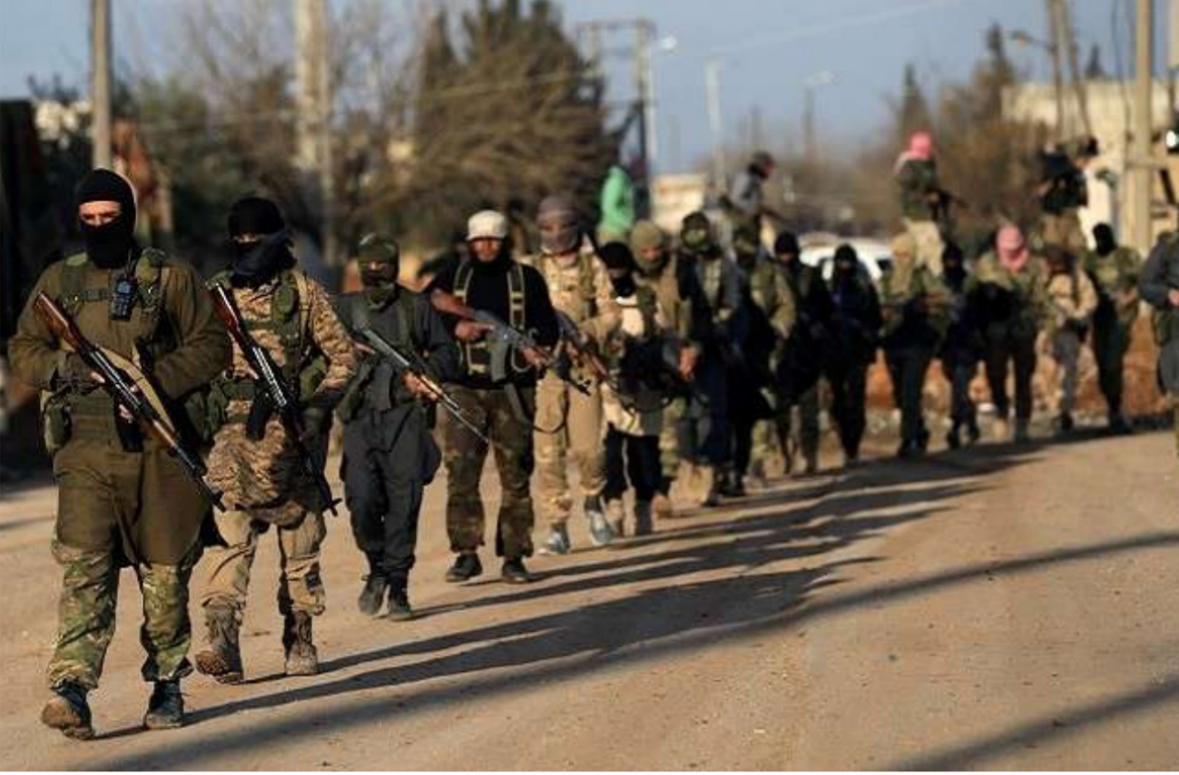
فصائل مسلحة سوريا