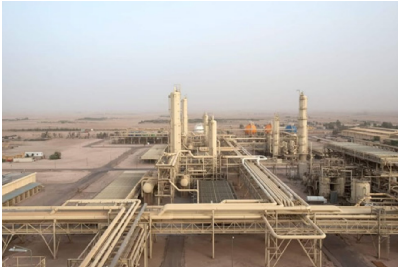
شركة غاز البصرة

وقرض بقيمة 42.24 مليون دولار أمريكي من خلال برنامج محفظة الإقراض المشترك مع مؤسسة التمويل الدولية، والذي يوجبه حصل الشركة على مبلغ قدره 360 مليون دولار، الأمر الذي سيقضي على تمويل الشركة من المضي قدماً بخطتها الخمسية في التقدم نحو المنافسة الدولية، فضلاً عن دعم المشاريع المحلية وفرد شبكة الكهرباء الوطنية، نحن مع الشركة من شركة غاز الجنوب وبالتعاون مع الشركة من شركة نشل حرق الغاز الطبيعي ودعم من وزارة النفط نعمل من أجل تحقيق رؤية الحكومة لتعظيم الاستثمار بالغاز.