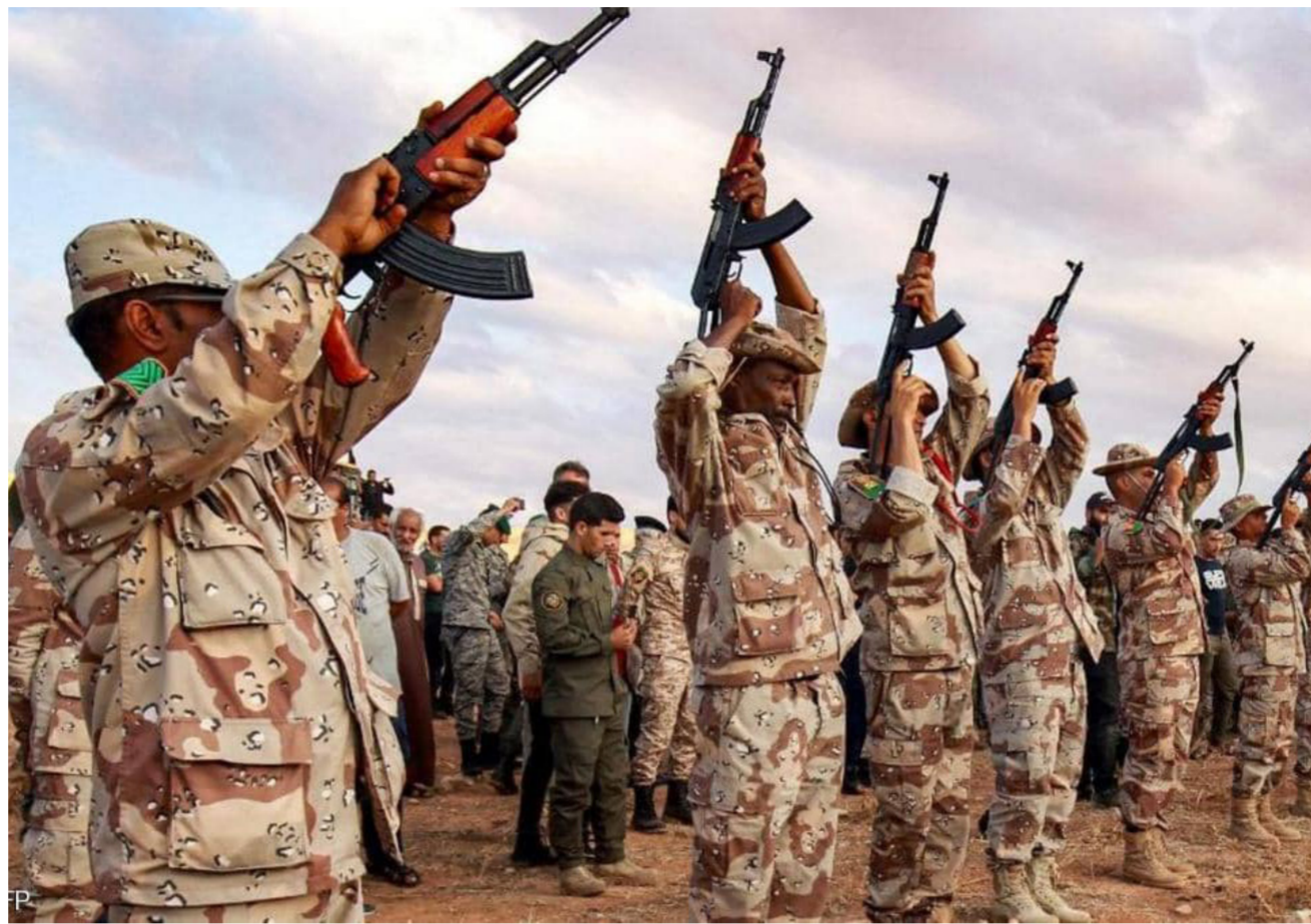
عناصر من الجيش الليبي

أشاد الأخاد الدولي للاتصالات التابع للأمم المتحدة بتنامي التزام بلدان العالم بالتصدي للتهديدات الأمنية السيبرانية والحد منها. وذكر الأخاد في نسخته الرابعة من الرقم القياسي العالمي للأمن السيبراني لعام 2020، أن سرعة الإقبال على استخدام تكنولوجيا المعلومات والاتصالات أثناء تفشي جائحة كورونا وضع قضية الأمن السيبراني في الصدارة. وقيس الرقم القياسي العالمي للأمن السيبراني مستوى تنفيذ الالتزامات التي قطعتها 193 دولة عضوا في الأخاد الدولي للاتصالات في مجال الأمن السيبراني، ويستهدف خديد الفجوات القائمة في هذا المجال وتوجيه الاستراتيجيات الوطنية فيها بوصفه خريطة طريق، وإرشاد الأطر القانونية ذات الصلة، وبناء القدرات، فضلا عن إبراز الممارسات الجيدة، وتعزيز