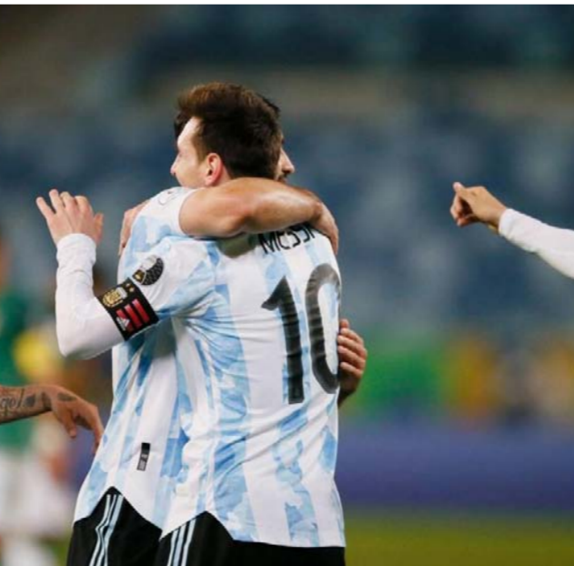
الأرجنتين تحتفل بالفوز

بهدف لكل منهما، في مباراة غاب عنها نيمار تماماً حيث ظل على مقاعد البدلاء طوال الـ90 دقيقة. وقال تبني في تصريحات نقلتها صحيفة «موندو ديوريفو» الإسبانية: «كل التقدير لجوستافو ألفارو (مدرب