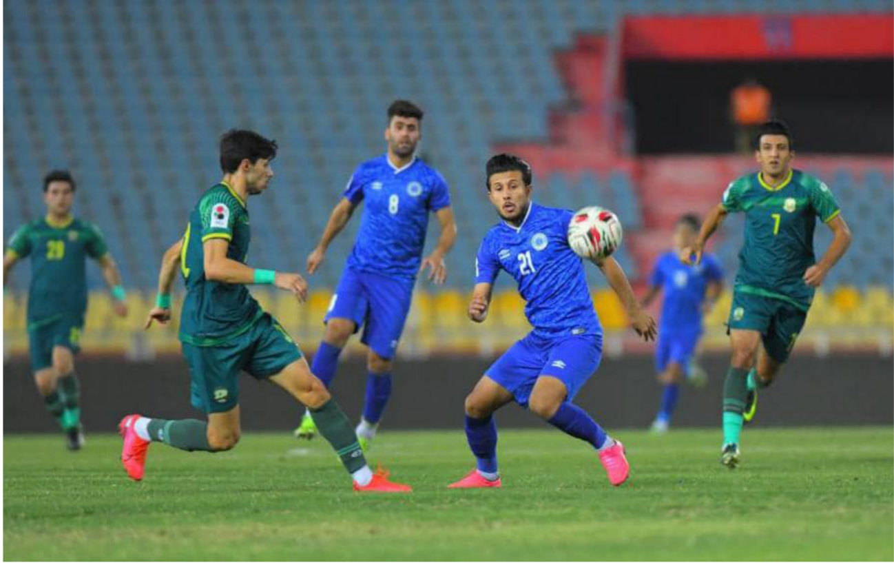
جانب من مباريات دوري الكرة الممتاز

جُرى اليوم الأربعاء الموافق 30 حزيران أربع مباريات في افتتاح الجولة 34 لدوري الكرة الممتاز إذ يضيف ملعب الشعب الدولي مباراة الطلبة والنطف في الساعة التاسعة والنصف مساءً، في حين تقام مباراة زاخو والديوانية في ملعب الأول في الساعة الخامسة الأربع مساءً. وفي التوقيت ذاته تقام في ملعب النجف الدولي مباراة نطف الوسط وأمانة بغداد. في حين يتواجه أبناء والفاسم في ملعب الفيحاء في الساعة السابعة والرابع مساءً. وتستكمل مباريات الجولة في اليوم التالي بإجراء 6 لقاءات. الجولة المتصدر يلعب أمام الشرطة في ملعب الشعب الدولي في الساعة التاسعة والنصف مساءً. في حين يلعب السماوة والزوراء في ملعب الأول في الساعة الخامسة الأربع مساءً. ويلتقي في ملعب التاجي فريقا الحدود وأربيل في التوقيت ذاته. ويلعب النجف والصناعات الكهربائية في ملعب النجف الدولي في الساعة السابعة والرابع مساءً. وفي التوقيت نفسه تقام في ملعب الفيحاء مباراة نطف البصرة ونطف ميسان. وفي ملعب الساحر أحمد راضي تقام مباراة الكرخ والكهرباء في الساعة الخامسة الأربع مساءً. ويقف الجوية في صدارة ترتيب أندية الدرجة الممتازة برصيد 73 نقطة. يأتي خلفه فريق الشرطة وله 65