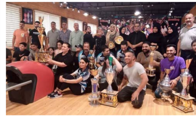
ختام ناجح لكأس المثابرة بالبولينغ

أصحاب المراكز الأولى وجاءت النتائج النهائية بحصول نادي أمانة بغداد على المركز الأول فئة الرجال فيما حل نادي المرور على المركز الثاني اما فئة النساء خطف نادي المرور المركز الأول وحل أمانة بغداد بالمركز الثاني. وقدمت عضو اتحاد اللعبة.