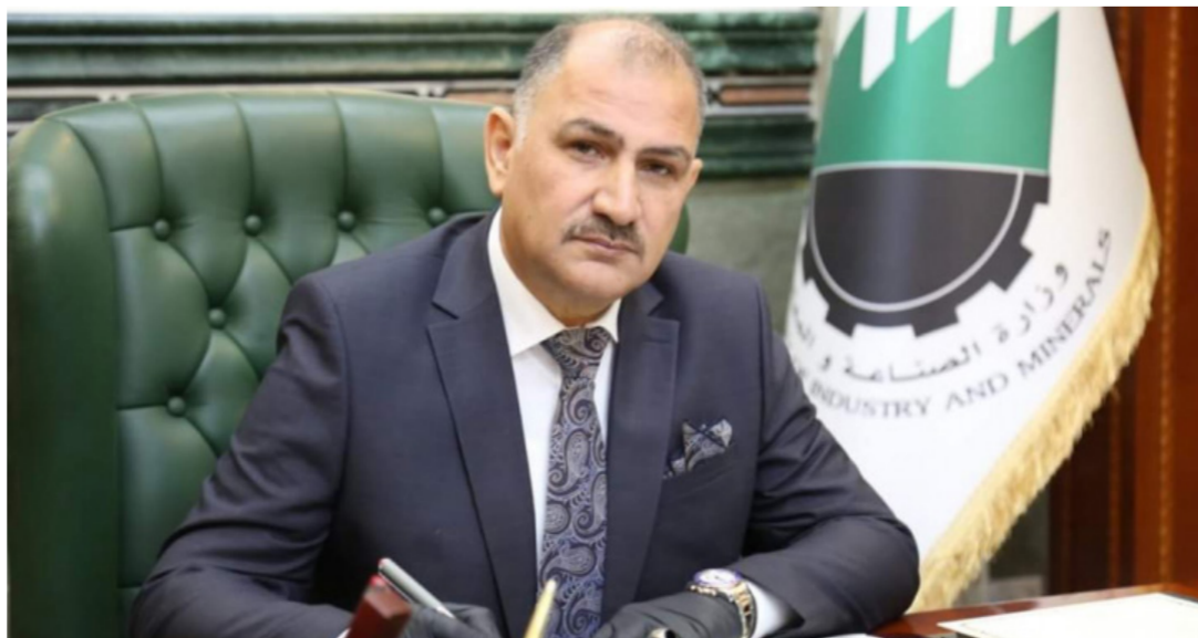
وزير الصناعة والمعادن السيد منهل عزيز الحجاز

وخدمات الوض الإقتصادي والوباني . والتي تعكس الإمكانيات والقدرات التصنيعية والإنتاجية المتاحة للشركات المشاركة . هذا وقد شهد حفل افتتاح فعاليات المعرض إلقاء كلمات تنغني بالعراق وأهمية إقامة المعرض كحدث إقتصادي مهم للترويج عن الصناعات الوطنية وعقد جلسة حوارية بين مدير عام البنك المركزي العراقي/ فرع الموصل ورئيس اتحاد الصناعات العراقي حول دور البنك المركزي العراقي في تمويل ودعم القطاعات الصناعية والزراعية وفعاليات أخرى كما شهد المعرض والذي سيستمر لغاية ٣٠ حزيران الحالي توافد كبير للمواطنين والزائرين في تظاهرة إقتصادية غير مسبوقه والأولى من نوعها في محافظة نينوى ومدينة الموصل الحدياء .