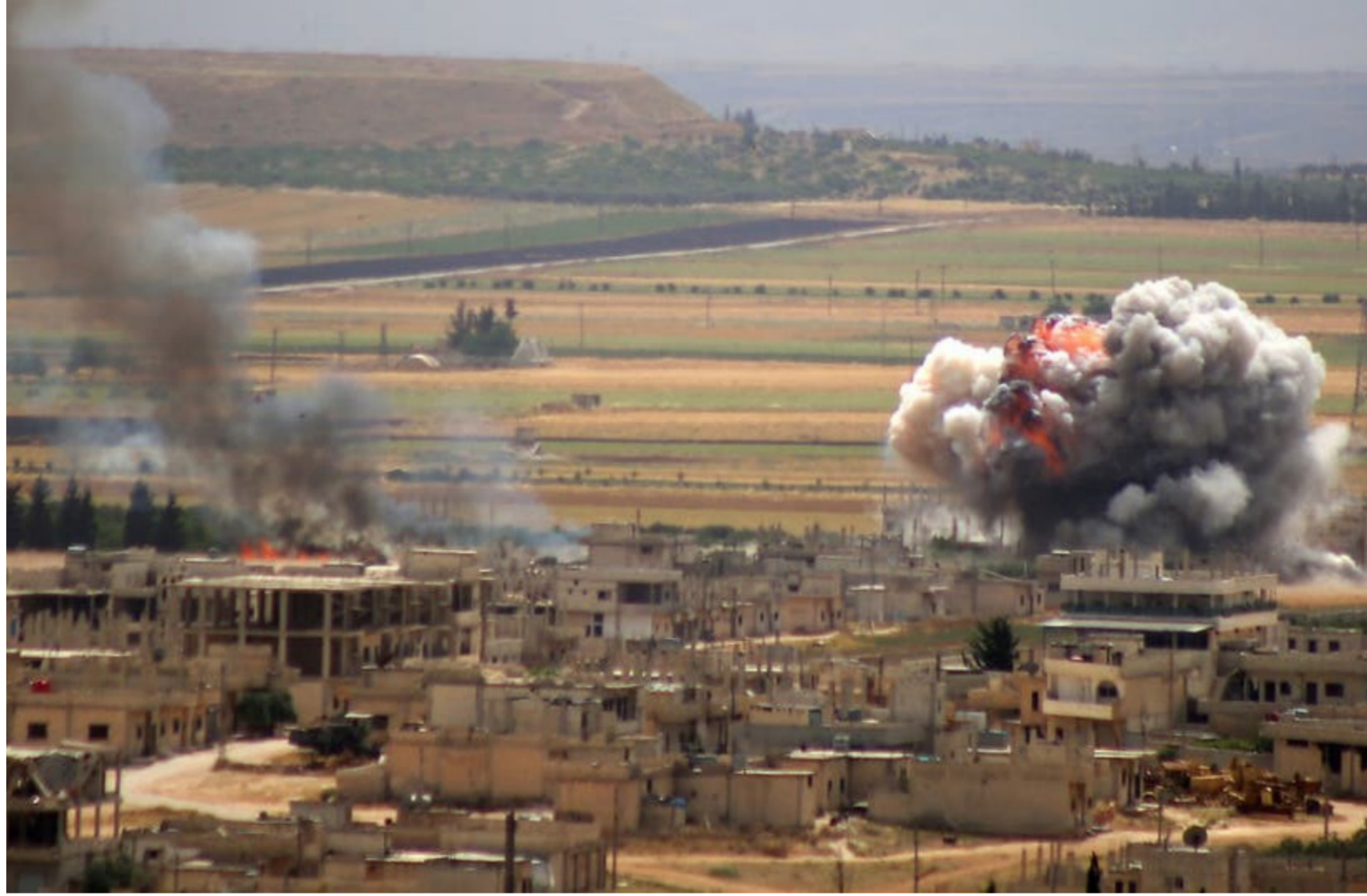
قصف مدفعي تركي على ريف ادلب

الأمن ضمن مناطق درع الفرات وغصن الزيتون. "في إشارة إلى مناطق خاضعة لسيطرة النفوذ التركي وفصائل سورية موالية للقضاء بعد التحقيق معهم، القيام بحملة واسعة، للقبض على المتورطين بعمليات سطو وسرقة وسلب، فضلاً عن ملاحقة المتورطين بعمليات التفجير التي تشهدها تلك المناطق وتقديمهم للقضاء بعد التحقيق معهم، لنيل جزائهم العادل. لافتاً إلى أنه تم اعتقال حوالي 30 مطلوباً للقضاء حتى الآن في مناطق جرابلس شمال حلب. مع الإعلان عن حظر جُول للمدنيين بغية الحفاظ على سلامتهم أثناء عمليات الدعم لنزال المطلوبين.