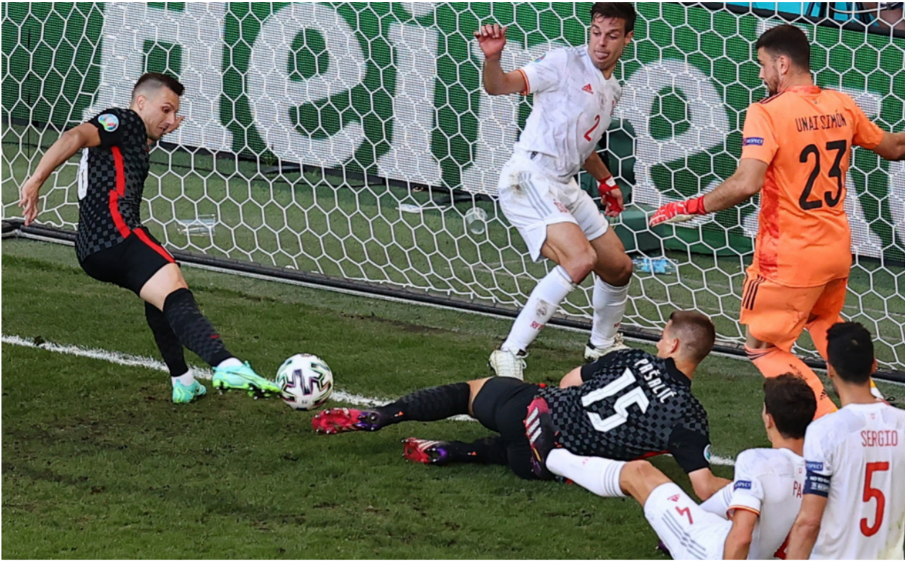
صراع على الكرة في مباراة إسبانيا وكرواتيا

من جانب آخر فرض النجم كريم بنزما مهاجم منتخب فرنسا نفسه بقوة خلال مباراة سويسرا، سجل كريم بنزما هدفين في دقيقتين تقريبا ليقلب النتيجة إلى تقسيم الديوك على سويسرا بنتيجة 2-1، وذكرت شبكة «أوبتا» أن مهاجم الديوك بات أول لاعب فرنسي يسجل هدفين على الأقل في مباراتين متتاليتين بالبطولات الكبرى (كأس العالم وكأس الأمم الأوروبية)، منذ أن سبقه لهذا الإنجاز الأسطورة ميشيل بلاتيني. ولقمت إلى أن بلاتيني سجل ثلاثية في شبك بلجيكا ثم هانريك أمام بونغوسلافيا في مباراتين متتاليتين ببطولة يورو 1984، يذكر أن كريم بنزما سجل هدفين في المباراة الماضية ضد البرتغال في ختام منافسات الدور الأول، واجهت المباراة إلى الشوطين الإضافيين بعدما انتهى الوقت الأصلي للمباراة المثيرة جدا بالتعادل 3-3.