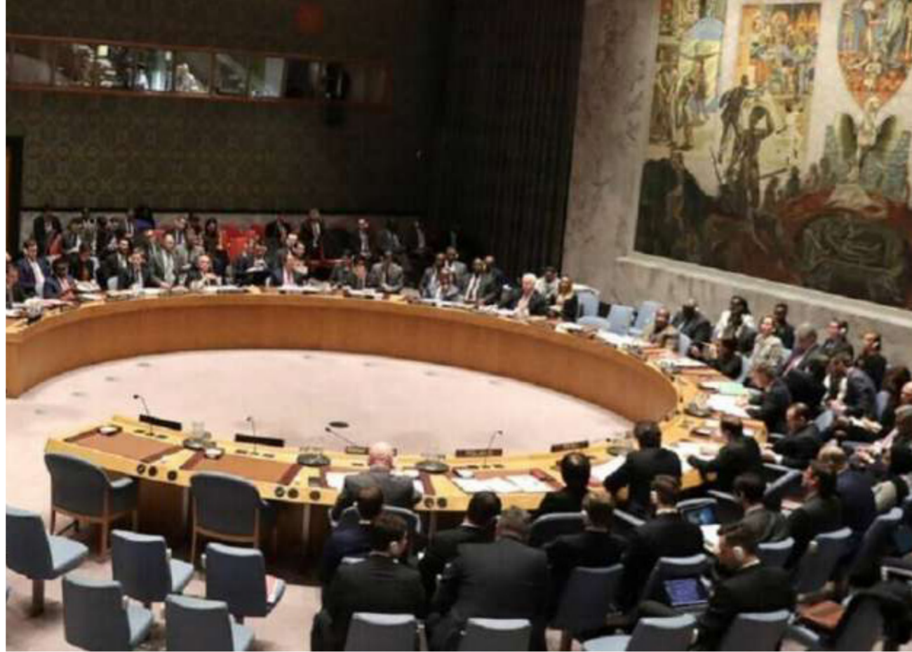
مجلس الامن - صورة ارشيفية

منذ اندلع النزاع في تيغراي في مطلع تشرين الثاني لم ينجح الغرب يوما في عقد جلسة عامة لمجلس الامن حول الإقليم الواقع في شمال أثيوبيا ذلك أن الدول الأفريقية والصين وروسيا وأعضاء آخرين في المجلس يعتبرون هذه الأزمة شأنًا أثيوبيا داخليا.