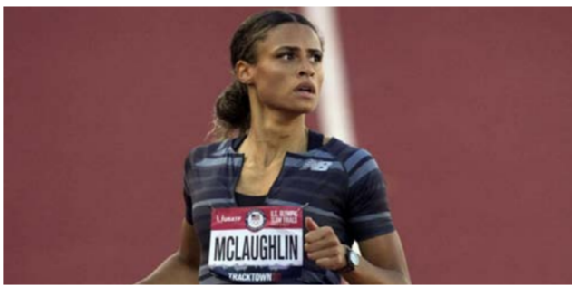
الأميركية سيدني ماكلافلين

ماكلافلين التي تفوقت في الخط المستقيم الأخير وبدت مصدومة بعد خطبمها الرقم العالمي، ولم يكن موسم محمد وريدا، إذ أصيبت بفيروس كورونا مطلع السنة.