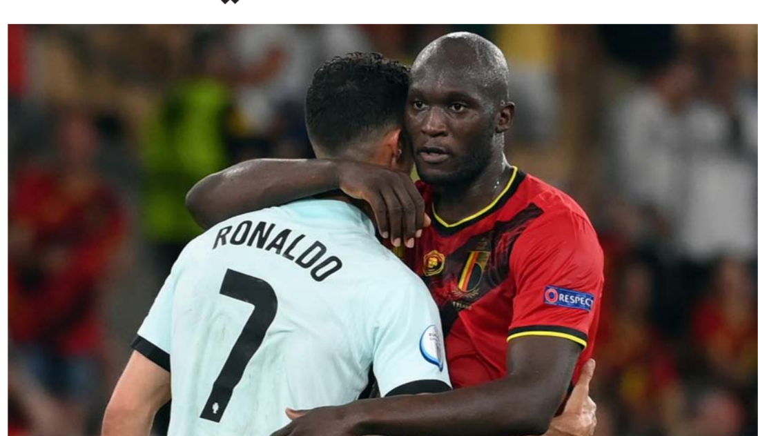
روح رياضية عالية بين لوكاكو و رونالدو

الصد، وبحسب شبكة «سكواكا» للإحصائيات، سجل «الدون» هدفاً واحداً فقط من 52 محاولة على مستوى الركلات الحرة، مع منتخب البرتغال في البطولات الكبرى، وسدد رونالدو 28 ركلة حرة في بطولات اليورو، ولم يسجل منها أي هدف، فيما أحرز هدفاً واحداً من 24 محاولة في كأس العالم، وكان ذلك أمام إسبانيا في مونديال 2018 بروسيا. وحقق المنتخب التشيكى مفاجأة منتخبة تشيكوسلوفاكيا عام 1976، وبطاقتين حرمواين أمام التشيك عامي 2004، و2020، كان التشيك الهولندي تاهل للدور ثمن حسم للنتيجة 80، بهذا الانتصار للدور ربع النهائي للبطولة، لمواجهة الدنمارك التي توقفت على ويلز، تلقى ماتياس دي ليخت، مدافع منتخب هولندا، بطاقة حمراء خلال مواجهة التشيك، وشهدت الدقيقة 68 خروج بطاقة حمراء في وجه