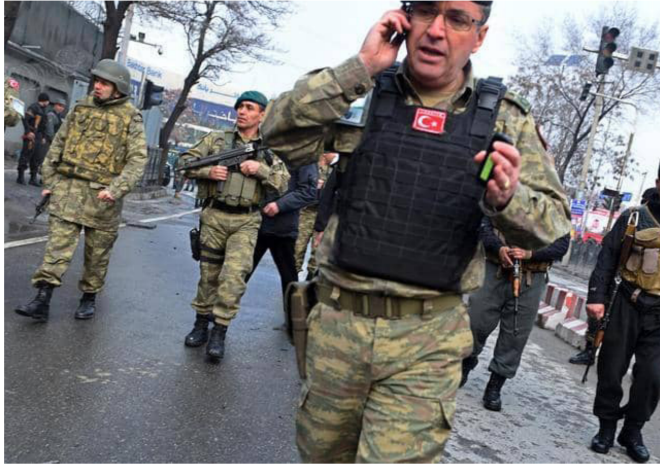
تمتلك تركيا قوات في افغانستان