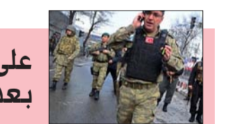
عودة للحياة الطبيعية، يأتي ذلك ترافعا مع تأكيد خلية الإعلام الأمني العمل على تنسيق الجهود الحكومية لدعم الخطة التي وضعتها وزارة الصحة لمواجهة الوباء، ولاسيما في ما يتعلق بزيادة وتيرة توزيع اللقاحات، لمضاعفة

ومن جانبها، اعتبرت لجنة الصحة في مجلس النواب ان من المبكر التفاوض بشأن "كورونا" في وضع البلاد الحالي نتيجة عزوف الكثير من المواطنين عن اخذ اللقاحات المضادة للفيروس، بينما يرى اختصاصيون طبيون انه متى ما وصلت نسبة اللقاحات في العراق إلى سبعين بالمئة فحينها سيكون اطمئنان