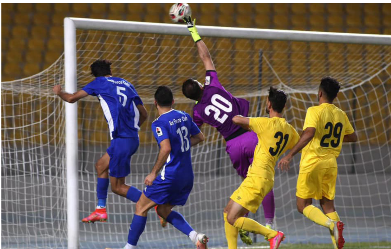
لقطة من مباراة الجوية وأربيل