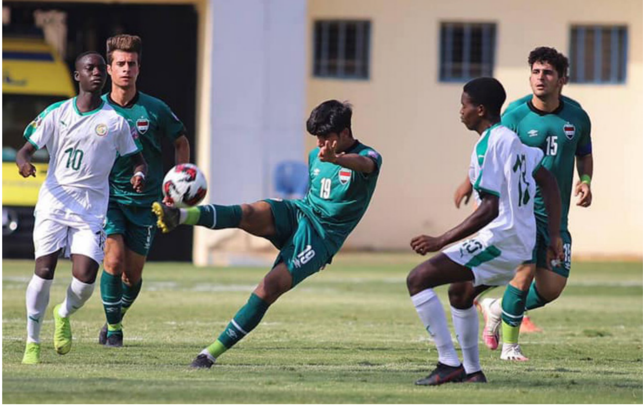
لقطة من مباراة أمس بين منتخبنا الشبابي والسنغال