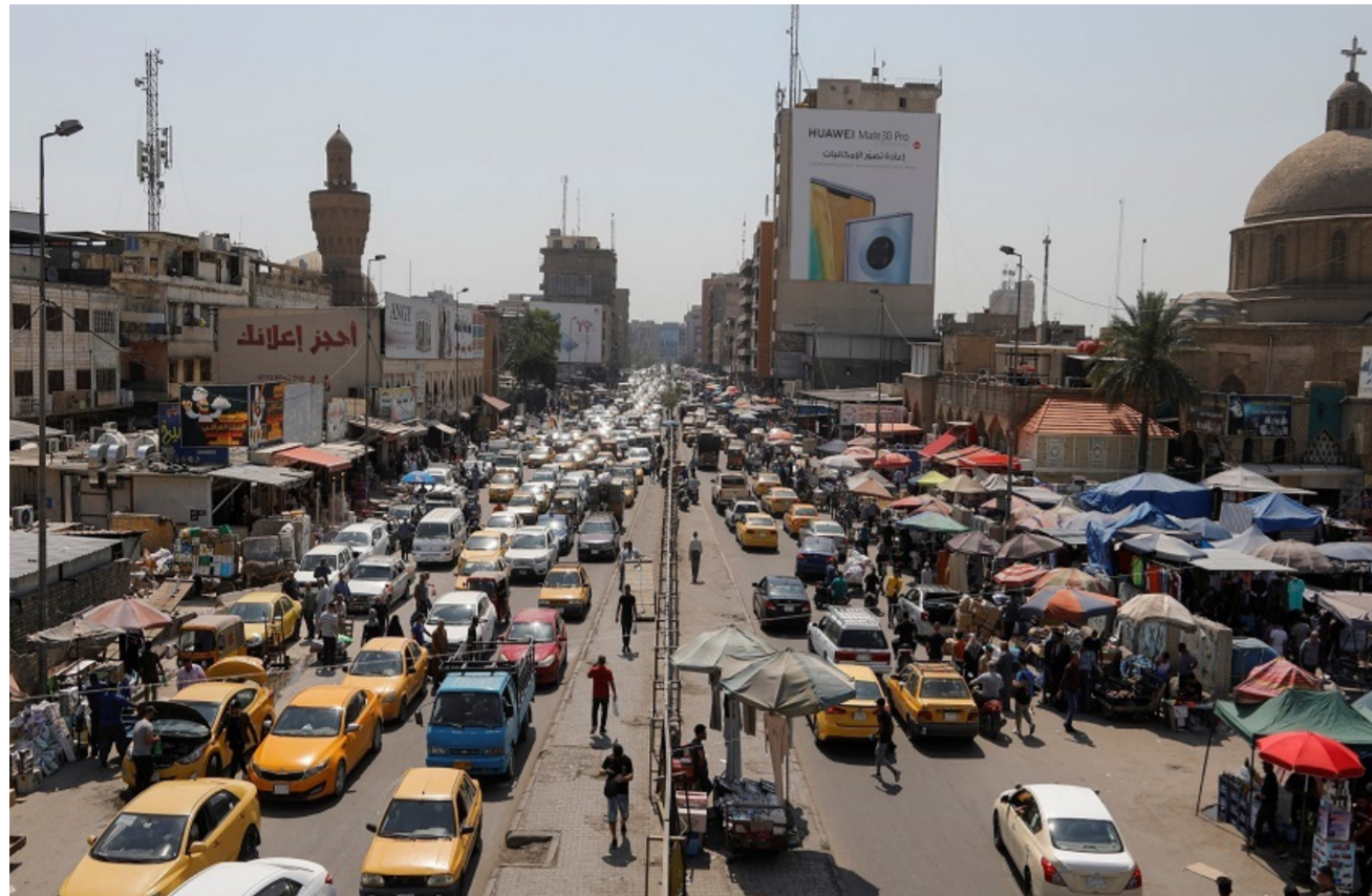
سوق الشورجة وسط بغداد

والزراعة النقدية والسياحة ومجالات الخدمات وخويل العراق إلى قوة منتجة متنوعة شريطة توجيه إيرادات النفط بين الأعوام 2022 - 2032 إلى صناعات تمويل النشاط الخاص المنتج وتوفير قانون شجاع للامن والحماية الاجتماعية ضد أشكال البطالة، مختتماً بالقول: "هنا سيتولد نظام اقتصادي مزدهر متنوع في مصادره غير معتمد على النروة الأحادية الناضبة".