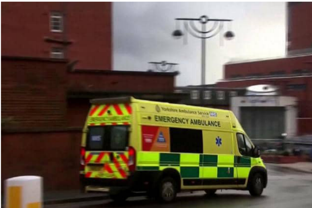
بريطانيا تطلق هيئة جديدة لمراقبة خورات فيروس كورونا

وسجلت المملكة المتحدة امس الاول السبت أكبر عدد من الإصابات الجديدة بفيروس كورونا منذ أوائل فبراير، حيث دسنت هيئة الخدمات الصحية الوطنية مبادرة جديدة لزيادة معدلات التطعيم، وأظهرت الإحصاءات الحكومية إصابة 18270 شخصاً بالفيروس في جميع أنحاء بريطانيا، وهو أعلى معدل يومي للإصابات منذ 5 فبراير.