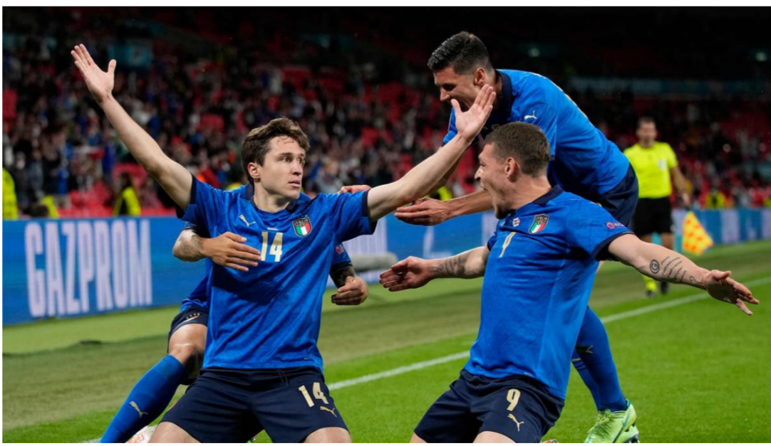
فرحة لاعبي إيطاليا بالتأهل إلى ربع النهائي

سجله المنتخب في 2019 بـ 11 فوز تحت قيادة روبرتو مانشيني أيضا. فيما أوضحت شبكة «سكواكا» أن إيطاليا حققت رقم تاريخي أيضا بأطول سلسلة لا هزيمة في تاريخ