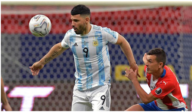
الأرجنتيني توفز على باراجواي

وتخوض نخبة من أفضل سائقي السباقات في العالم، تتضمن لويس