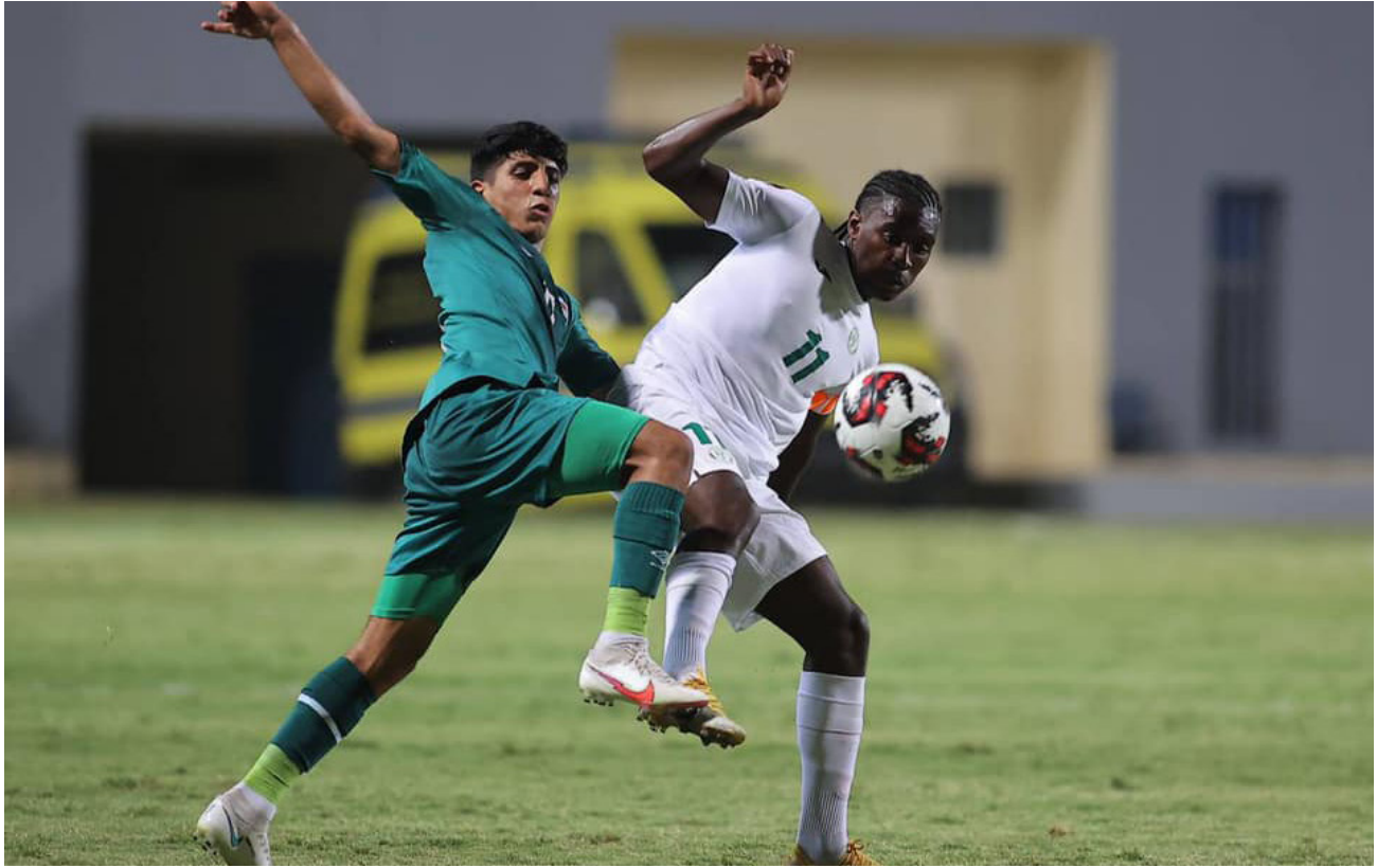
المنتخب الشبابي يخسر أولى مبارياته امام جزر القمر