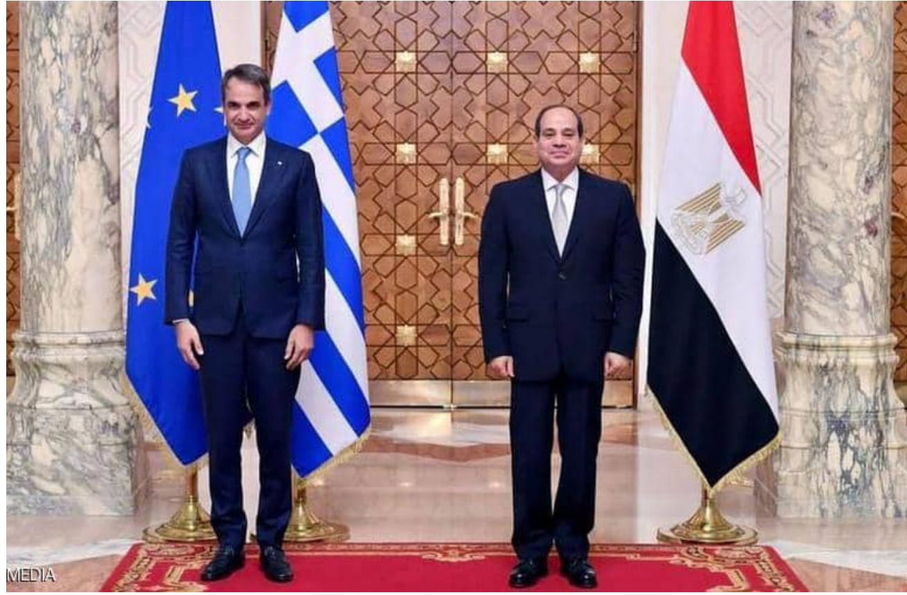
الرئيس المصري خلال استقبله رئيس وزراء اليونان

وأضافت "أغلب الظن في أسباب ذلك هو الاعتراض الواسع الذي رأيته داخل تركيا تجاه الأحكام القضائية الصادرة بحق قيادات جماعة الإخوان في قضية اعتصام رابعة، بما يتناقض مع مبدأ الرئاسية الذي تصر عليه مصر في تأسيس علاقتها الجديدة مع تركيا. وهو مبدأ عدم التدخل في الشؤون الداخلية لمصر". وتختم قولها بأن كل هذه المؤشرات تخبرنا بشيء واحد بكل وضوح: "مع الأسف المحادثات المصرية التركية تنفد الآن على حافة الفشل".