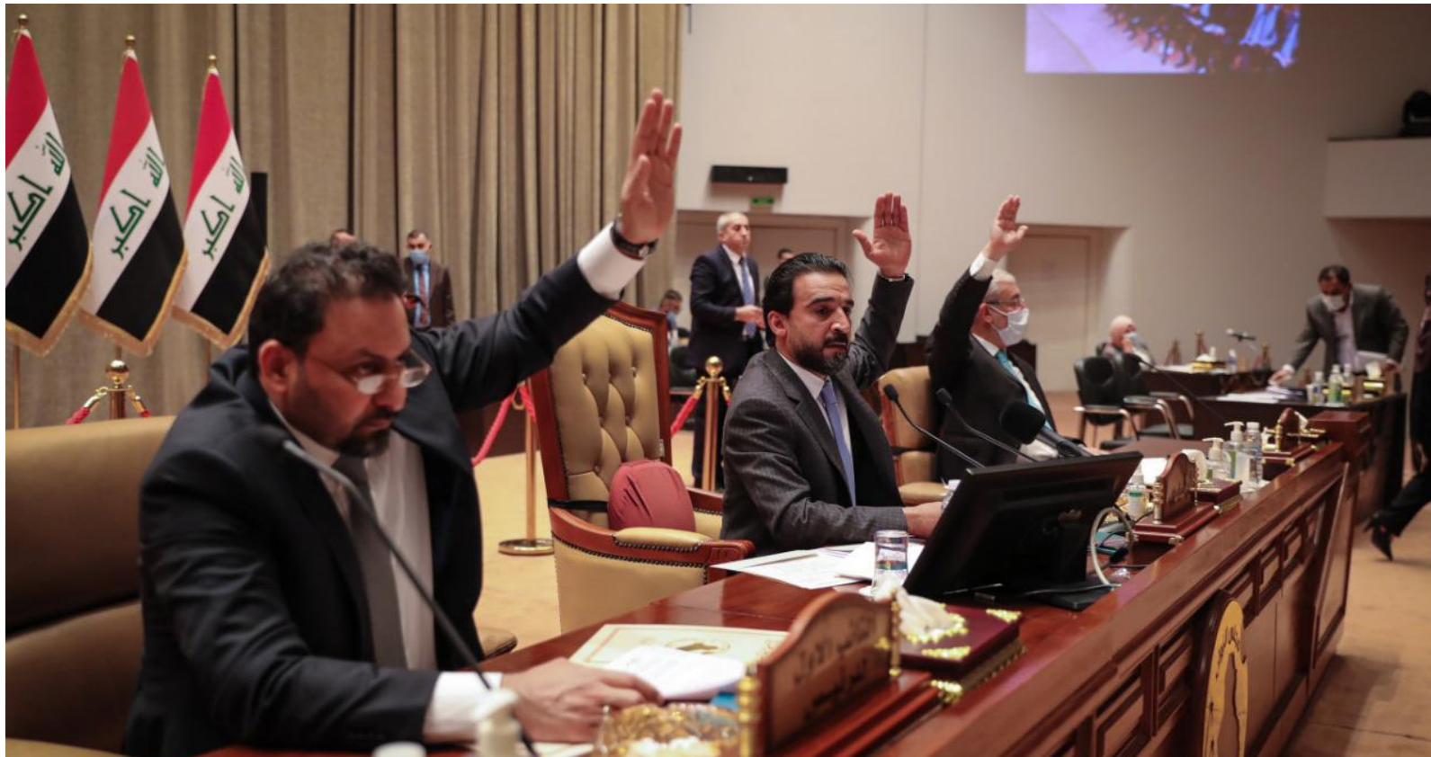
رئاسة البرلمان "رشيد"