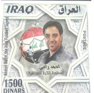
مدبر عام الشركة العامة للبريد والتوفير على ان يكون اصدار