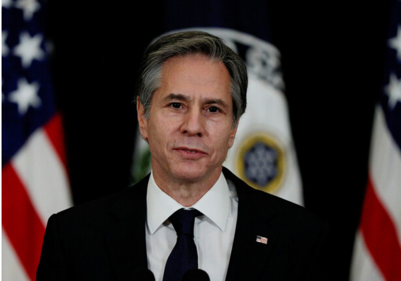
وزير الخارجية الأميركي أنتوني بلينكن