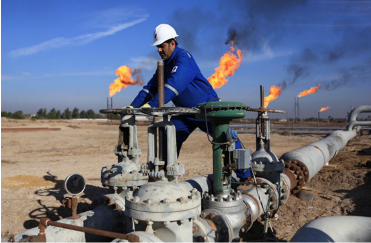
حقول النفط العراقية

ووفقاً للإدارة فإن كمية الاستيرادات الأمريكية من النفط الخام من نيجيريا بلغت 169 ألف برميل يومياً. تليها كولومبيا التي بلغت الاستيرادات منها 143 ألف برميل يومياً. تليها الأكوادور التي بلغت الاستيرادات منها 96 ألف برميل يومياً. وانخفضت أسعار النفط للجلسة الثانية على التوالي، مع صعود الدولار بفضل احتمال زيادة أسعار الفائدة في الولايات المتحدة.