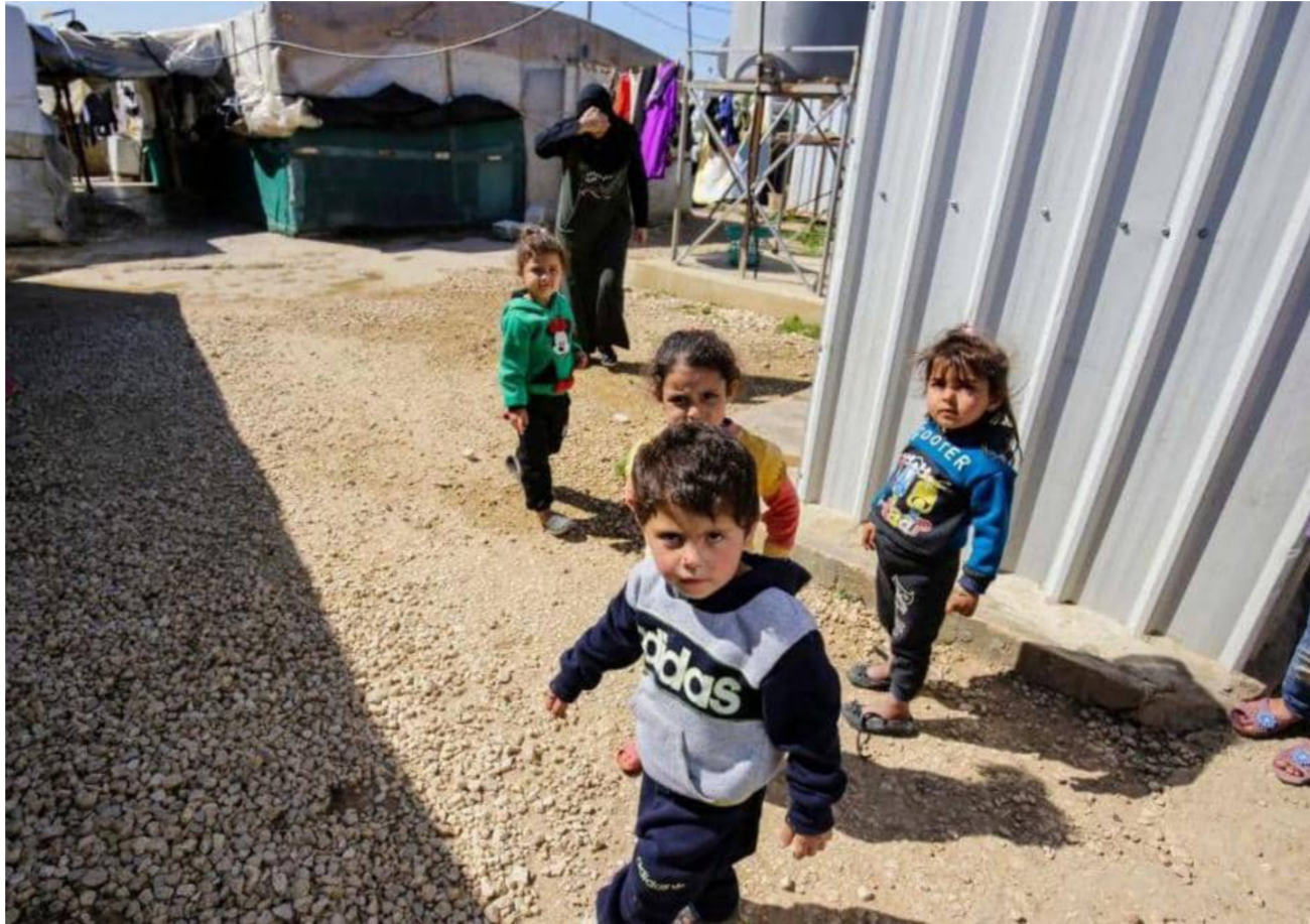
لاجئون سوريون يعانون الامرين