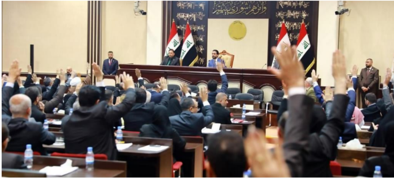
مجلس النواب "ارشيف"

وكان رئيس حكومة إقليم كردستان مسرور بارزاني قد أعلن عن اتفاق مع رئيس الحكومة الاتحادية مصطفى الكاظمي، قضى بموجبه إرسال حصة الإقليم من قانون الموازنة عن الأشهر الماضية بأثر رجعي منذ بداية العام الحالي، وهو ما ولد امتعاضاً سياسياً لاسيما من اللجنة المالية النيابية التي سارعت لإصدار بيان رسمي أكدت رفضها لهذا الإجراء وعدته مخالفاً للقانون.