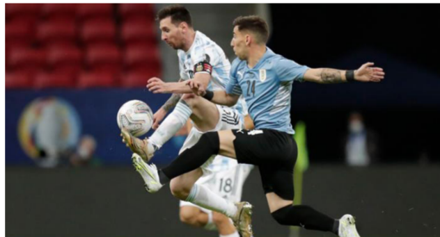
ميسي يحاول اجتياز لاعب أوروغواي

فازت 10-صفر على بوليفيا، ولدى باراجواي ثلاث نقاط من مباراة واحدة. وعاد إينيسون كافاني إلى تشكيلة أوروغواي بعد غيابه عن آخر مباراتين للإيقاف وإجها الحكم مطالبة مهاجم مانشستر يونايتد بالحصول على ركلة جزاء في الدقيقة 26، وكانت ليلة مخيبة لأوروغواي التي فشلت في تسديد أي كرة على الرمي رغم استحواذها على الكرة، وشكل ميسي خطورة على أوروغواي لكنه تعرض لرقابة من العديد من اللاعبين في الثلث الهجومي، وحصل