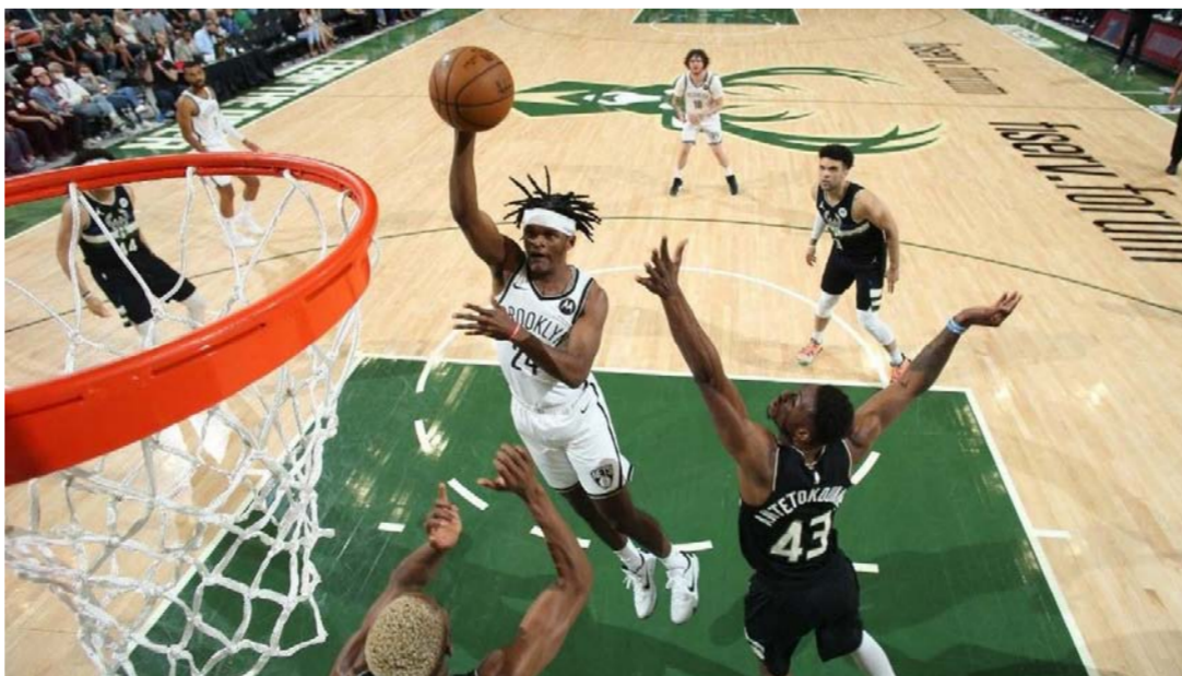
دوري المحترفين بالسلة

72-67 قبل 1,27 على نهاية هذا الربع حين نجح هاردن بترجمة رميتين حرتين من أصل ثلاث إثر خطأ عليه خلال تسديده من خارج القوس لكن ميدلنتون دخل على الخط بتسجيله النقاط الست