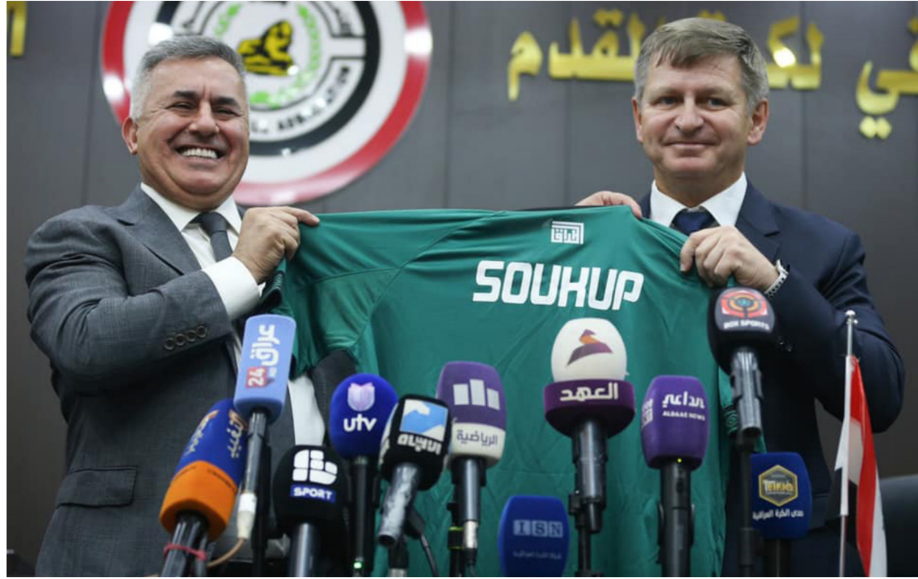
من أجواء المؤتمر الفني للمدرب التشيكي

قدمت الهيئة التطبيعية للاخاد المركزي لكرة القدم مدرب المنتخب الأولمبي الجديد (ميروسلاف سوكوب) إلى وسائل الإعلام. وذلك بعد الاتفاق الرسمي مع المدرب وملاكه التدريبي.. وقال رئيس الهيئة التطبيعية، إيهاب بنبان: «ان التعاون مع مدرب اجنبي جاء ضمن استراتيجية التطبيعية للاستعانة بملاك تدريبي اجنبي للمنتخب الأولمبي وذلك لإعداد منتخب يهدف لاعبي المنتخب الوطني». مؤكداً أن هناك مساعدين عراقيين سيتواجدان مع المدرب ميروسلاف سوكوب. وتابع بنبان: «عقد المدرب سيكون لعام واحد قابل للتجديد. وأن المدرب سيتواجد في العاصمة بغداد لتابعة الأندية واللاعبين. وقد بدأ بالأمر زيارة للنادية وسبواصل زيارته للنادية في الأيام المقبلة. من جانبه أكد التشيكي ميروسلاف سوكوب، مدرب منتخبنا الأولمبي لكرة القدم، انه يعرف كل شيء عن الكرة العراقية. مبينا ان هدفه هو تحقيق الانتصارات والأجازات مع المنتخب خلال الفترة المقبلة. وقال سوكوب في المؤتمر الصحفي أثناء تقديمه لوسائل الإعلام مدربا رسميا للمنتخب الأولمبي: «أنا سعيد جدا بتواجدي في العراق. أعرف كل شيء عن الكرة العراقية، وأمتلك معلومات كاملة عن اللاعبين المغتربين خارج العراق». وأضاف: «لن أستدعي أي لاعب مغترب، إذا لم تكن لديه الرغبة