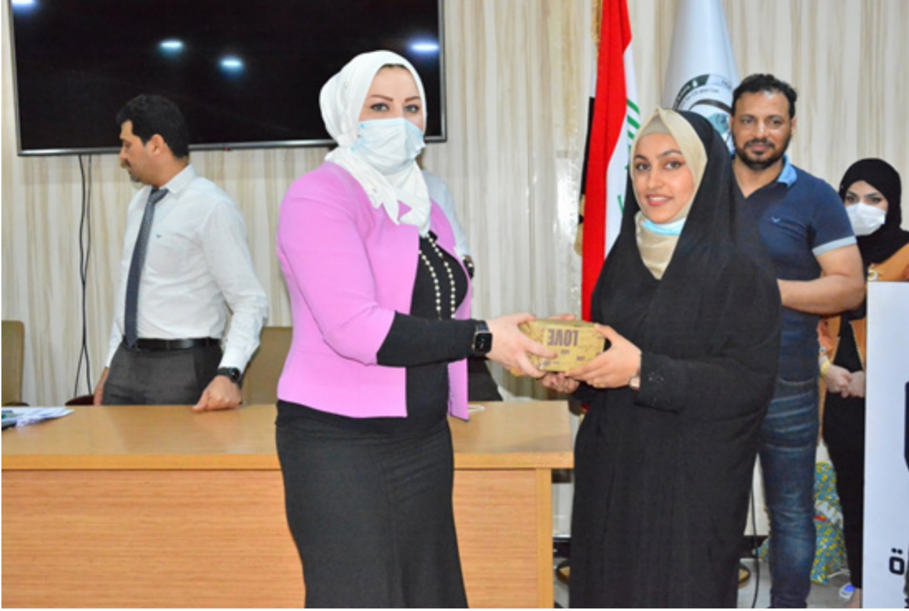
توزيع الهدايا التقديرية بين الطلبة الفائزين في المنظرات العلمية

وبين المحاضر التعريف بالبوليمر وأنواعه وكيفية التعامل معه في صناعة منتجات البلاستيك . كما بين طرق تدويره وعدد مرات التدوير لكل مادة موضحاً مفهوم التدوير الكيميائي والميكانيكي الأولي. وتطرق إلى خطورة استخدام في تخزين الطعام خاصة عند تعرضه إلى أشعة الشمس والتي بدورها تؤدي إلى تآكلية على مادة سامة تؤثر سلباً على صحة الإنسان كما أن للبلاستيك آثار سلبية على البيئة نظراً لتأثيراتها السلبية على البيئة والإنسان والحيوان.