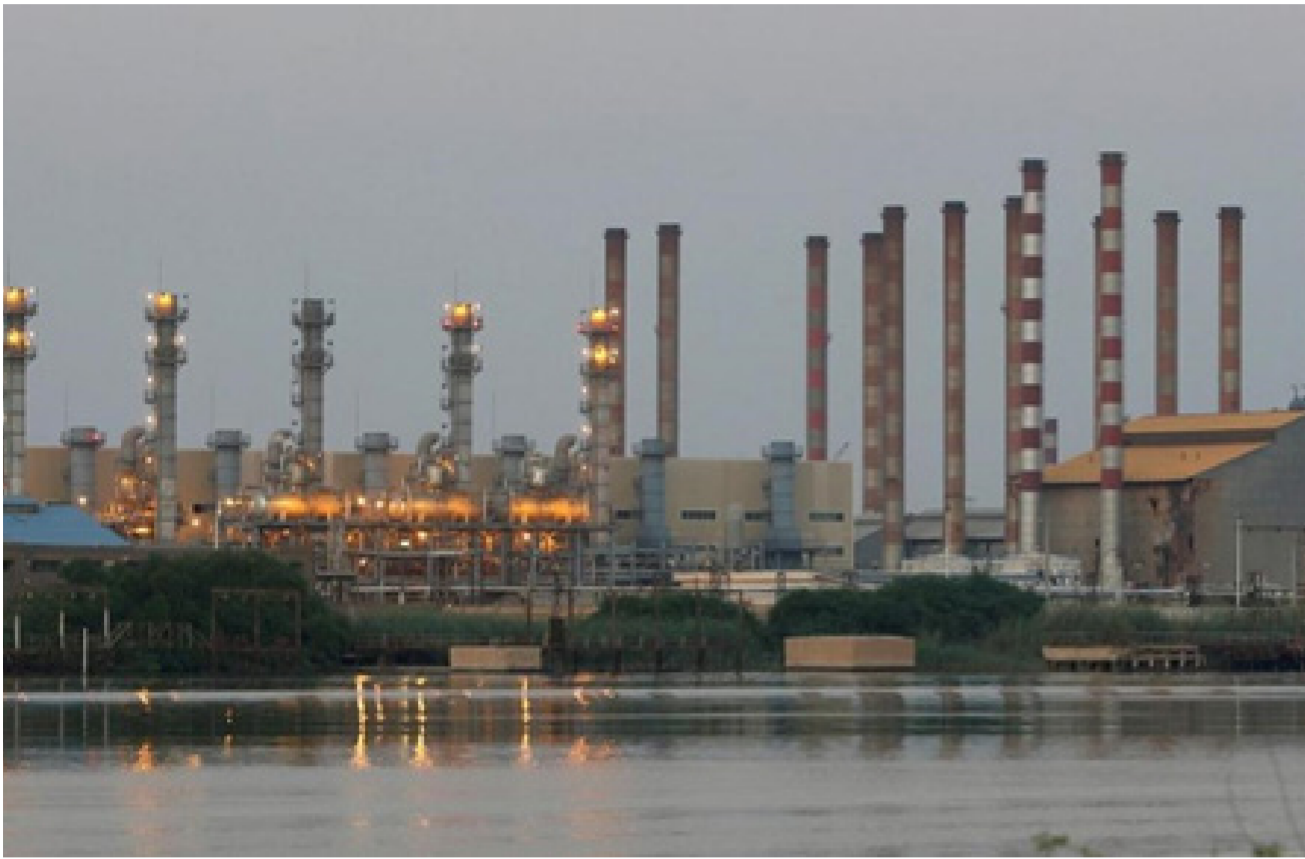
حقول نفط عراقية