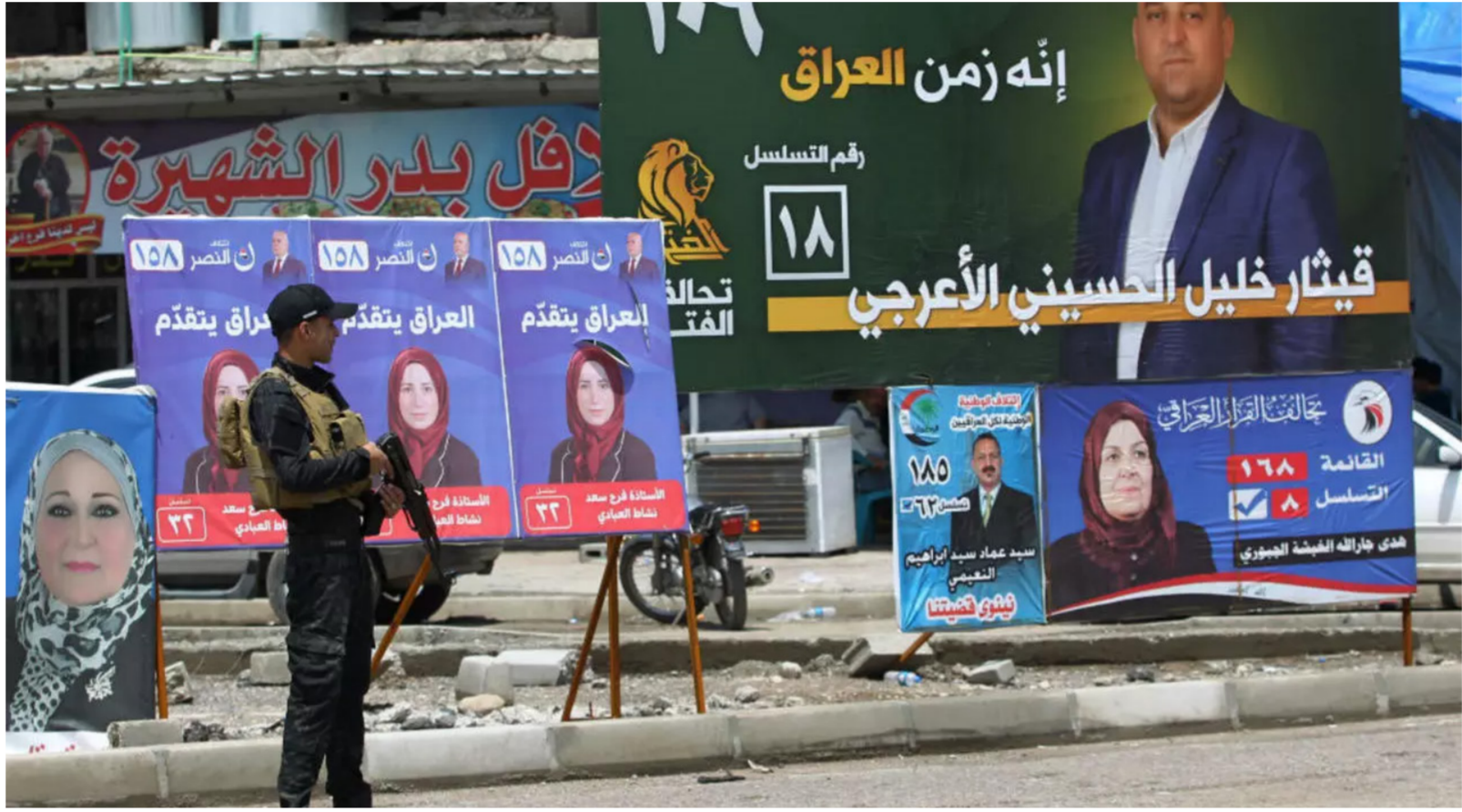
دعايات انتخابية سابقة "ارشييف"

سبق أن أنهى القراءة الأولى للقانون. وهو يستعد للقراءة الثانية ومن ثم التصويت". وتابع البجاري، الثانية عن ائتلاف دولة القانون، أن "الحكومة أرسلت ملاحظات حول المشروع ونحن نتمنى أن يتم تشريعه خلال الدورة