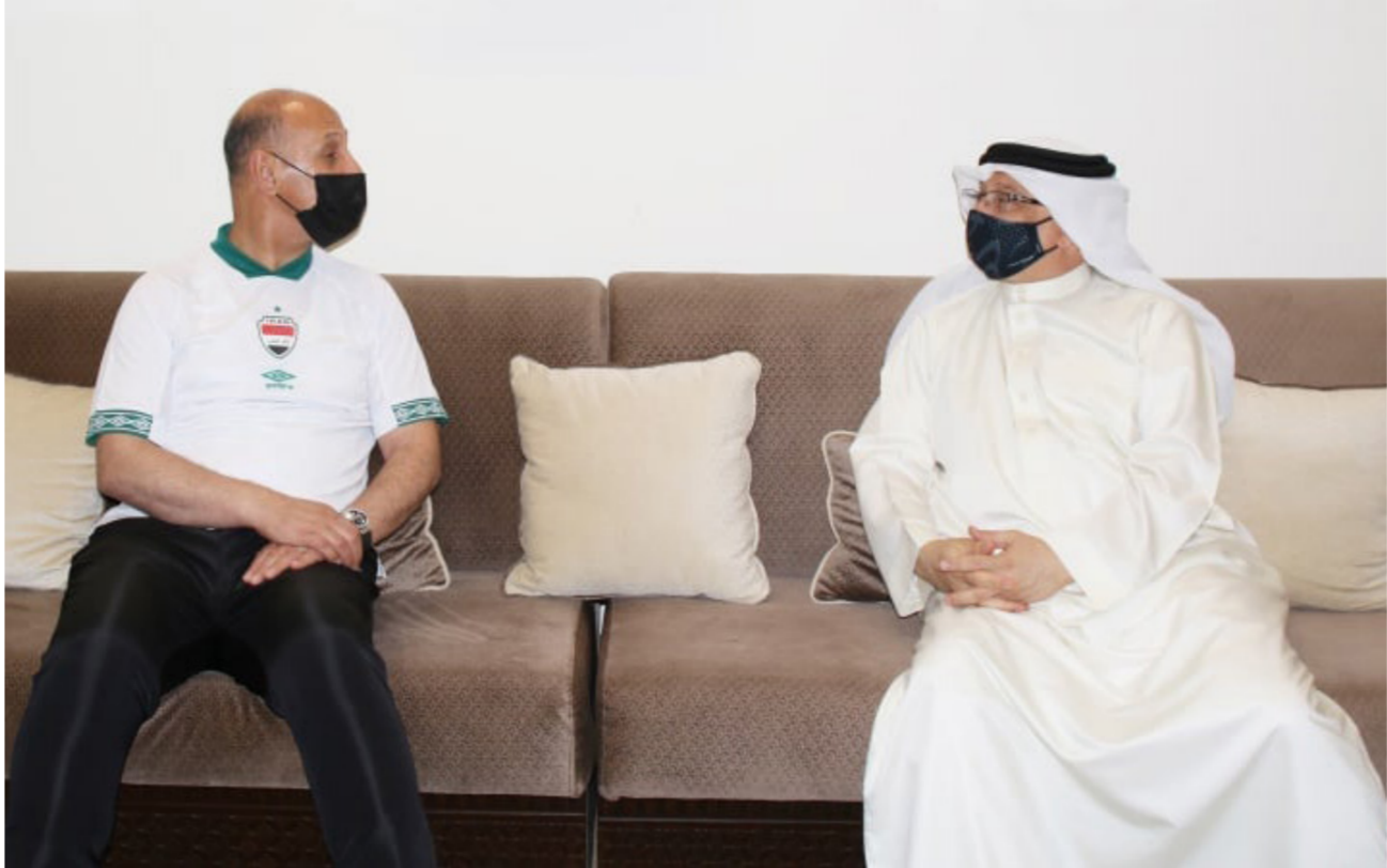
درجال يلتقي الرئيس التنفيذي للهيئة العامة للرياضة في البحرين

وجود تقاطعات مع الجهات الحكومية وبضمنها وزارة الشباب والرياضة». مستغنياً من «تصريحات حمودي التي ذكر فيها «وجود جهات حكومية تسعى لتقليص التخصصات المالية للجنة الأولمبية العراقية». وقال إن «حمودي يبدو أنه تناسى أصل الدعم المحدد ضمن مشروع قانون الموازنة المالية لسنة 2021 الذي قدمته الحكومة إلى المجلس النواب للمصادقة عليه».