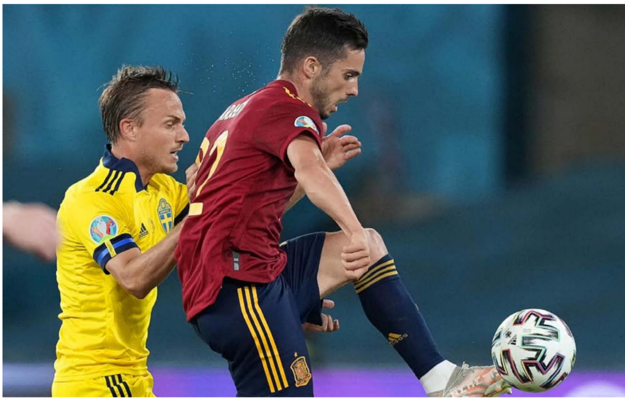
صراع على الكرة بين مهاجم منتخب إسبانيا بابلو سارابيا ومدافع منتخب السويد بيير بينغتون

المباريات التالية، واختمت بالحديث عن إشراك جيرارد مورينو كبدل: «كل اللاعبين الذين شاركوا كبدلاء ساهموا بشيء ما، وسعيد جداً بالتغيرات». وفي مباراة أخرى استهل المنتخب السلوفاكي مشاركته في البطولة بفوز صعب على نظيره البولندي 2-1 في الجولة الأولى من منافسات المجموعة الخامسة، في سنان بطرسبورغ، دفعت بولندا ثمن خطاين، الأول للحارس ستيفزي الذي أهدى سلوفاكيا التقدم في الشوط الأول بعدما حول الكرة في شبابه عن طريق الخطأ (18)، والثاني لغريغوريش كريكوفسك الذي ارتكب خطأ أدى إلى طرده بالإنداز الثاني (62)، ما سمح لماريك هاميتيك ورفاقه في التقدم مجدداً عبر ميلان شكرينيار (69) بعدما أدرك كارول لينيتسي التعادل في الشوط الثاني من الشوط الثاني (46)، ومن المؤكد أن هذه الهزيمة ستزيد الضغط على المدرب الجديد لبولندا النجم البرتغالي السابق باولو سوزا الذي حقق فوزاً يتيماً كان على أندورا المتواضعة 3-صفر في تصفيات مونديال 2022، من أصل ست مباريات خاضها منذ تعيينه في كانون الثاني خلفاً للمغال يريزي برزنتشيك، وبات المنتخب البولندي، الحائز على المركز الثالث في مونديال 1974 و1982 بقيادة غريغوريش لاثو، ورئيس الاتحاد المحلي للعبة حاليا، زيبغنيف بونيبسك على التوالي، مطالباً بالفوز في مباراته التالية التي جعده بإسبانيا في إسبيلية السبت.