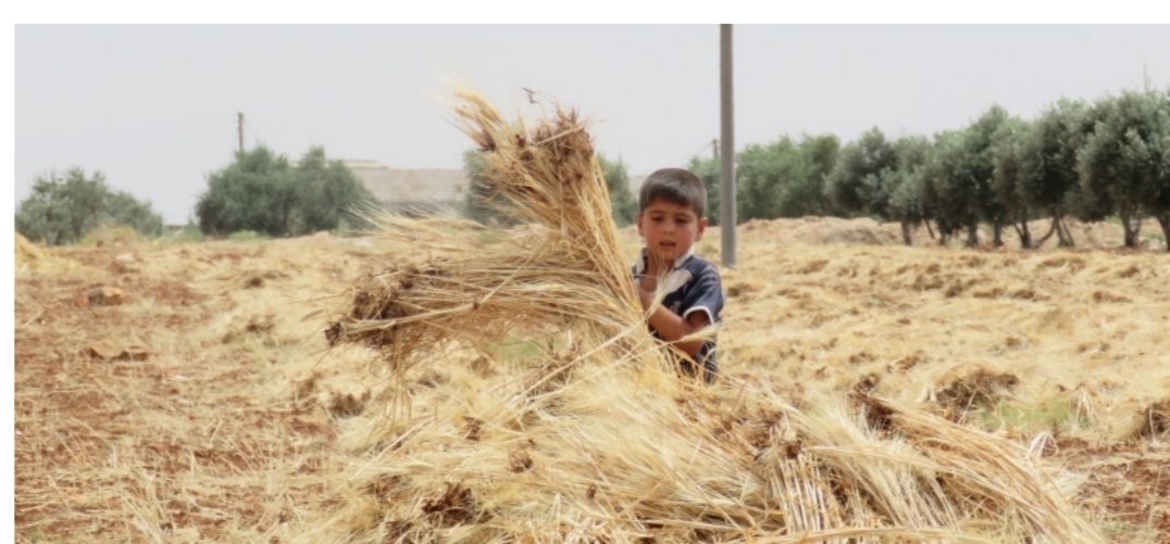
إستلام البذور في نينوى حيث بحث الطلاب العالي على المحاصيل الفلاحين للأعوام السابقة برفقة