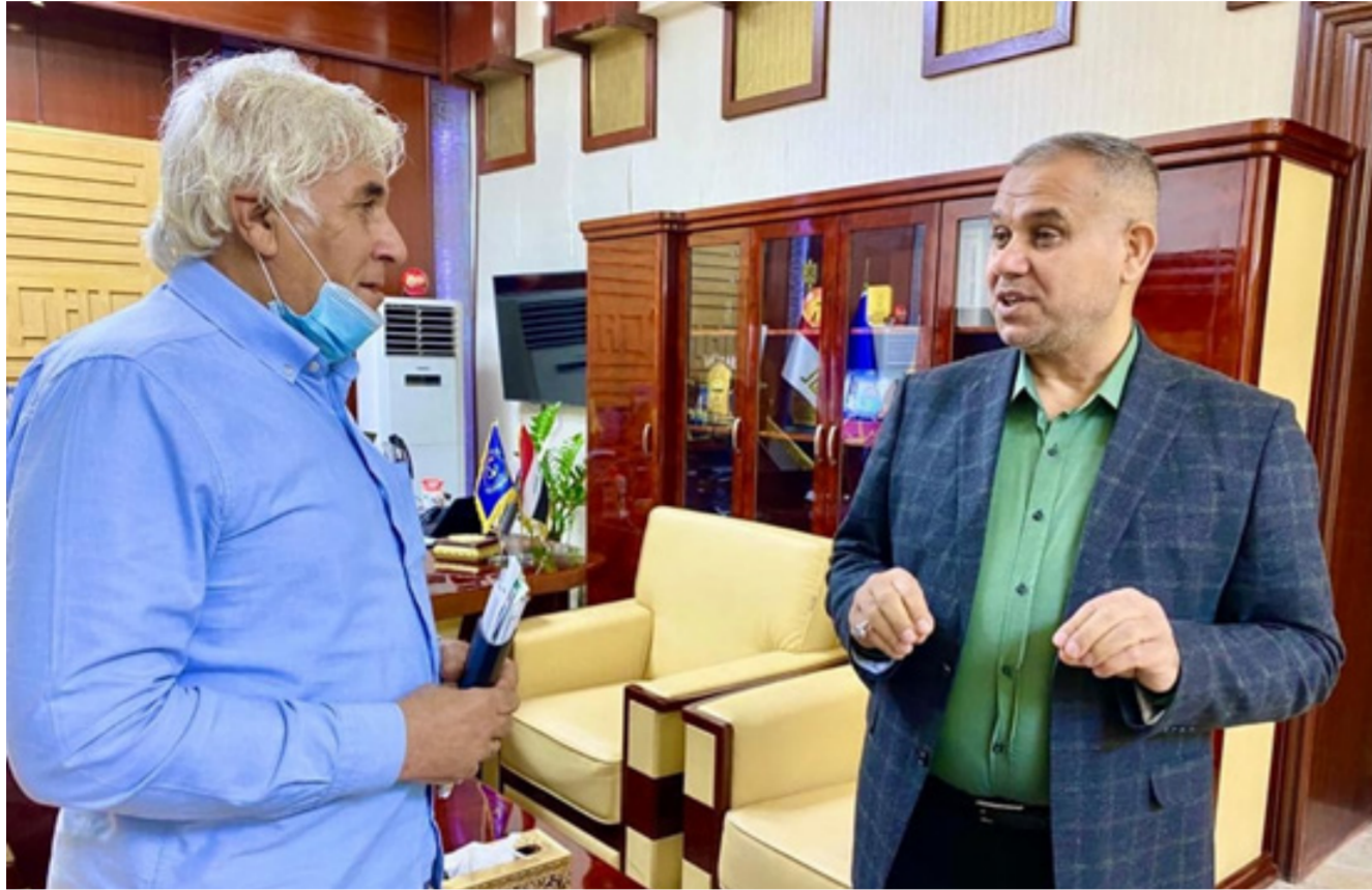
مدير عام موانئ العراق يتحدث لمراسلنا في البصرة

وبضرورة الاهتمام البالغ بعمل هذا القسم المهم والحيو الذي تقع على عاتقه مهمة كبيرة وهي صيانة وإدامة القطع البحرية التابعة للشركة. وأنبتنا على جهود العاملين فيه بعد اكتمالهم صيانة وإصلاح الحوض اجنادين والذي سيدخل الخدمة قريباً. واكدنا على متابعة كافة المشاكل الفنية والإدارية التي تواجههم مع الأقسام ذات العلاقة وإيجاد حلول سريعة.