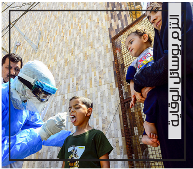
الزخم بوسائل الوقاية