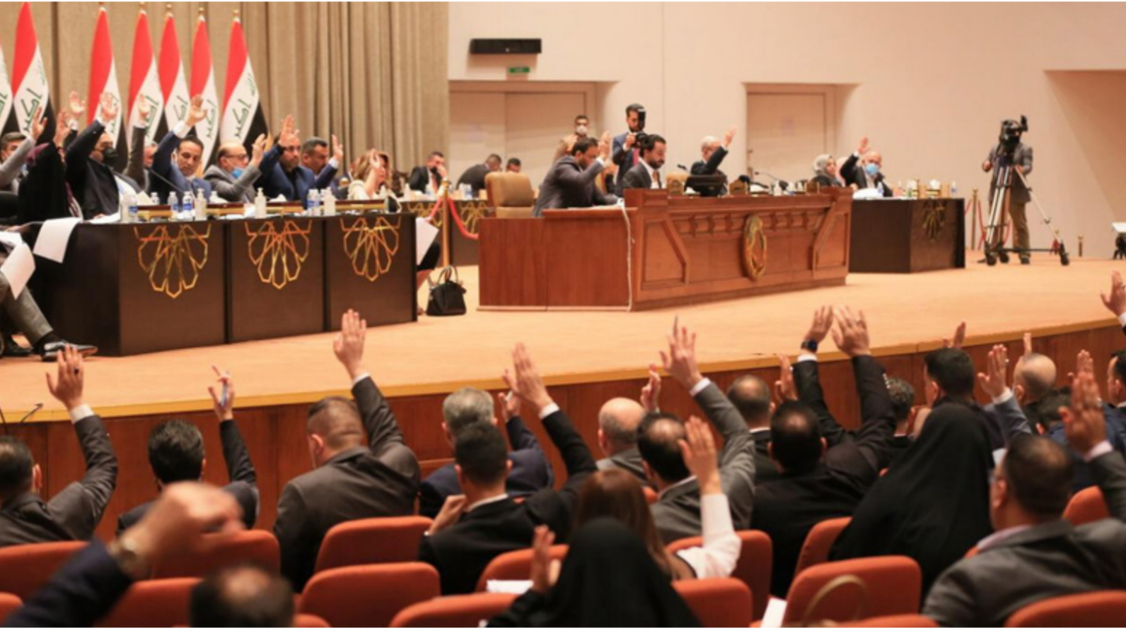
مجلس النواب "ارشييف"