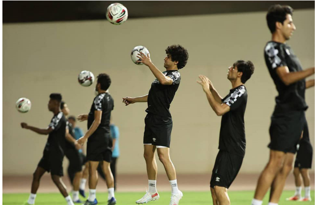
الوطني يكمل تحضيراته لمباراة طاجيكستان الودية اليوم

من جانبه، التقى وزير الشباب والرياضة عدنان درجال، إدارة نادي الاستقبال، وأضاف أن المنتخب الطاجيكي بحاجة ماسة إلى مثل هكذا مباريات ودية حيث تنتظرنا مباراة مهمة أمام المنتخب الياباني في التصفيات الآسيوية، والمنتخب العراقي فريق متميز وبالتالي ستكون مباراة مفيدة تساهم في رفع المستوى الفني لفرقنا إلى