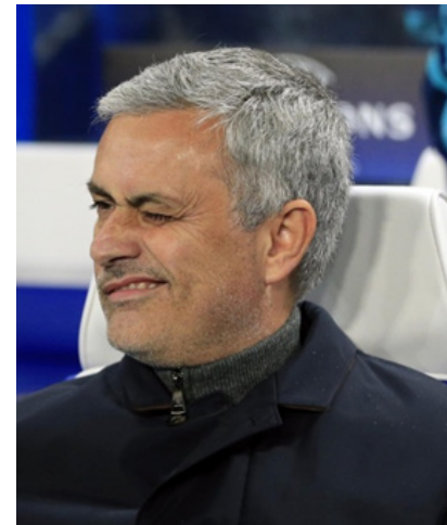
وفي مباراة خيرية بين نجوم العالم الذي كان يديره البرتغالي جوزيه مورينيو -صاحب المواقف الغريبة والفريدة- نزل الأخير أرض الملعب فجأة ليقطع الكرة من أمام أحد لاعبي الفريق المنافس بعد عرقلة. مارتن باليرمو المدرب السابق لأرسنال ساراندي الأرجنتيني وفي مباراة فريقه

لم يخطف مدرب مانشستر يونايتد الإنجليزي لويس فان خال الاضواء بانتفاضة فريضة مؤخرا أو ببقائه منصبه برغم المطالبات الكثيرة بإقالته. بل بموقف طريف لا يتكرر كثيرا بالملاعب.