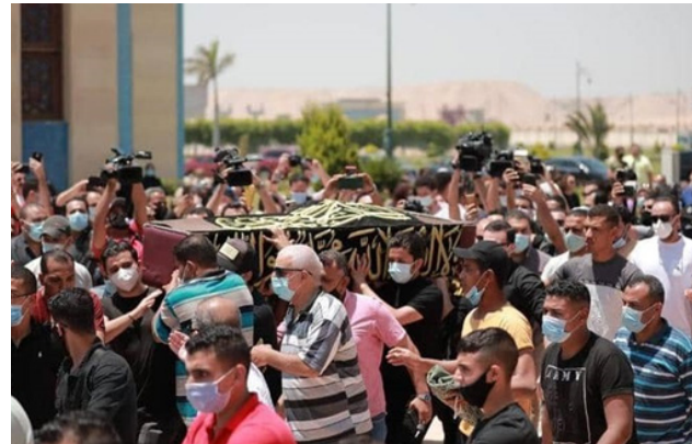
ليلية، يبالغ الحزن والأسى وفاة صديقها الراحل سمير غانم. في ذاكرة السينما والدراما قائلا: «سيظل في قلوبنا دائما المصرية والعربية دائما». حيث