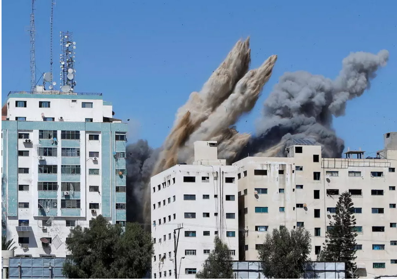
القصف الاسرائيلي على غزة