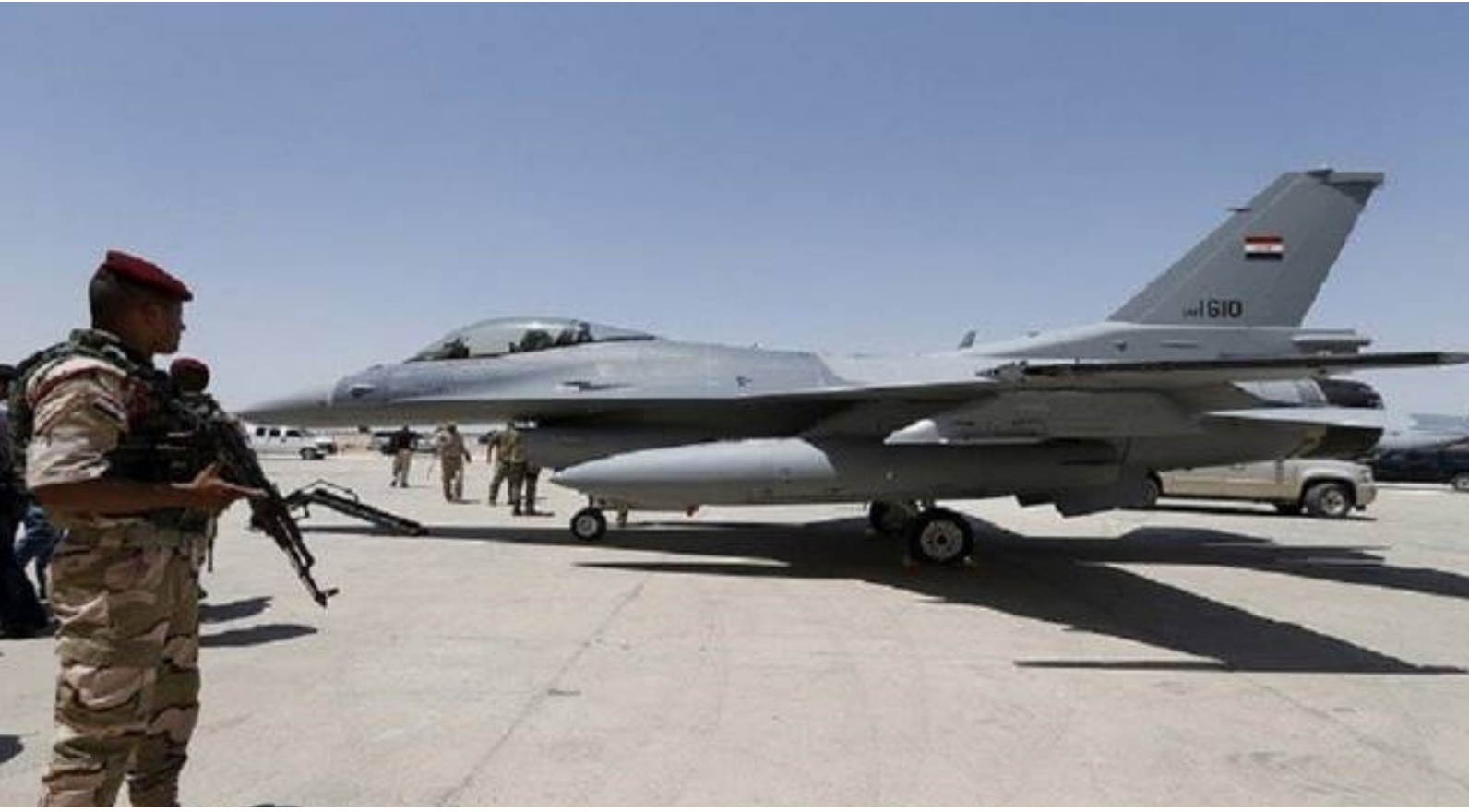
طائرات ال F16

من الطائرات الحربية من أنواع مختلفة. وتابع إن تنوع مصادر السلاح أمر إيجابي. لكنه لا يخطط لدى العراق حول تغيير مسار التسليح الجوي. مشيراً إلى أن الموازنات لم توفر الاعتمادات المالية الكافية.