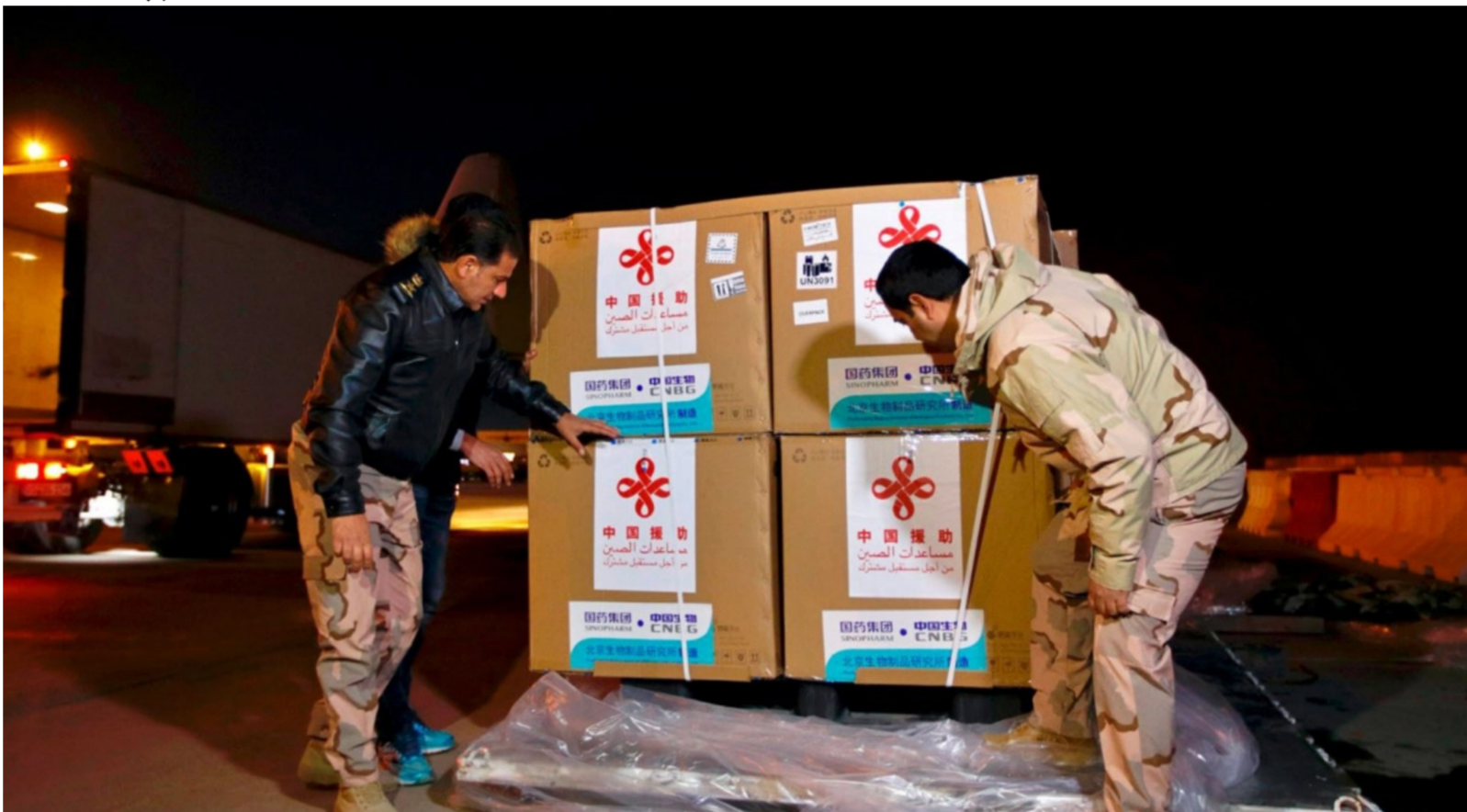
شحنات لقاح كورونا "أرشيف"

الصباح الجديد - وكالات: ارتفعت أسعار الخام امس الاثنين، بعد هجوم إلكتروني كبير تسبب في إغلاق خطوط أنابيب هامة لإمدادات الوقود في الولايات المتحدة. وبحلول الساعة 06:45 بتوقيت غرينتش، ارتفع خام برنت 57 سنتا بما يعادل 0.8% إلى 68.85 دولارا للبرميل. وذلك بعد أن ارتفع 1.5% الأسبوع الماضي. وزادت العقود الآجلة لخام غرب تكساس الوسيط الأمريكي