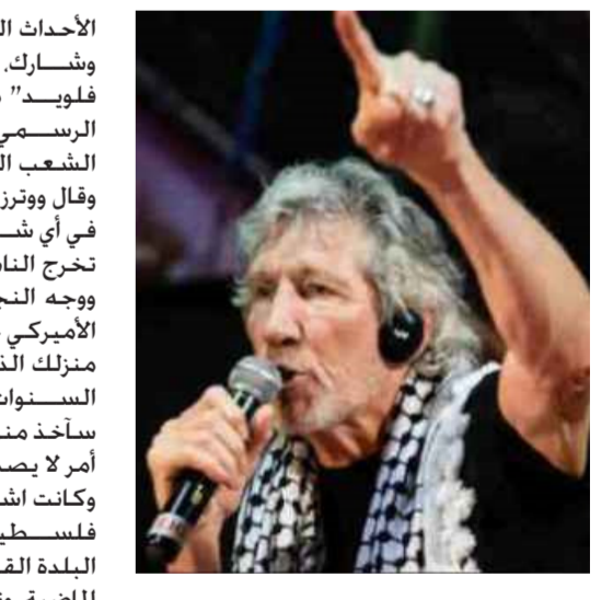
الصباح الجديد - وكالات: أعلن الغني البريطاني الشهير، روجر ووترز دعمه بشكل صريح وعلني للفلسطينيين بعد

الأحداث التي شهدتها مدينة القدس، وشارك ووترز أحد أعضاء فرقة "بينك فلويد" مقطع فيديو على حسابة الرسمي في "تويتتر" أكد فيه تضامنه مع الشعب الفلسطيني. وقال ووترز في تغريدته: "بايدن يدعم إسرائيل في أي شيء... ويستمر بدعمها حتى عندما تخرج الناس من منازلهم". ووجه النجم البريطاني سؤالاً إلى الرئيس الأميركي جو بايدن، وقال: "ماذا لو كنت في منزل الذي تعيش فيه عائلتك منذ مئات السنوات، وجاء أحرق من بعيد وقال لك أنا سأحرق منزلك؟ لا يهمني ماذا تفعل، متا! إنه أمر لا يصدق". وكانت اشتباكات اندلعت بين متظاهرين فلسطينيين والشرطة الإسرائيلية خارج البلدة القديمة في القدس. خلال الأيام القليلة الماضية، وتصادت أمس السبت، حيث صلى عشرات الآلاف من المسلمين في المسجد الأقصى صلاة القيام في ليلة رما كانت ليلة القدر.