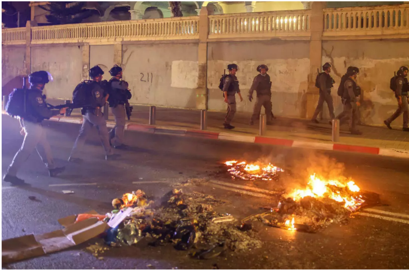
مواجهات عنيفة في حي الشيخ جراح في القدس