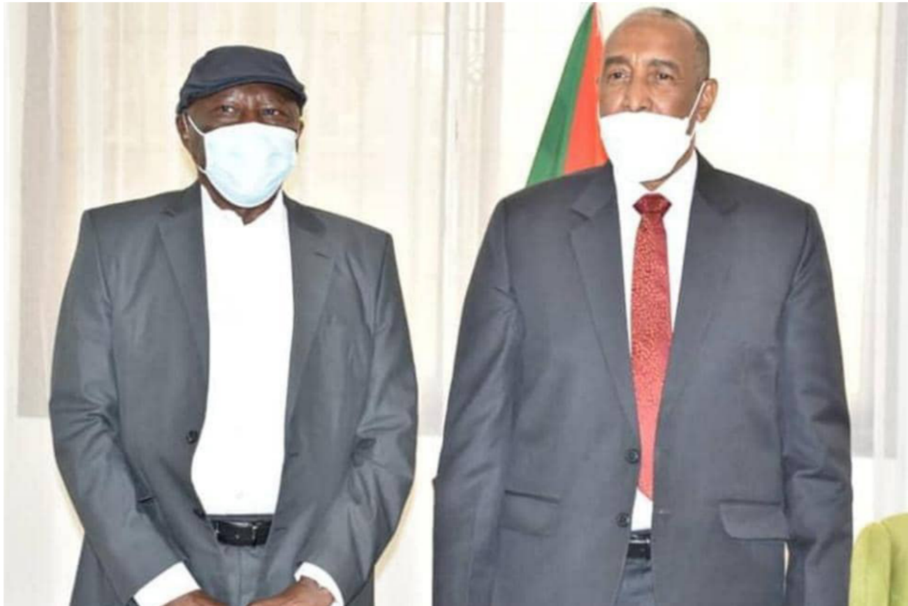
عبد الفتاح البرهان وعبد العزيز الحلو