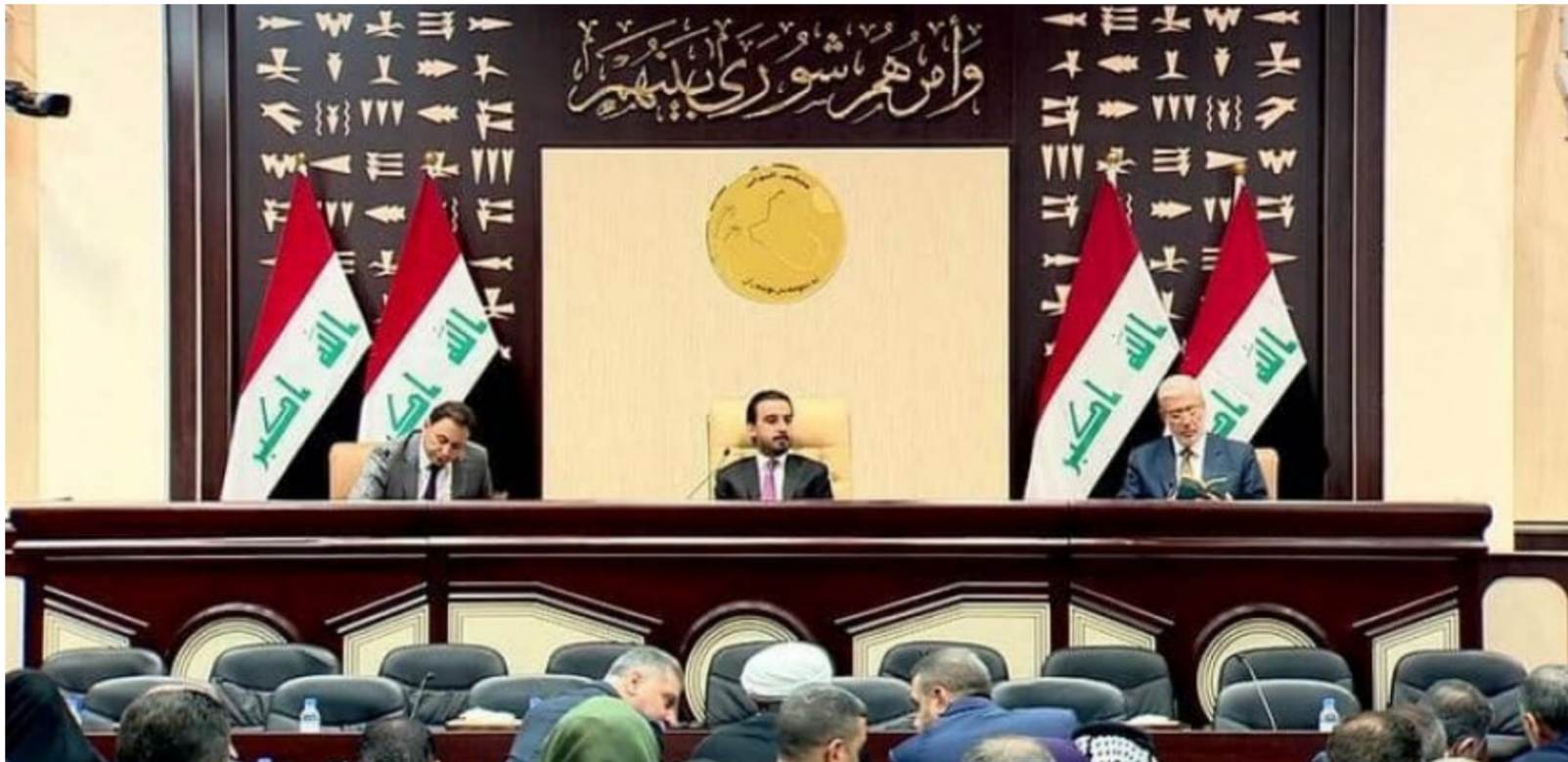
جلسة سابقة لمجلس النواب العراقي