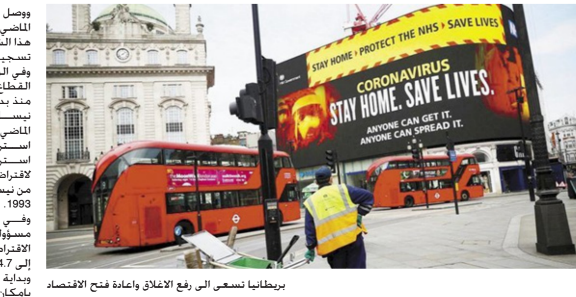
بريطانيا تسعى الى رفع الإغلاق وإعادة فتح الاقتصاد

وواصل صافي الاقتراض خلال الشهر الماضي إلى أعلى مستوى له في مثل هذا الشهر من أي عام. وذلك منذ بدء تسجيل هذه البيانات عام 1993. وفي الوقت نفسه زاد صافي اقتراض منذ بداية العام المالي الحالي في نيسان الماضي حتى نهاية شباط الماضي بمقدار 228.2 مليار جنيه استرليني إلى 278.8 مليار جنيه استرليني وهو أعلى مستوى لاقتراض القطاع العام خلال الفترة من نيسان إلى شباط من أي عام منذ 1993. وفي الوقت نفسه. يتوقع مكتب مسؤولية اليانزية البريطانية وصول الاقتراض العام حتى نهاية آذار الجاري إلى 354.7 مليار جنيه استرليني. وبتدلية من أيلول المقبل. سيكون بإمكان من تجاوزوا 70ل في بريطانيا