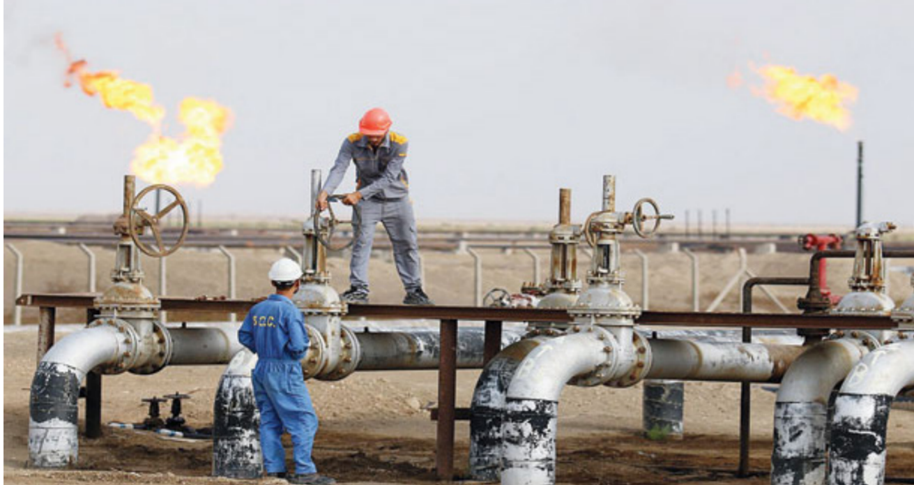
اتابيب نقل الغاز في العراق

الى الهند 2.11 مليون طن او ما يعادل 14 مليون و 110 آلاف برميل وتأتي ثلثا السعودية بمقدار 1.61 مليون طن متري او ما يعادل 11 مليون و 270 ألف برميل . وتذهب صادرات النفط العراقي 80% منها إلى الصين والهند ودول شرق آسيا. فيما تذهب 20% من الصادرات المتبقية إلى دول أوروبا وأميركا ودول أخرى.