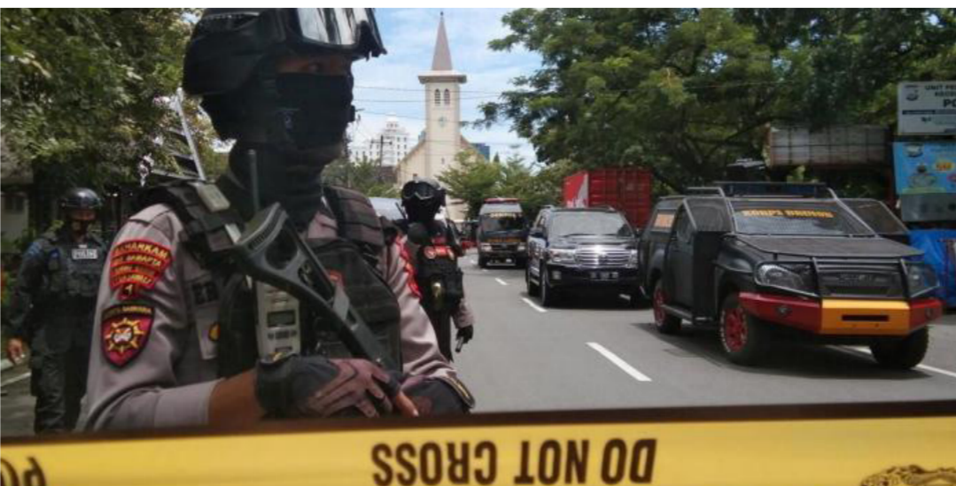
العسكر يسيطر على شوارع بورما

ضد أشخاص عزل من قبل القوات المسلحة البورمية وأجهزة الأمن" مضيافاً "جيشاً محترفاً يتبع المعايير الدولية في سلوكه ولديه مسؤولية حماية الشعب الذي يخدمه وليس إيداعه".