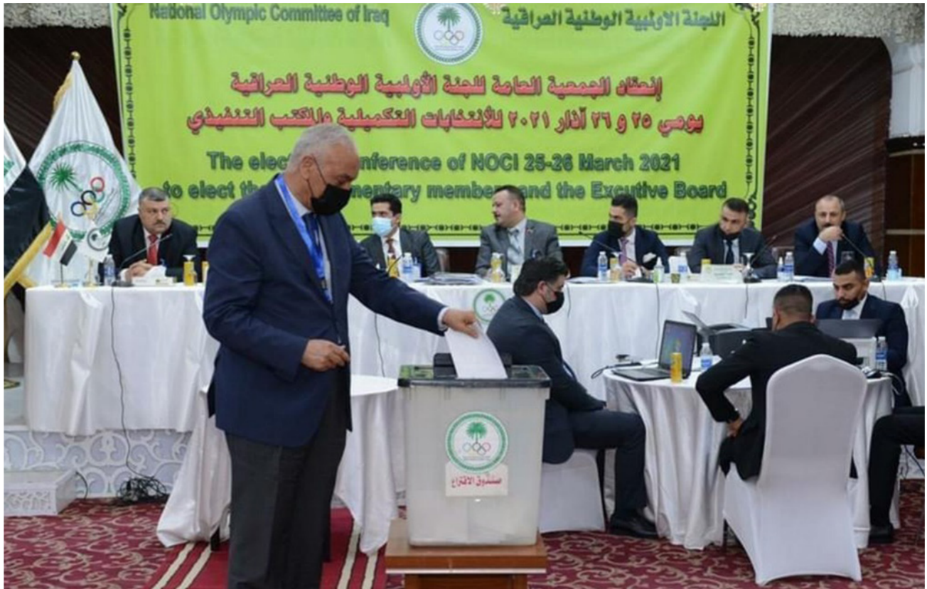
انتخابات الأولمبية جمد الثقة حمودي

واوضحت ان «لجنة الشباب والرياضة النيابية تؤكد دعم قطاع الرياضة والشباب في العراق لن تدخر اي جهد يسهم في مساندة عمل اللجنة