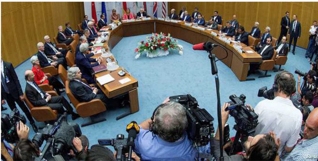
اجتماع اسرائيلي على تأييد الاتفاق النووي الإيراني

الطريق أمام القدرات العسكرية النووية الإيرانية لعقد من الزمان على الأقل". وبينما يواصل الجمهوريون مطالبتهم بتوسيع المفاوضات حول البرنامج النووي الإيراني لتشمل "نظام المراقبة الصارم" للاتفاق، هاليفي بشكل قاطع مثل هذا