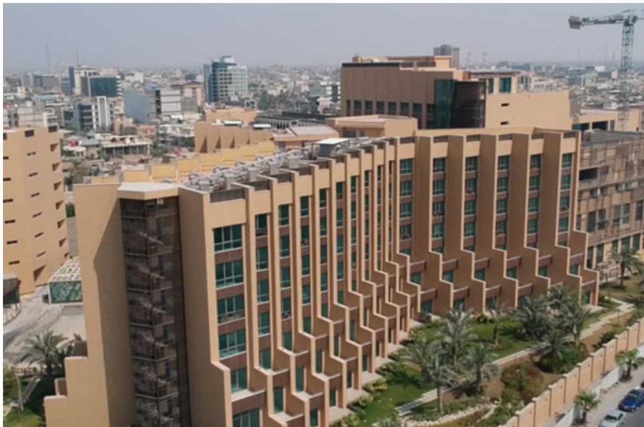
فندق (كراند ميلينيوم السيف) كأول فنادق كراند في العراق

عالية . ويضمن هذه المشاريع فندق (كراند ميلينيوم السيف) والذي تديره شركة ميلينيوم العالمية كأول كراند في العراق والثامن في الوطن العربي وأحد عشر عالميا وأن المشروع المصنف من فئة الخمس نجوم سيكون إضافة نوعيه للعاصمة الاقتصادية فيما يأخذ اسمه من إحدى المناطق التراثية وتصميمه من تصاميم التشانيل . وأن الفندق الذي يقام بكلفة تتجاوز 73 مليون دولار وعلى مساحة 18 الف متر مربع يعد منتجعا سياحيا متكاملًا كونه يحتوي على 400 غرفة فندقية وسويتات عالية المرافقات وسويتات رئاسية مع مطاعم و مسابح وقاعات إضافة الى منشآت رياضية وبنائية مكاتب مع محال تجارية لماركات عالمية. وان البصرة ستشهد افتتاح فندق مطار البصرة الدولي قريبا بعد تجاوز كلفته الاستثنائية 11 مليون دولار ليضيف أكثر من 100 غرفة فندقية مختلفة التصنيفات وان أهمية الفندق تكمن في جعل مطار البصرة مؤهلا لأن يكون مطار ترانزيت ( شأنه شأن باقي المطارات العالمية ).