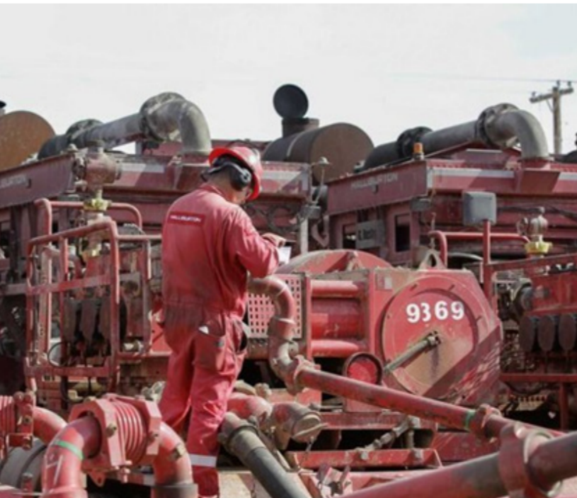
احدى محطات تصفية البترول في السعودية

من جانبه، قال ألكسندر بوجل المستشار في شركة "جي بي سي إنرجي" الدولية للطاقة إن تبدل مسار الأسعار في الأسبوع الماضي يؤكد صدق رؤية "أوبك" بأن ظروف السوق ما زالت هشة وأن زيادات الإنتاج يجب أن تتم بحذر شديد، مبينا أن السوق ستراقب عن كثب اجتماع "أوبك" الأسبوع المقبل