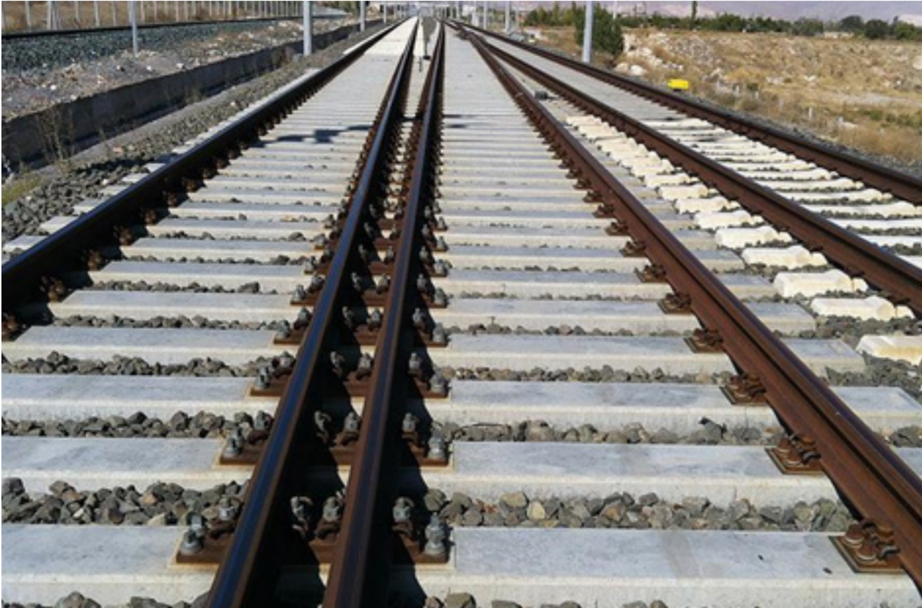
احدى خطوط السكك الحديدية في البصرة

وهدد وقتها النائبة في البرلمان العراقي عالية نصيف بـ"اللجوء إلى القضاء". واكتسب ميناء الفاو أهمية مضاعفة بعد دراسة أشارت إلى منافعه الاقتصادية الكبيرة، وأيضا بسبب الجدل المستمر بين العراق، والكويت التي أنشأت ميناء مبارك الكبير على الضفة المقابلة من خور عبد الله، حيث بنشئ العراق ميناءه. وأوقفت الكويت أعمال التشييد