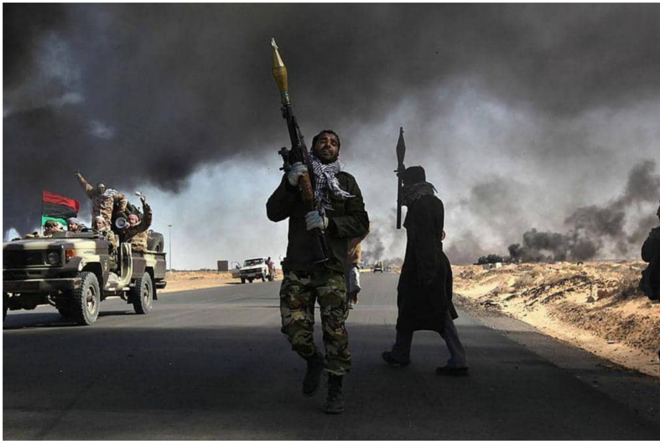
احدى الميليشيات في طرابلس