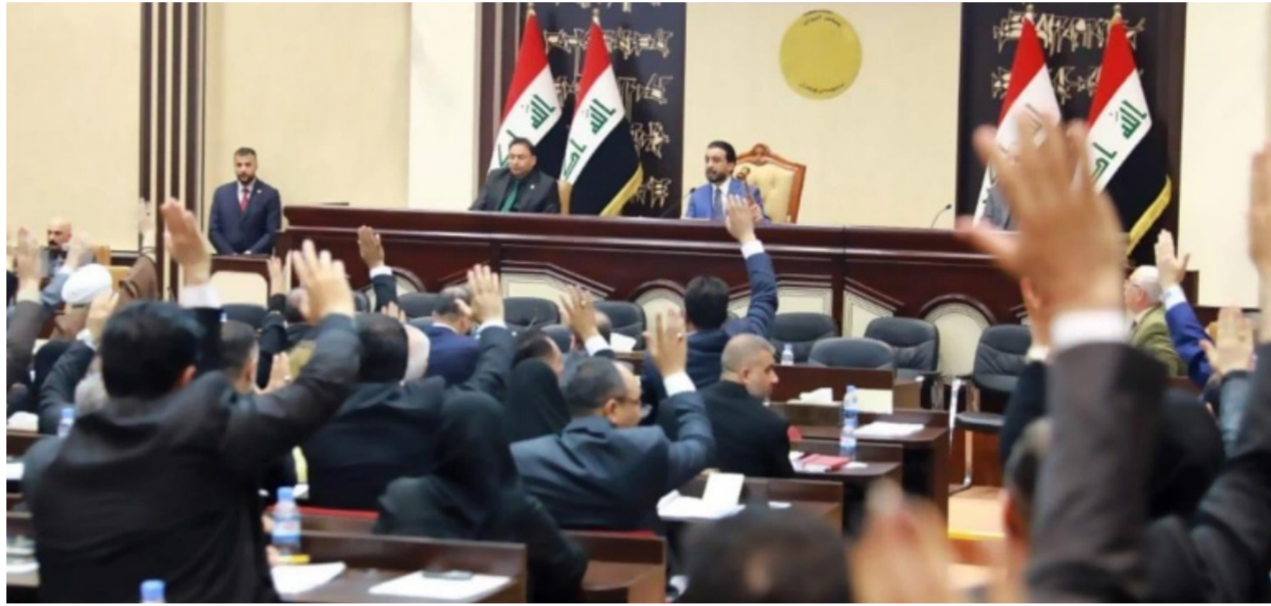
مجلس النواب "رشيف"