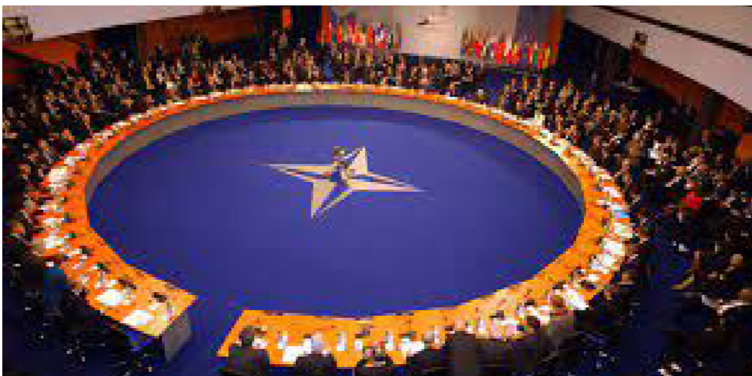
داخل مقر الحلف الأطلسي

وحلف الأطلسي موجود في أفغانستان منذ نحو 20 عاماً، لكنه قلص وجوده من 130 ألف جندي من