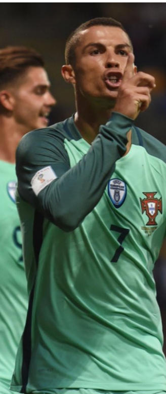
وولفرهامبتون. من قائمة منتخب البرتغال لتصفيات أوروبا المؤهلة للمونديال.