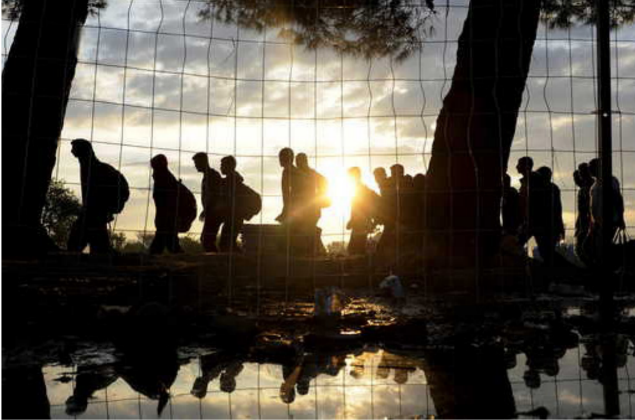
عذابات السوريين في بنان بلا نهاية

نشر في الساعات الأولى من صباح الثلاثاء، وفي 19 أكتوبر 2016، الخالصي، بياناً شددت فيها على أهمية أن تستجيب الحكومة اللبنانية "لتوصيات المجتمع الدولي وأن تبذل المزيد من الجهد للوفاء بحقوق الإنسان واحترامها وحمايتها. ووضع حد للإفلات من العقاب الذي يدعم التآكل الشديد للحقوق الاقتصادية والاجتماعية والمدنية الأساسية". ويقدر لبنان عدد اللاجئين السوريين القيمين على أراضيه بحوالي 1,5 مليون لاجئ. نحو مليون منهم مسجلون لدى مفوضية الأمم المتحدة لشؤون اللاجئين.