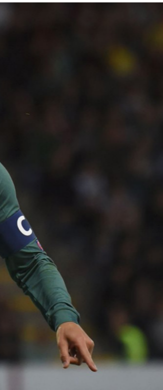
وولفرهامبتون. من قائمة منتخب البرتغال لتصفيات أوروبا المؤهلة للمونديال.

في تورينو ثم صربيا في 27 من نفس الشهر في ليجراد وأخيرا لوكسمبورج في 30 آذار الجاري على ملعبه. وفي عمر الـ36. لا يرغب رونالدو في تقويت فرصة توسيع أسطوره مع المنتخب الوطني. والذي شارك معه للمرة الأولى وهو في سن الـ18 و«خديدا» 20 أب من عام 2003 أمام منتخب كازاخستان. وسجل «صاروخ ماديرا» أول أهدافه مع البرتغال في 12 حزيران من عام 2004 في المباراة الافتتاحية بين منتخب بلاده واليونان في بطولة «يورو 2004». وهي المبارات التي تكررت لاحقا في نهائي البطولة والتي فاز بلقبها اليونانيون. وعلى مستوى الأندية. أحرز رونالدو أول أهدافه مع فريق سبورتنج لشبونة في 14 أب من عام 2002 قبل أن ينتقل فيما بعد للشبابين الحمر ومنذ ذلك الحين وعلى مدار 18 عاما متتاليا أصبح النجم البرتغالي مرجعية كبيرة للهدافين على مستوى كرة القدم العالمية.