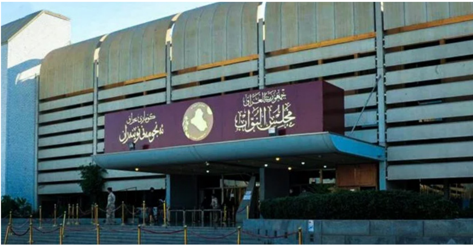
مبنى مجلس النواب "ارشيف"