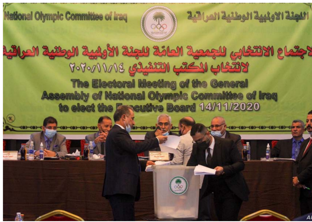
الاجتماع الانتخابي للجمعية العامة للجنة الأولمبية الوطنية العراقية لانتخاب المكتب التنفيذي 2020/11/14