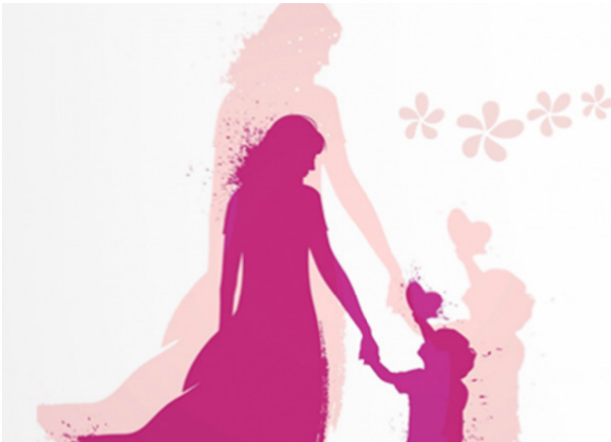
العربية في ٢١ مارس/آذار كل عام، وهو بداية فصل الربيع، وتختلف المغرب وتونس والجزائر يوم الأحد الأخير من مايو/أيار، في إثيوبيا: يوم الأم غير مرتبط بأي يوم من أيام السنة، بل يرتبط بانتهاء موسم المطر في البلاد وبداية شهر الخريف. أما في الأرجنتين: فيتم الاحتفال به في يوم الأحد من الأسبوع الثالث بشهر أكتوبر (تشرين الأول) الذي يُصادف عادة ١٨-١٥ من الشهر.

يختلف التاريخ الذي يحتفل به بيوم الأم أو عيد الأم حول العالم، ما تسبب بلغظ بشأن اليوم الحقيقي للاحتفال محليا يحتفل بهذا اليوم في ٢١ مارس اليوم نفسه الذي يحتفل به الأكراد بيوم نوروز، وهو أيضا عيد الربيع أو عيد الشجرة، إذ تكون الأشجار مزهرة وتنبث بها أوراق جديدة معلنة بداية فصل الانتعاش بالنسبة إليها. ويحرص العديد من الأشخاص على مزامنتها الاحتفال بعيد الربيع والأم مع مناسباتهم الخاصة كالزواج أو الخطبة في مصر وبحسب صحيفة «الوطن» أن الاحتفال بعيد الأم جاء بعد اقتراح من الصحفي المصري الراحل علي أمين مؤسس جريدة أخبار اليوم، بالاحتفال بهذا اليوم، وبعدما اقترح أمين على أخيه مصطفى أمين في مقاله اليومي فكرة الاحتفال بيوم الأم، وبالفعل كتبها في عمودهما الشهير يتحدثان فيه عن تخصيص يوم ليوم الأم والاحتفال بها، وقوبلت فكرتهم بالتشجيع وتقرر أن يكون الاحتفال بيوم الأم هو يوم ٢١ مارس. وما يزال الاحتفال به قائماً في السعودية مع معظم البلدان