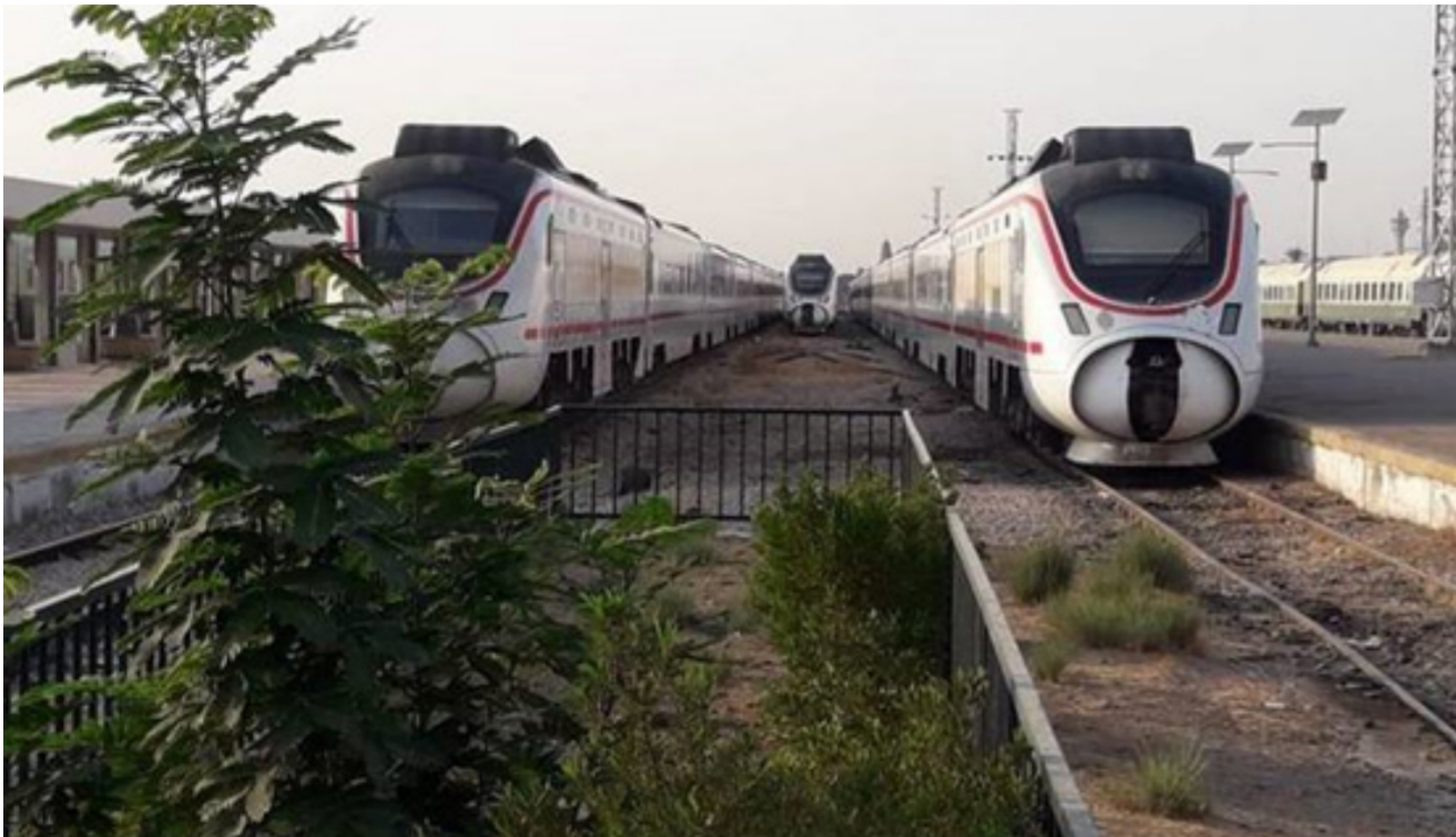
صورة لقطار المعلق المزمع تنفيذه في العراق