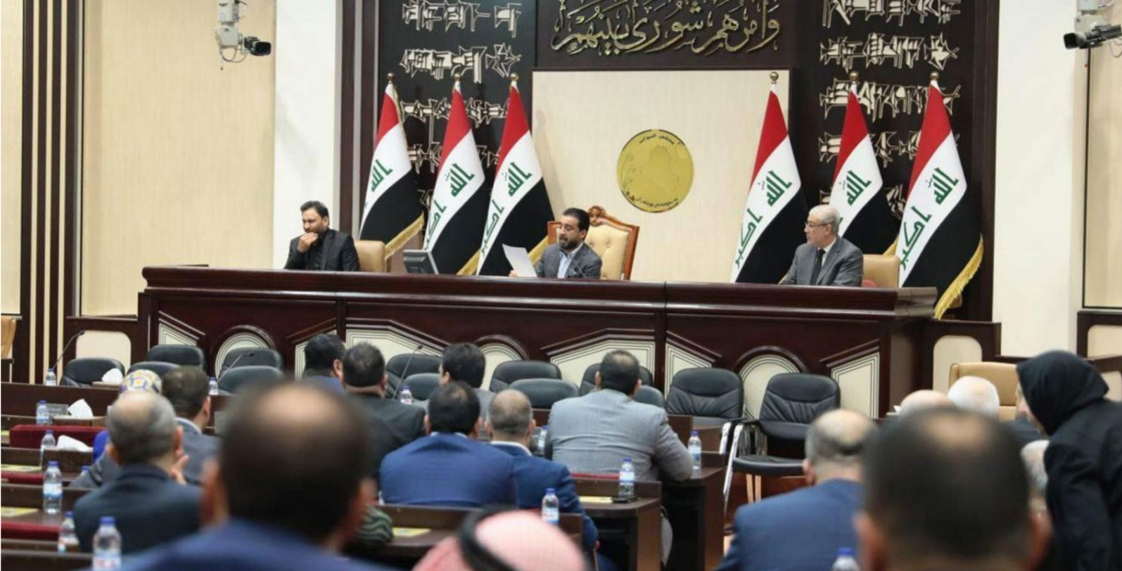
مجلس النواب "رشيف"