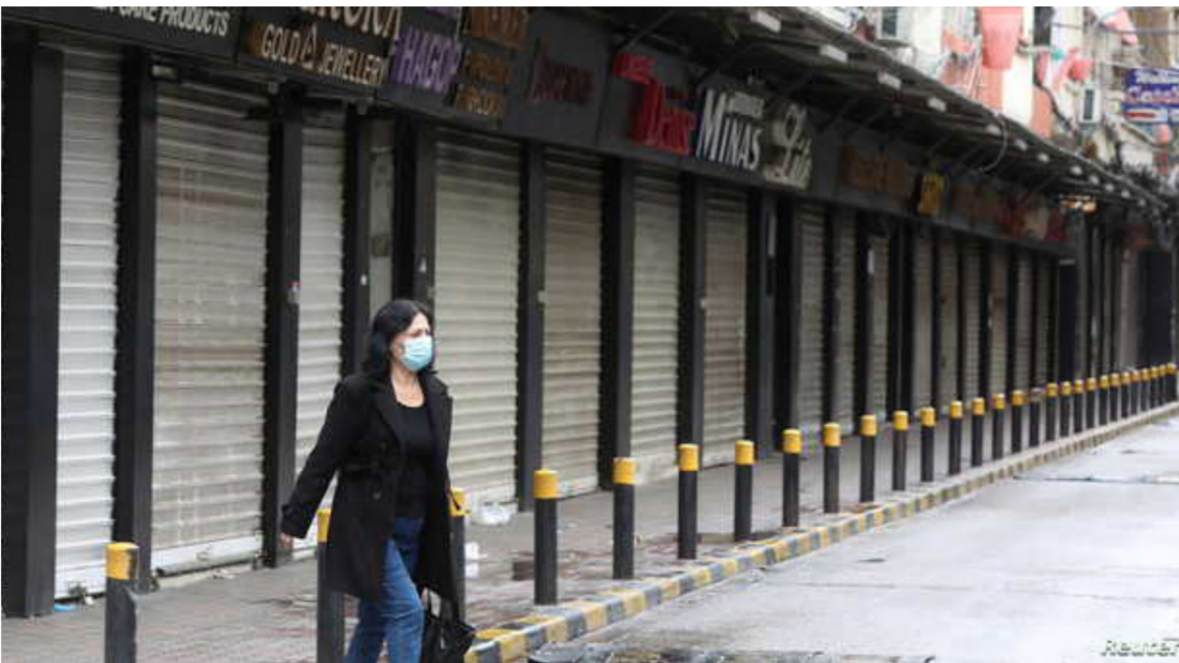
الإغلاق يضيف اعباء كبيرة على الاقتصاد اللبناني