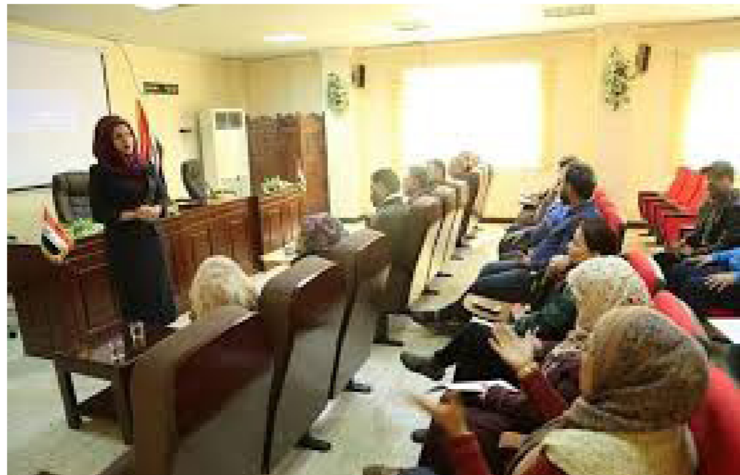
نشاطات التربية البدنية والرياضة