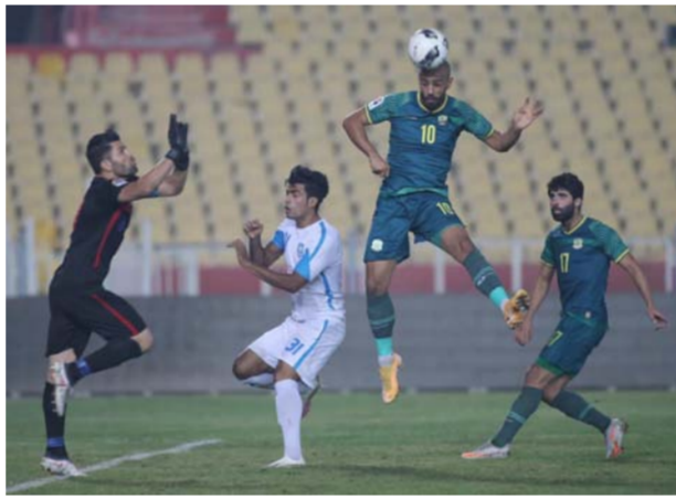
صورة من مباراة الدوري