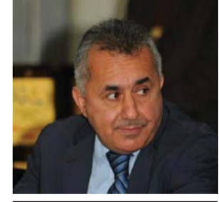
للتواجد في المكان المناسب» وأكد الوفد بحسب البيان «جهزته لاستضافة الدورات