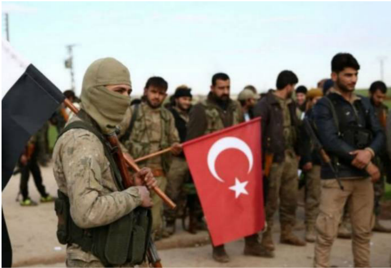
مرتزة سوريون يحملون العلم التركي