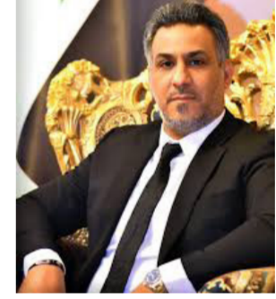
و ايضا الاغراءات والصكوك المفتوحة التي عرضت علينا من اناس انتفعوا من المال