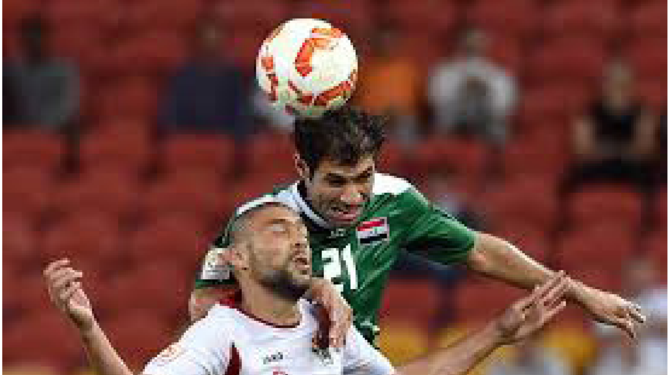
العراق والاردن في مباراة سابقة

لم يعد بإمكانه المشاركة في معسكر الإمارات وخوض الواجهتين الوديتين». واستفهام المباراتان في الـ12 والـ17 من الشهر الحالي في الإمارات. الأرن وأوزبكستان». وأوضح أن «نتائج الفحوص الخاصة بالمدافع ظهرت اليوم وتؤكد غيابها عن الملعب لفترة 3 أسابيع إلى شهر واحد، بالتالي