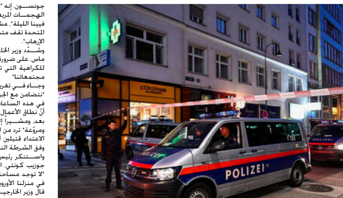
الشرطة النمساوية تنتشر في فيينا

جونسون، إنه "مصدوم بشدة من الهجمات الربعية التي وقعت في فيينا ليلة"، مشيراً إلى أن المملكة المتحدة تقف متحدة مع النمسا ضد الإرهاب". وشدد وزير الخارجية الألماني، هايكو ماس، على ضرورة "عدم الاستسلام للكراهية التي تسعى لاستهداف مجتمعاتنا". وجاء في تغريدة للوزير الألماني "تنضامن مع الجرحى ومع الضحايا في هذه الساعات الصعبة". معتبرا أن نطاق الأعمال الإرهابية لم يتضح بعد، ومشيراً إلى "أنباء صادمة ومروعة" ترد من النمسا حيث أوقع الاعتداء قتيلاً أحدهما مشتبه به، وفق الشرطة النمساوية. واستنكر رئيس الوزراء الإيطالي، جوزيب كونتي، الهجوم بشدة إنه "لا توجد مساحة للكراهية والعنف في منزلنا الأوروبي المشترك". كما قال وزير الخارجية الإيطالي، لويجي دي مايو، في تغريدة إن "أوروبا يجب أن تظهر ردة فعل" بعد "الهجوم الجبان