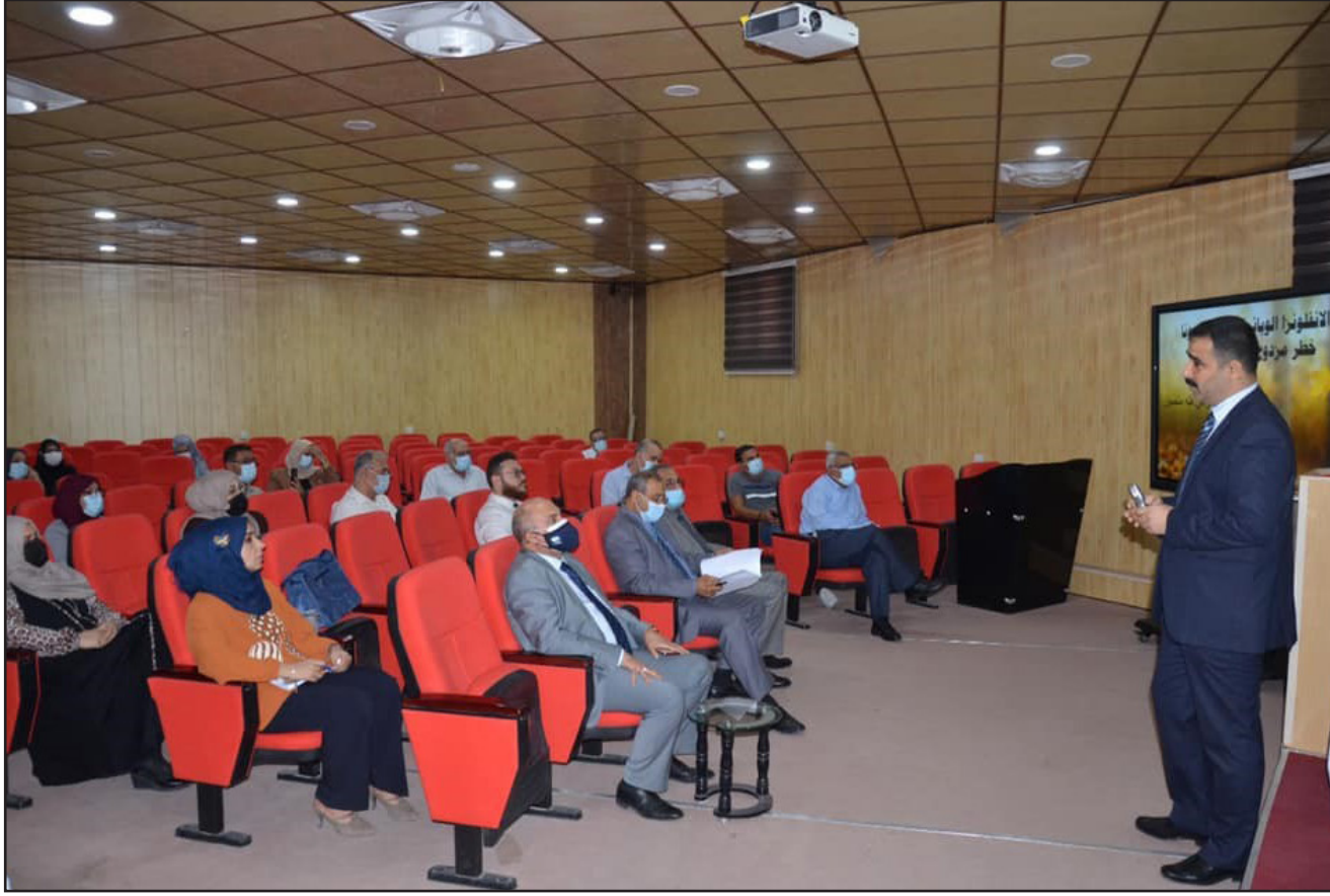
ندوة علمية عن الانفلونزا البوابية وجائحة كورونا خطر مزدوج في خريف 2020

فقر الدم المنجلي في مجلة Indian Journal of Forensic Medicine and Toxicology (IJFMT) وهي مجلة عالية ضمن مستوعبات سكوبس. ويهدف البحث الى مقارنة الاختلاف في عدد الصفائح الدموية ومعدل وقت النزيف فقر الدم المنجلي والأشخاص الأصحاء في مجموعة السيطرة.