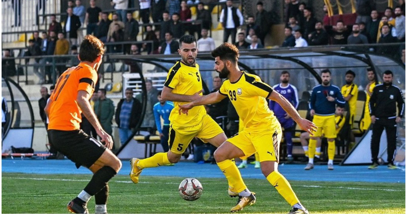
لقطة ارشيفية لدوري الكرة