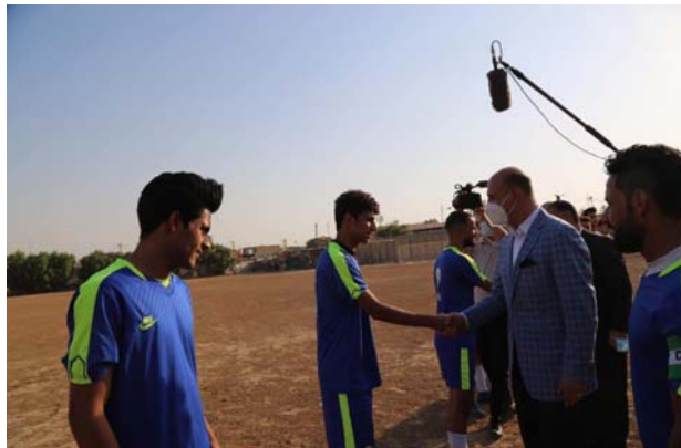
رجال في ملاعب الفرق الشعبية

من النجوم ولاعبى الاندية والمنخبات الوطنية.. وفي ختام المباراة قدم وزير الشباب والرياضة العبادي تقديراً للفرقيين المتباريين، وحكام المباراة.