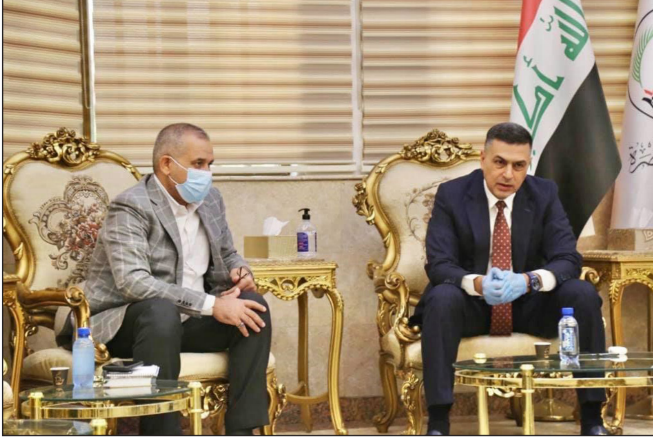
محافظ البصرة ومدير عام الموائى خلال اجتماعهما لحسم ملف أراضي الموائى في شط البصرة