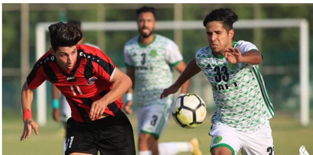
لقطة ارشيفية من دوري الكرة الممتاز