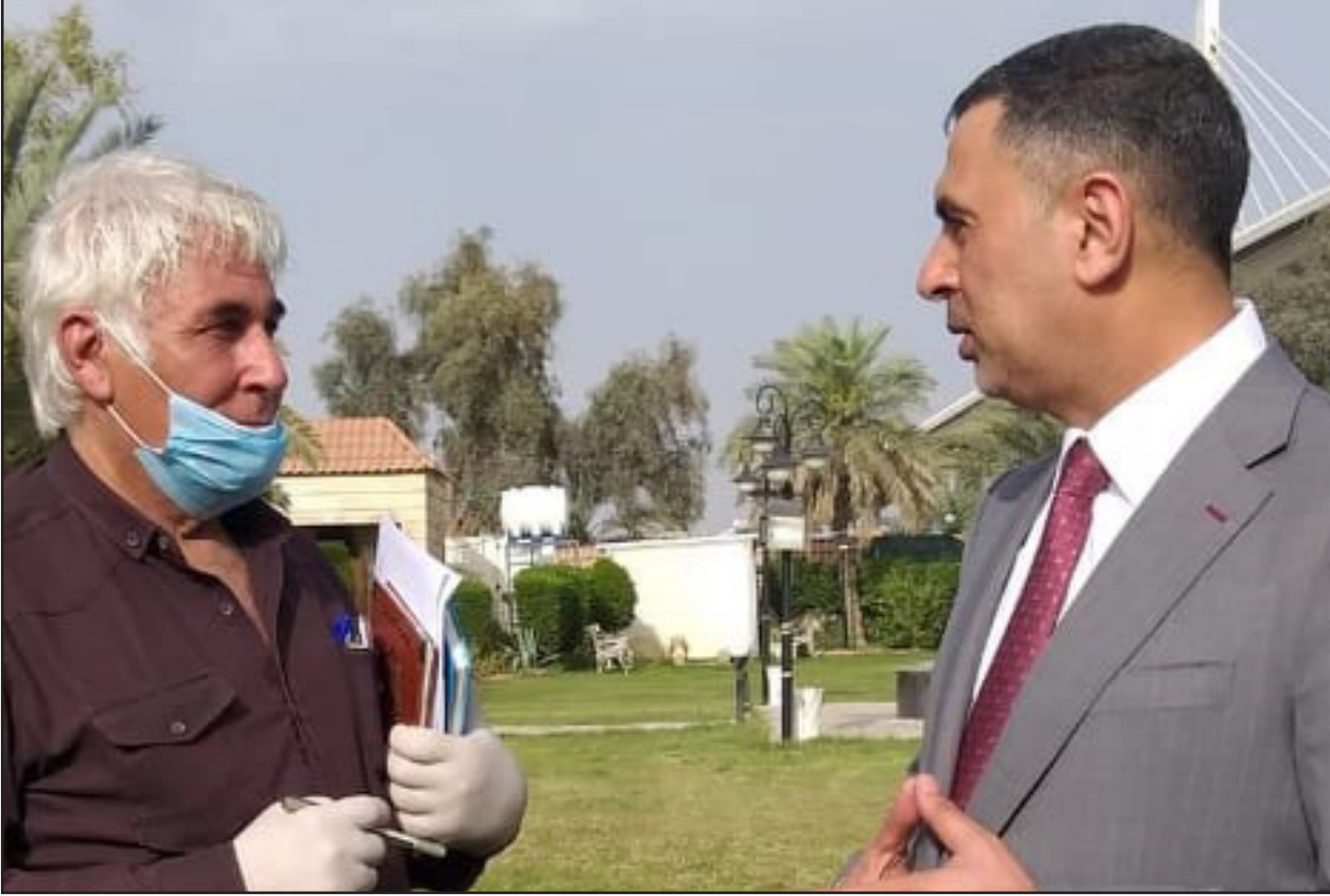
محافظة البصرة يتحدث لمراسل الصباح الجديد في المحافظة

وأشار الى ان البصرة تأمل ان تحصل على خبرات اكبر من كل المنظمات الانسانية والدولية في مختلف المجالات بما يضمن تحسين المستوى الحياتي لكل البصريين. من جانبها اوضحت نائب الممثل الخاص للامين العام للامم المتحدة (يونامي) والمنسق المقيم للشؤون الانسانية في العراق. ايرينا فويشكوفكا-سولورانو انها سعيدة بزيارتها الى محافظ البصرة ولقاء المحافظ. وازدادت انتسى سعيدة جدا بتواجدي بالبصرة. ونحن نعمل في الامم المتحدة على تنفيذ برامج مهمة لتحسين التعليم والمياه والبيئة والبرامج الثقافية الاخرى في البصرة التي تمتلك اهمية خاصة في الصحة ومكافحة فيروس كورونا(كوفيد 19) وايضا العمل على نشر ثقافة مسالة التباعد الاجتماعي ودعم قطاع الصحة وقضايا اخرى ختاج المساعدة. واختتمت الحديث بالقول ان زيارات اخرى لمحافظة البصرة سينفذها صندوق الامم المتحدة لدعم العراق(اليونامي) ومكتب المنسق العام للشؤون الانسانية في العراق. من اجل العمل في المجتمع البصري. مجتمع امن وصحي ومتقدم.