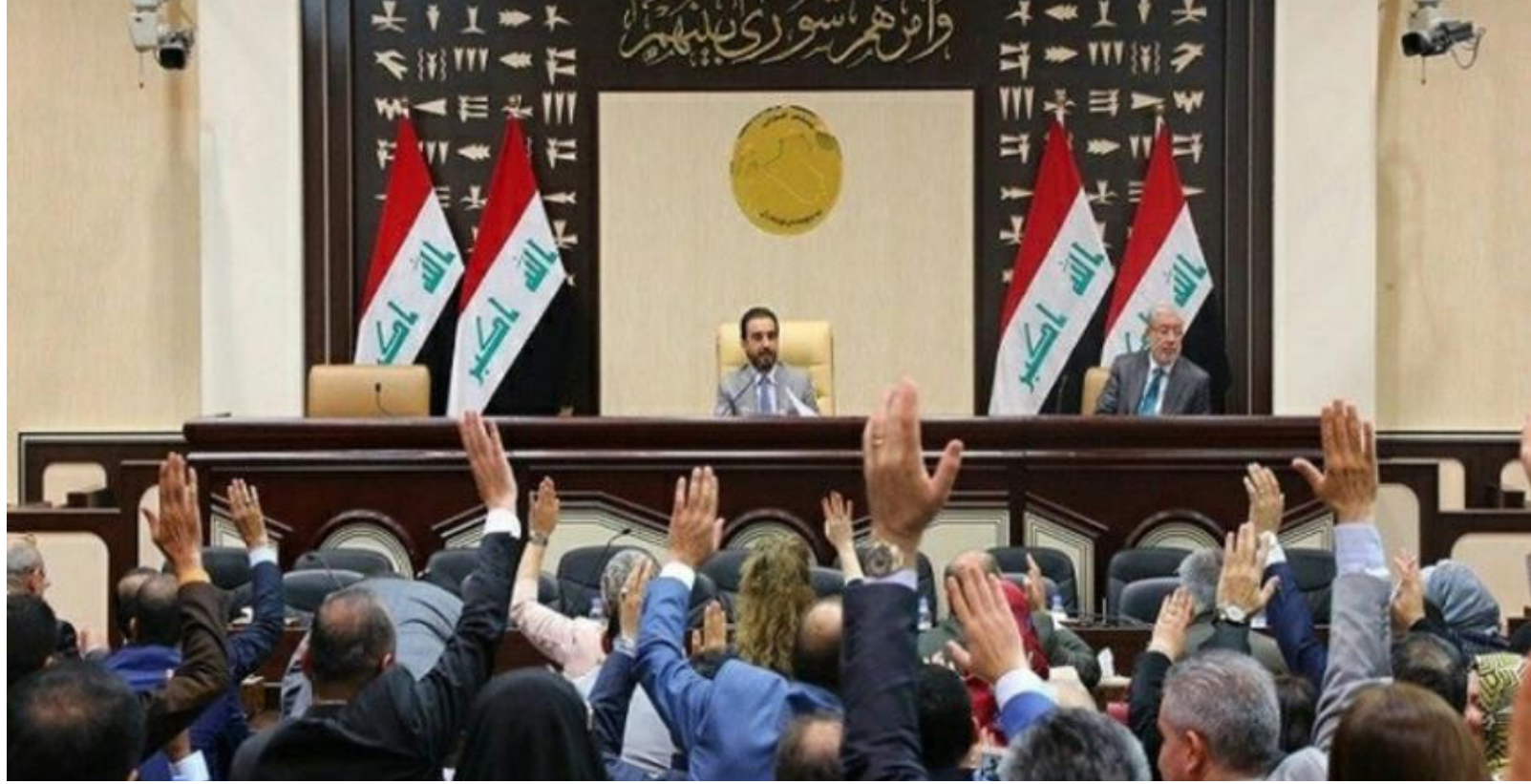
مجلس النواب "رشيف"

انتخابية ومن بعدها نهي هذا الملف نهائياً". وإشارة إلى أن "انتلاف دولة القانون كشف عن تقديم طلبات بإعادة التصويت على عدد الدوائر الانتخابية، مشيرة إلى أن النصاب كان غير متحققاً، فيما لوح بالظن في الجلسة أمام المحكمة الاتحادية العليا.