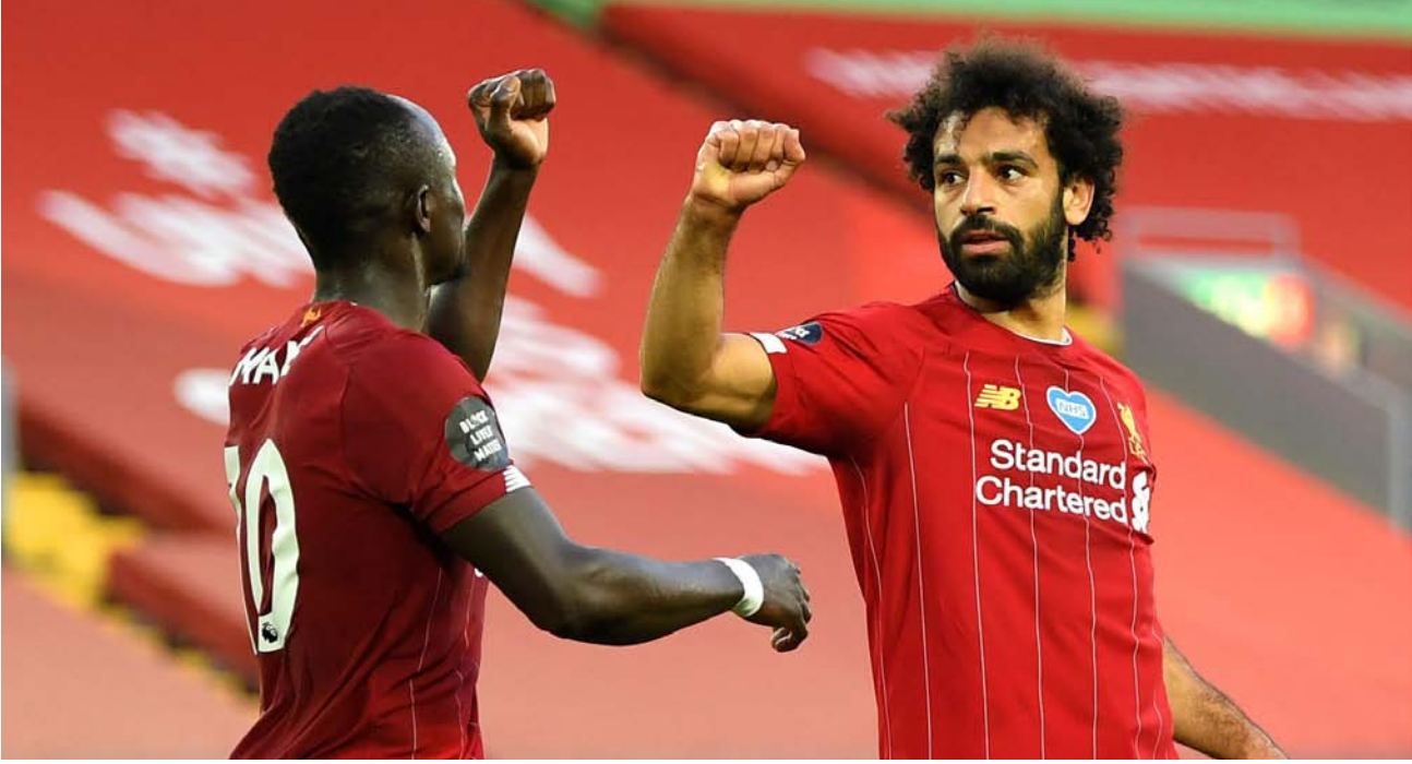
صلاح يتبادل التهنة مع ماني

واحدة وهذا هو الموقف الحالي المباراة كانت جيدة وأحببتها في الكثير من اللحظات بالطريقة التي لعبنا بها أمام فريق جيد». وفي مباراة أخرى، حرم ساوثهامبتون مضيفه تشيلسي من نقاط الفوز بالتعادل معه في الوقت القاتل (3-3)، في مباراة احتضنها ملعب ستامفورد.. أهداف البلوز جاءت عن طريق النانسي الألماني تيمو فيرنر «هدفين» وكاي هافيرتز في الدقائق (15، 28 و59)، فيما أحرز داني إجز تشيكي آدمز وجانيك فيستيرجرار، ثلاثية الشيفوف في الدقائق (43، 57 و92).. بهذه النتيجة، استقر تشيلسي في المركز السادس برصيد 8 نقاط، فيما احتل ساوثهامبتون المرتبة العاشرة بنقطة أقل. ووفقا لشبكة «أوتسا» للإحصائيات، فإن هذا الهدف رقم 30 لفيرنر على صعيد مسابقات الدوري منذ بداية الموسم الماضي.. ولا يتفوق على فيرنر في هذه الفترة الزمنية، بالدوريات الخمسة الكبرى، سوى ثلاثة لاعبين هم مهاجم بارين ميونخ، روبرت ليفاندوفسكي، ونظيره في لانسبيو، تشيرو إيبوبيلي، ونجم يوفنتوس، كريستيانو رونالدو.. يذكر أن فيرنر انتقل إلى تشيلسي في الميركاتو الأخير، قادما من لايبزيغ الألماني.