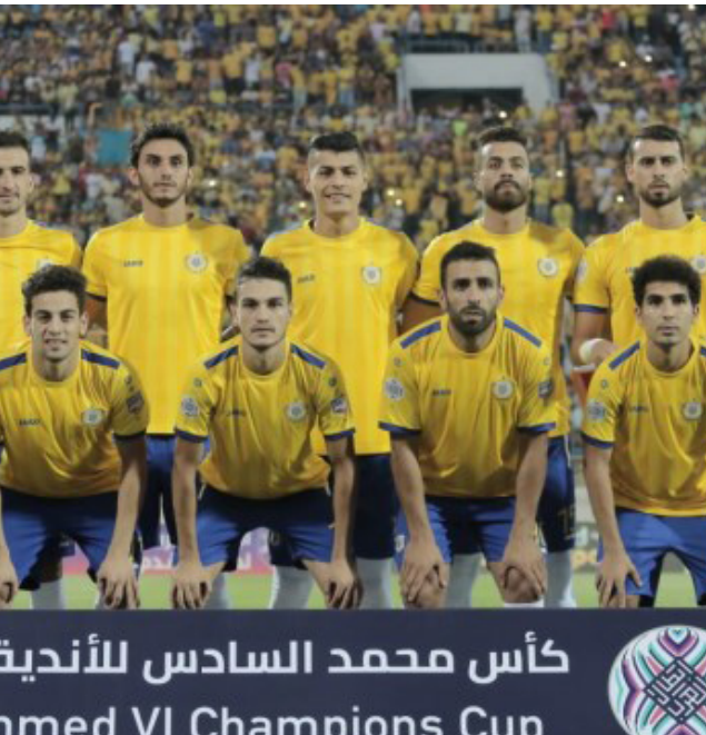
كأس محمد السادس للأندية الأبطال Mohammed VI Champions Cup