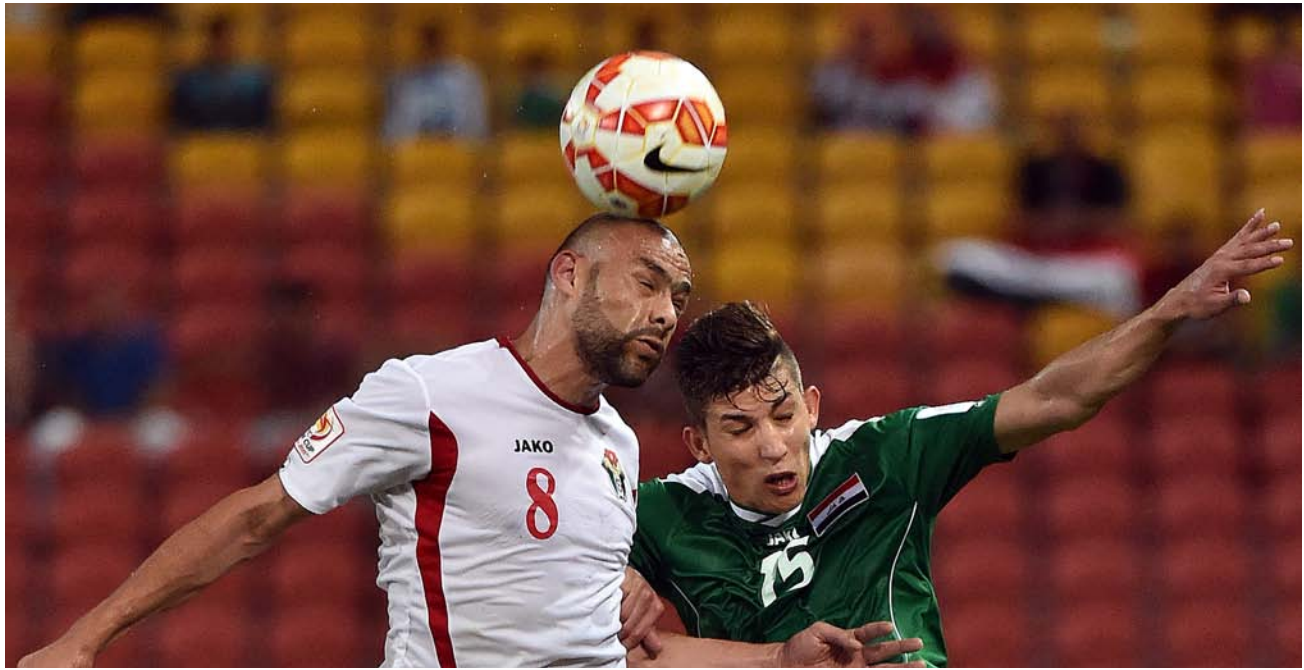
العراق والاردن في لقاء سابق

إلى ذلك، خاطبت الهيئة التطبيقية للأخاد العراقي لكرة القدم، أندية 4 لاعبين مغتربين، وذلك من أجل تفرغهم لصفوف منتخب الشباب بقيادة المدرب قحطان جيسر لودي قطر بالربيع عشر والسابع عشر من الشهر المقبل في الدوحة، خصيرا لبطولة آسيا تحت 19 عاما، التي تم تأجيلها إلى بداية عام 2021.