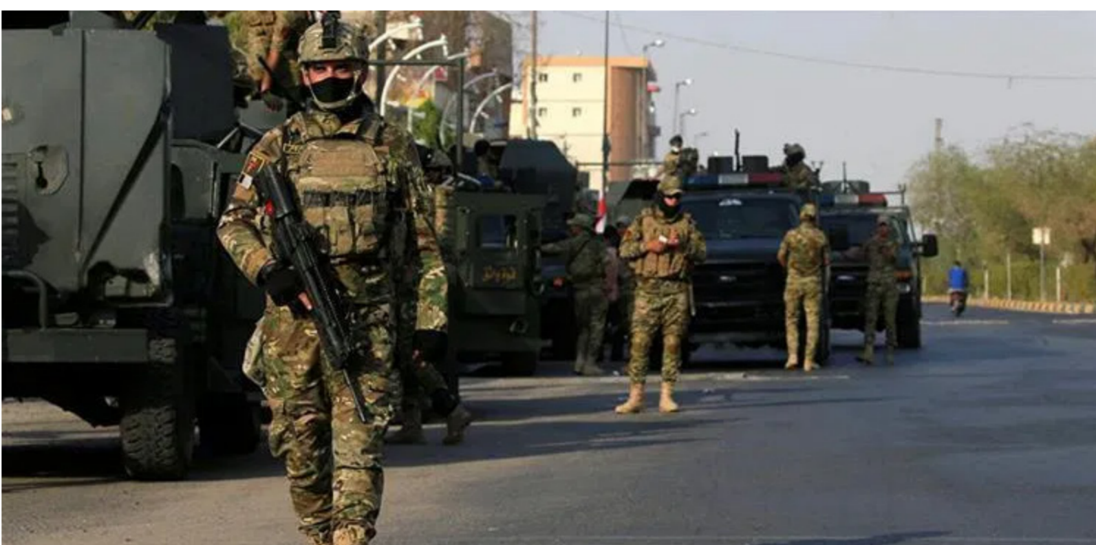
قوات العمليات المشتركة

للقوات الاقليمية وكذلك حرس الإرهاب". وأضاف الاعاجيبي. في تصريح إلى "الصباح الجديد". أن "المدة الماضية قد شهدت تصاعداً لنشاط الجماعات الارهابية لاسيما في المناطق الرخوة ما يتطلب تكثيف الجهد الامني والدفاع النيابية سعرا ن الامن والاطمئنان على المواطنين في المناطق المتنازع عليها بالتزامن مع تنامي خطر تنظيم داعش الارهابي".