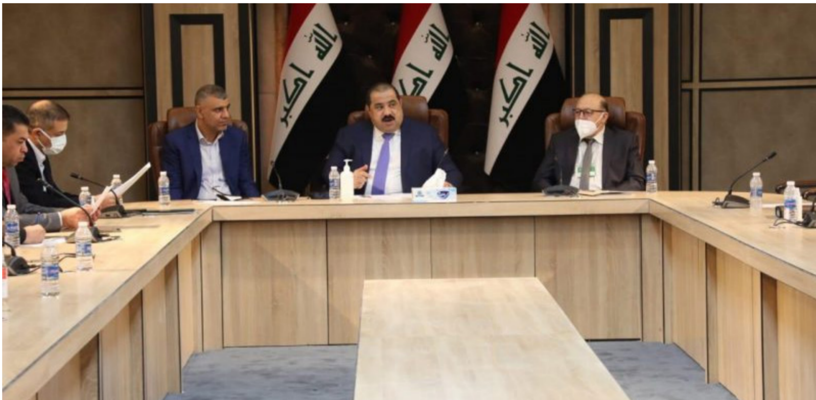
اجتماع لجنة المالية

بغداد - الصباح الجديد: قال رئيس الوزراء مصطفى الكاظمي، إن خطة الإصلاح التي قدمتها الحكومة للبرلمان والقوى السياسية ستكون بمثابة الحل للأزمة الاقتصادية التي ضربت البلاد. وأوضح الكاظمي - في تصريحات خلال لقائه مع قوى سياسية - أن عدم تنوع مصادر الدخل والاعتماد الكامل على النفط هو