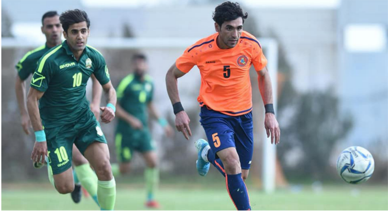
لقطة إرشيفية من مباريات دوري الكرة الممتاز

وعن ملعب الشهداء، قال إن الوزارة تسعى بكل طاقتها لافتتاحه مع انطلاق الموسم، ليستضيف مباراة القمة بين الزوراء والبصرة، وهناك اتفاق مع الشركة المنفذة لإنهاء مساعد مفضورة جلال الأعمال