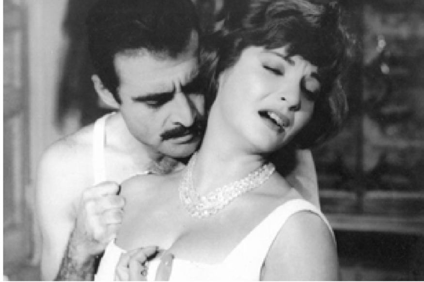
فيلم لوعة الحب

زوجتي والكلب .. نظرة داخل عقل رجل يشك لوعة الحب .. خيانة مع إيقاف التنفيذ