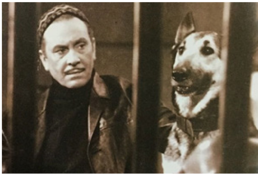
فيلم زوجتي والكلب