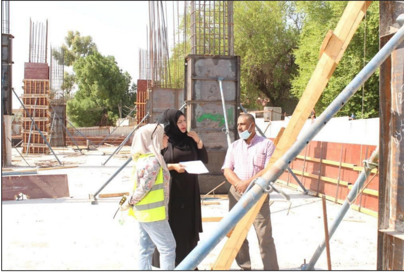
جانب من أعمال مشروع المستشفى التخصصي للأمراض الباطنية في البصرة