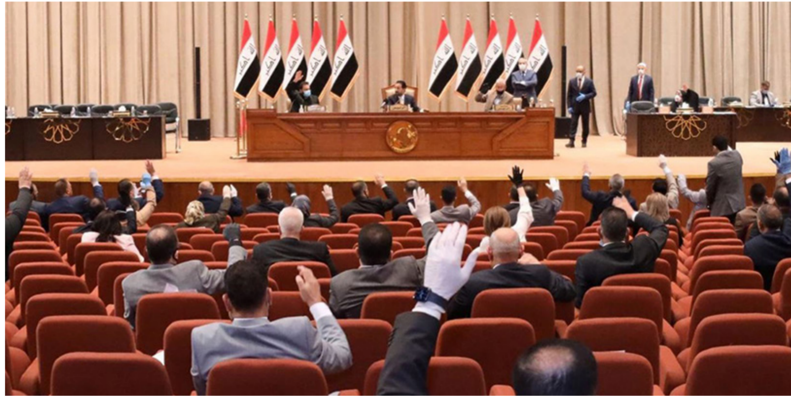
مجلس النواب "ارشييف"