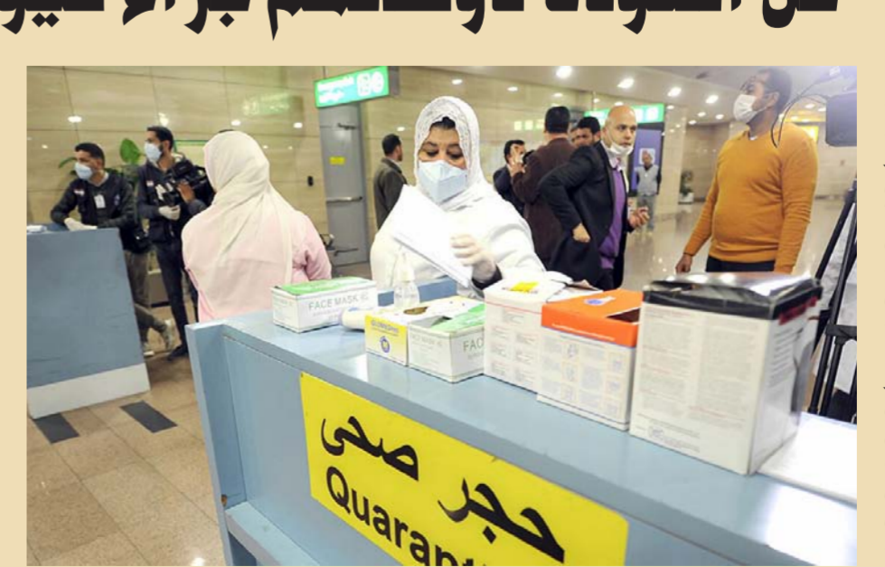
المفوضية لمنع الوباء. وذكر التقرير أن بعض المهاجرين الذين تقطعت