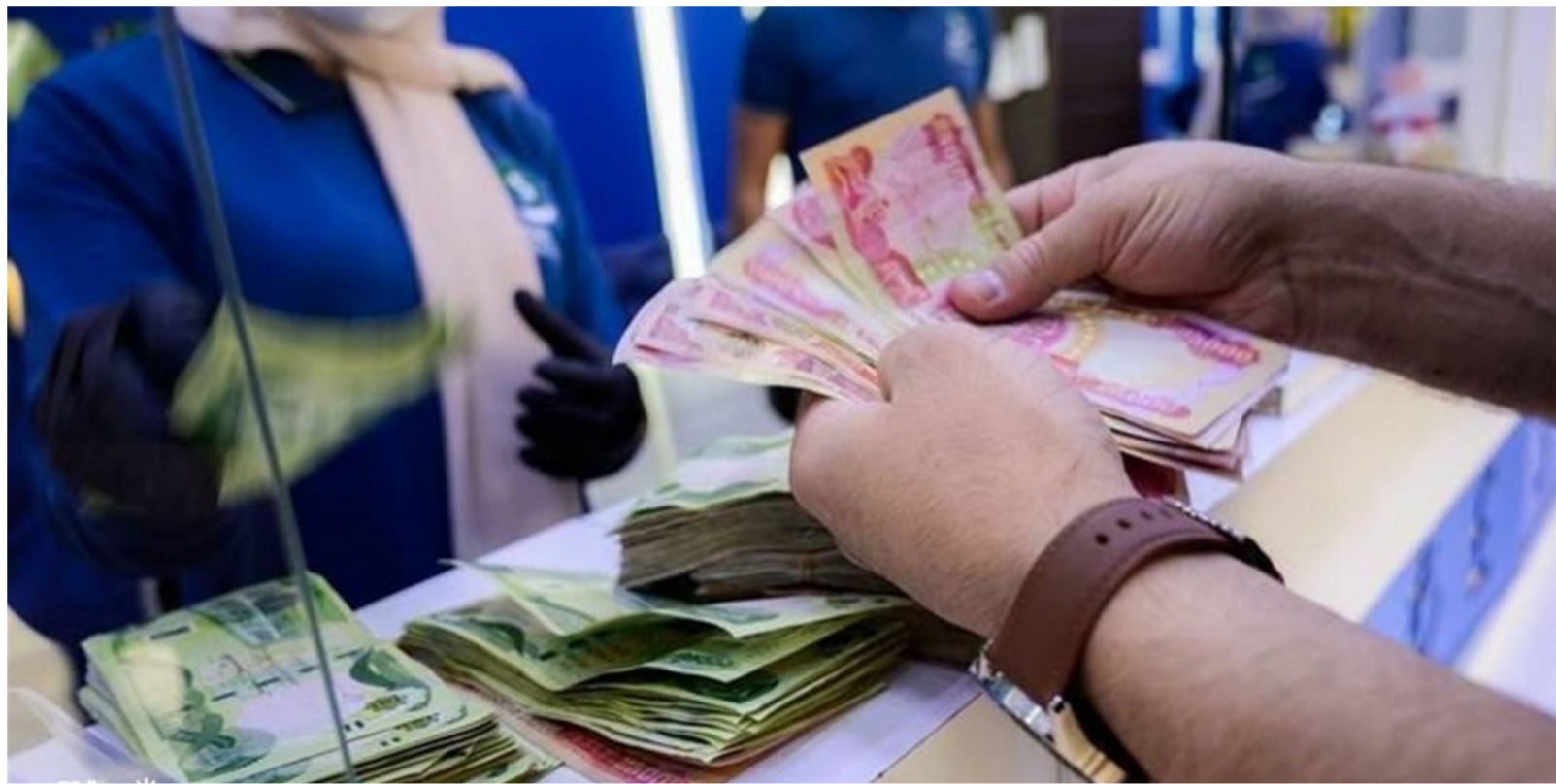
تأمين رواتب الموظفين.. مأزق جديد للحكومة

متلفزة. إن "العراق لا يمتلك قاعدة بيانات ولا توجد احصائيات لعدد الموظفين في البلاد". مشفيرا الى أن "الحكومة لا تعرف عدد الموظفين ولا حتى وزارة المالية لديها ارقام حقيقية". وأضاف الصغار أن "ملف الموظفين وعددهم يحتاج الى عمل حقيقي. خاصة أن هناك