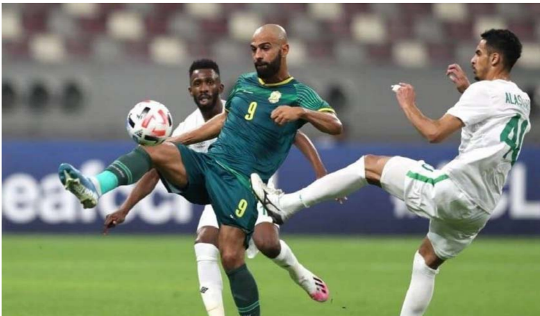
مباراة سابقة للشرطة في دوري أبطال آسيا