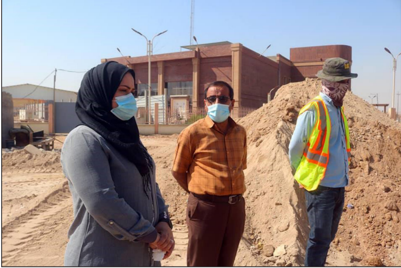
جانب من أعمال مشروع البنى التحتية في دور القضاة بالبصرة

التربية والتعليم العالي في خطة مشاريع البصرة لعام 2019، ويستمر العمل في مرحلة إكمال مخططات المرحلة الثانية للمشروع لتنفيذ أعمال الأساس للموقع الرئيس بعد إكمال الأعمال الترابية بالكامل. وبعد إكمال إجراءات تخصيص مساحة الأرض المطلوبة لتوسعة الجامعة وتشمل عدد من الكليات الأخرى. وتبلغ كلفة مشروع بناء جامعة الزبير 28 مليار دينار وينفذ على أرض مساحة 24 دوها ضمن مشاريع تنمية الأقاليم محافظة البصرة لعام 2019 ولمدة 24 شهرا.