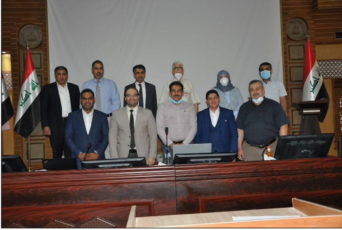
جانب من المشاركين في المؤتمر التقويمي لجامعة البصرة

الكفاءة كمؤشر لتقييم أداء المصارف . وبين الفصل الثالث قياس كفاءة المصارف التجارية العراقية . واخيرا اهتم الفصل الرابع بالاستنتاجات والتوصيات . وهدف البحث الى تحديد المصارف الكفوءة وغير الكفوءة مع ذكر اسباب عدم الكفاءة وبالتالي وضع الحلول ورسم الخطى الواجب اتباعها وتحديد النقاط المرجعية التي يجب اللجوء لها من قبل المصارف غير الكفوءة واستنتج البحث لى ان هناك مصارف حققت الكفاءة لانها استخدمت مدخلاتها بشكل امثل لتصل الى اقصى مستوى من المخرجات . بالمقابل توجد مصارف لم تحقق الكفاءة لفشلها في توظيف مزيج مدخلاتها الذي بدوره يحقق مستوى مخرجات امثل . واوصى الباحث باعتماد طرائق المصارف الكفوءة اللامعلمية منها DEA كأداة لقياس الكفاءة المصرفية لانها تتوافق وعمل المصارف .