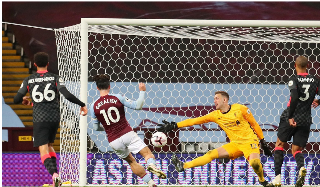
احد أهدافاستون فيلا في شبك ليفربول

فيلا من تسجيل 7 أهداف في مباراة واحدة في عصر البريميرليج. كانت في نفس الشهر. تشرين الأول. وذلك أمام ساوثهامبتون عام 1996. ومانشستر سيتي في 2011. إضافة إلى لقاء أول أمس.. أما جوزيه مورينيو. المدير الفني لتوتنهام هوتسبير فنجح في معادلة أكبر فارق من الأهداف (5). لانتصار حقه مدرب أمام فريق سبق أن دربه. وكان الذي سبق مورينيو لهذا الإنجاز هو بريندان روجرز رفقة ليفربول. عندما هزم سوانزي سيتي بخماسية نظيفة. في شباط 2013. أما هاري كين. نجم السبيرز. فساهم في تسجيل 9 أهداف هذا الموسم بالبريميرليج (أحرز 3 وصنع 6).. ولم يساهم أي لاعب في عدد أكبر من الأهداف. في أول 4 جولات من البريميرليج. سوى تيري هنري في موسم (2004-2005). عندما شارك في تسجيل