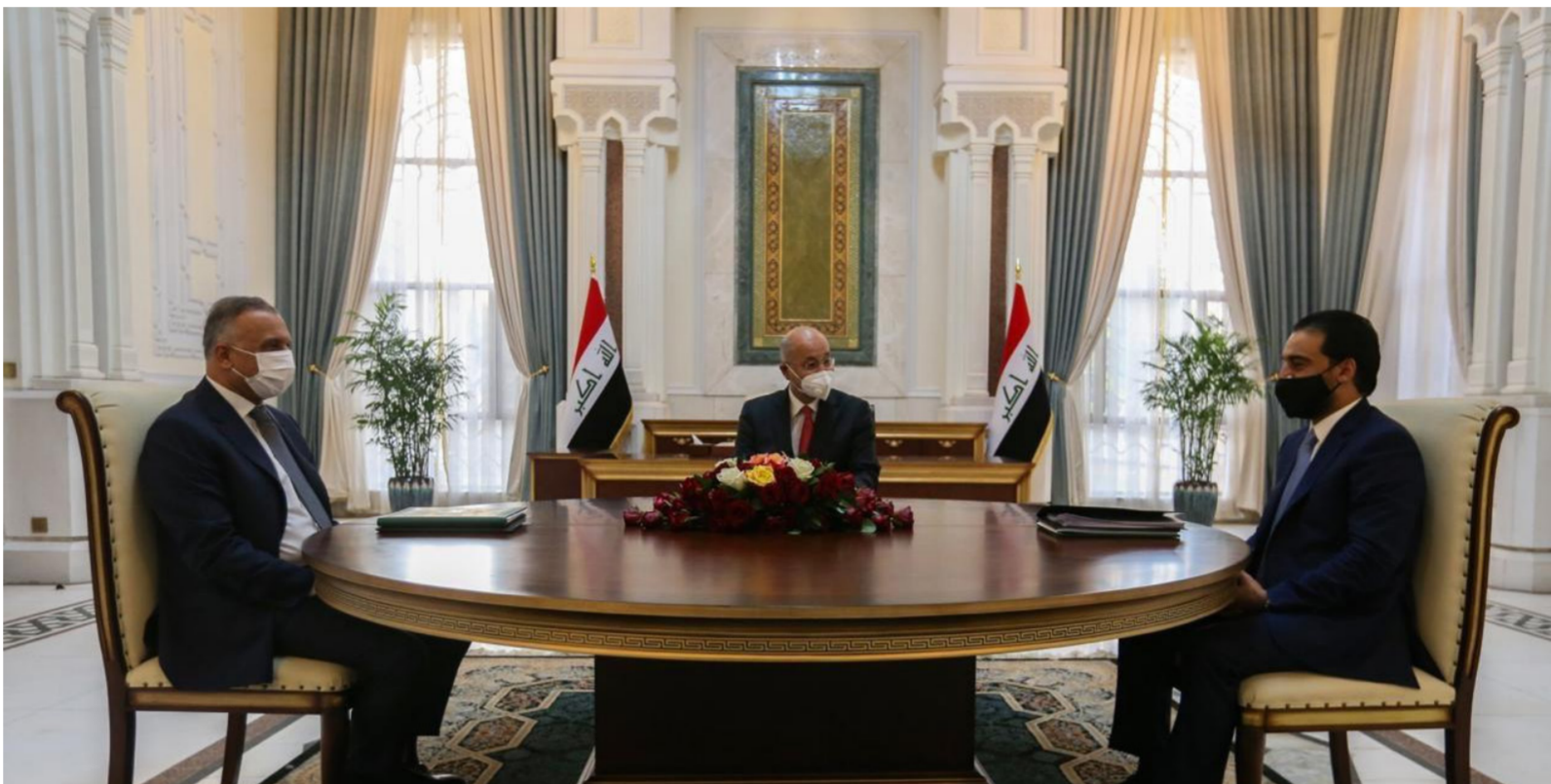
اجتماع سابق للرؤساء الثلاث

بغداد - الصباح الجديد: أكدت الرؤساء الثلاث في بيان ائتماع ضمها وحضره رئيس مجلس القضاء الأعلى فائق زيدان، ضرورة حصر السلاح بيد الدولة وحماية البعثات الدبلوماسية، والتصدي للأعمال الخارجة عن القانون ضد أمن البلاد وسيادتها، وتمسك العراق بمخرجات الحوار الاستراتيجي مع الولايات المتحدة واتفق إعادة الانتشار من العراق خلال مراحل زمنية متفق عليها، إضافة إلى التعاون طويل الأمد معها. ودعم الاجتماع بحسب البيان مشترك للرؤساء الثلاث والذي اطلعت عليه الصباح الجديد أمس. جهود الحكومة العراقية في حصر السلاح بيد الدولة، ومنع استهداف البعثات الدبلوماسية التي تقع مسؤولية حماية أمنها وسلامة منشآتها وأفرادها على الجانب العراقي ضمن التزاماته الدولية المعمول بها.