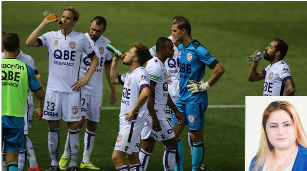
مشروب الطاقة للاعبين الكرة

القلب. ويعتقد الباحثون أنّ ذلك يحدث نتيجة الاستهلاك المفرط للكافيين، وعلى الرغم من ذلك يمكن القول إنّ شرب مشروبات الطاقة بكميات معقولة من غير المرجح أن يسبب أي مشكلات في القلب عند الأشخاص الأصحاء والذين لا يعانون من مشكلات في القلب مسبقا. احتواؤه على كميات كبيرة من السكر؛ فكما ذكر سابقا، قد يسبب استهلاك كميات كبيرة من السكر ارتفاعا كبيرا في مستوياته في الدم، وقد يشكل ذلك مشكلة بالنسبة للأشخاص المصابين بالسكري، أو من يعانون من مشاكل في التحكم في مستويات السكر في دمهم، وقد وجد أنّ ارتفاع مستويات السكر في الدم يرتبط بارتفاع مستويات الإجهاد التأكسدي والالتهابات، والتي قد تؤدي إلى الإصابة بالأمراض المزمنة، ولذلك ينصح الأشخاص المصابون بالسكر وغيرهم بالانتباه إلى كميات السكر الموجودة في مشروبات الطاقة، واختيار الأنواع التي تحتوي على كميات قليلة منه. عدم ملاعته للأطفال والمراهقين؛ حيث وجد أنّ 31% تقريبا من الأطفال الذين تتراوح أعمارهم بين 12-17 سنة يستهلكون مشروبات الطاقة بانتظام على الرغم من أنّ الأكاديمية الأمريكية لطب الأطفال قد أشارت إلى أنّ الأطفال والمراهقين لا يجب استهلاكهم لهذه المشروبات، وذلك لأنّ الكافيين الموجود فيها قد يسبب الإدمان، وقد يؤدي إلى ظهور بعض الأضرار الجانبية في القلب والدماغ.