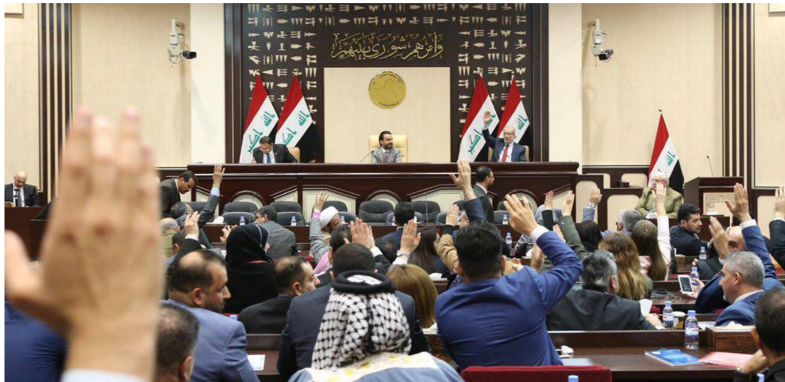
مجلس النواب "ارشييف"

رئاسة الجمهورية ونشره في الجريدة الرسمية". بنسار إلى أن مجلس النواب كان قد قرر في جلسته أمس الأول تأجيل القراءة الثانية لقانون الجرائم المعلوماتية بالتزامن مع الاحتشاد الذي تعرضت له. حيث وصف ناشطون بنوده بأنها سوف تسببهم في تقييد الحريات العامة، ودعوا إلى إيقاف تشريعه.