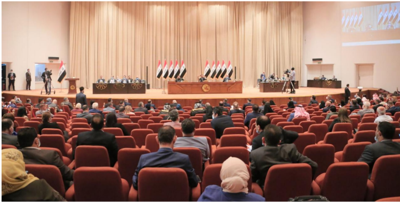
مجلس النواب "ارشيف"