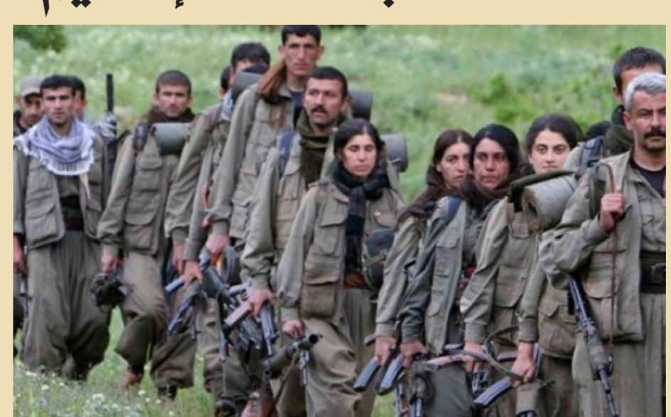
وجبال قاراجوخ التي ما زالت معرضة لهجمات من داعش.