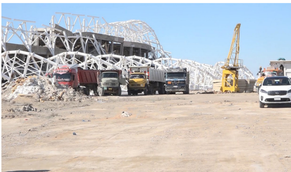
جانب من سير الاعمال في ملعب الأنابار الأولمبي