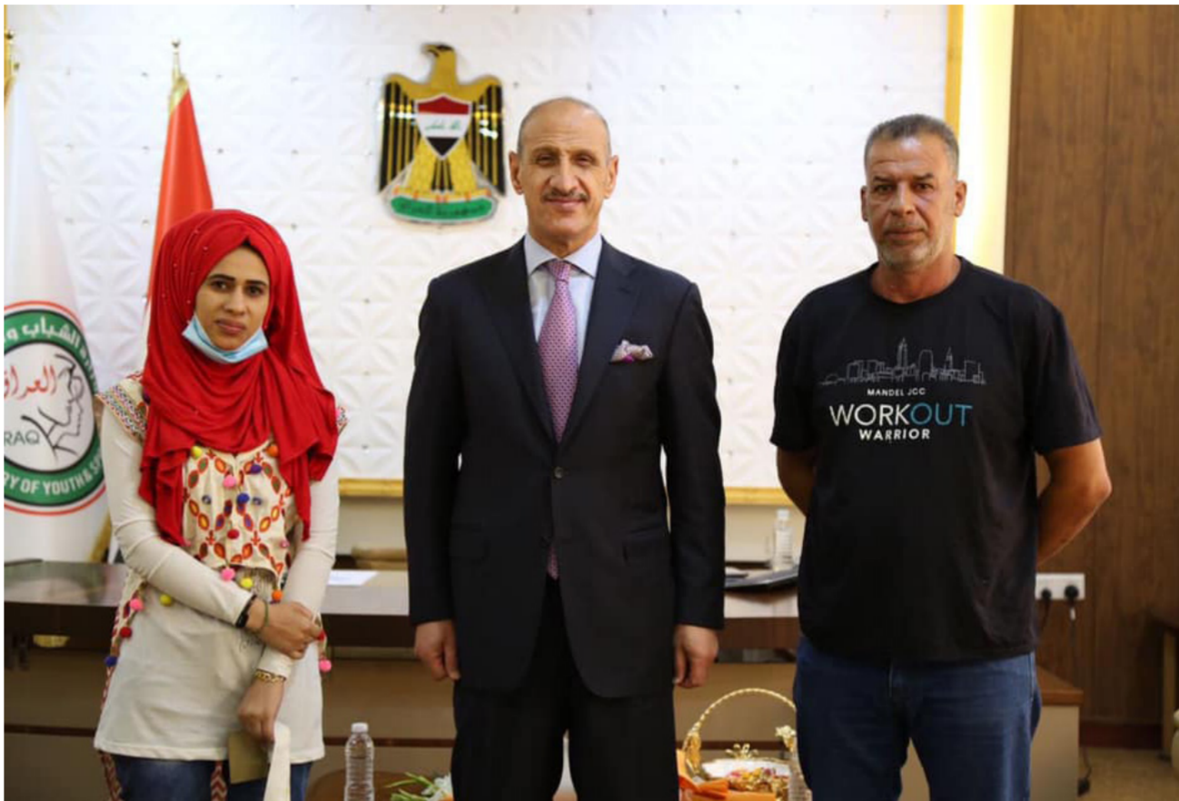
رجال يتوسط ورود ووالدها

من خلال الاتصال بحافظ كربلاء المقدسة نصيف الخطابي، التي الحكومة المحلية والأمانة العامة للعبة الحسينية وكل من يسهم