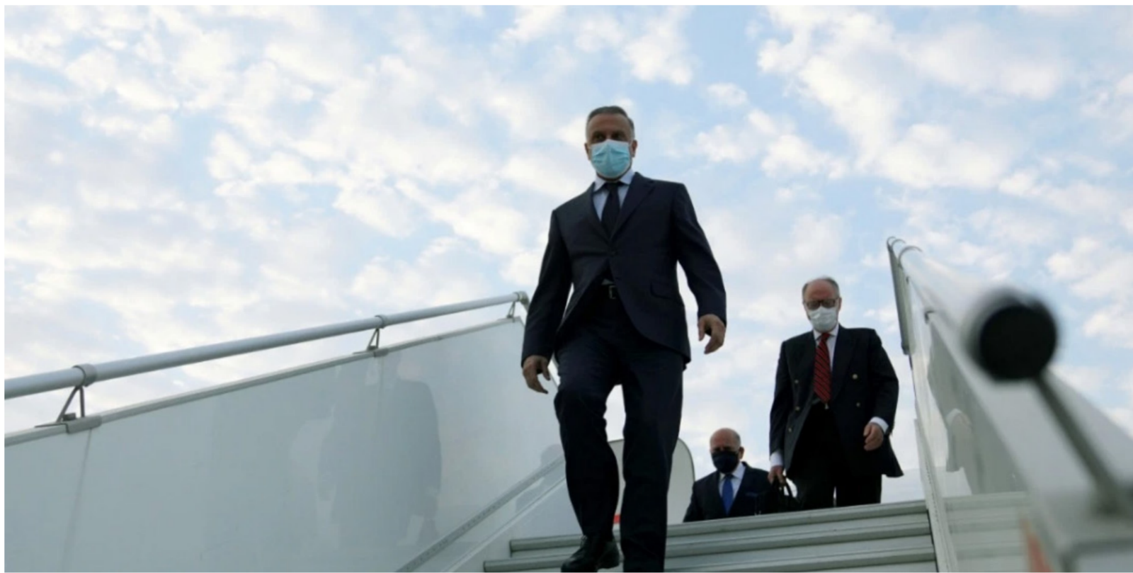
لحظة وصول الكاظمي الى واشنطن