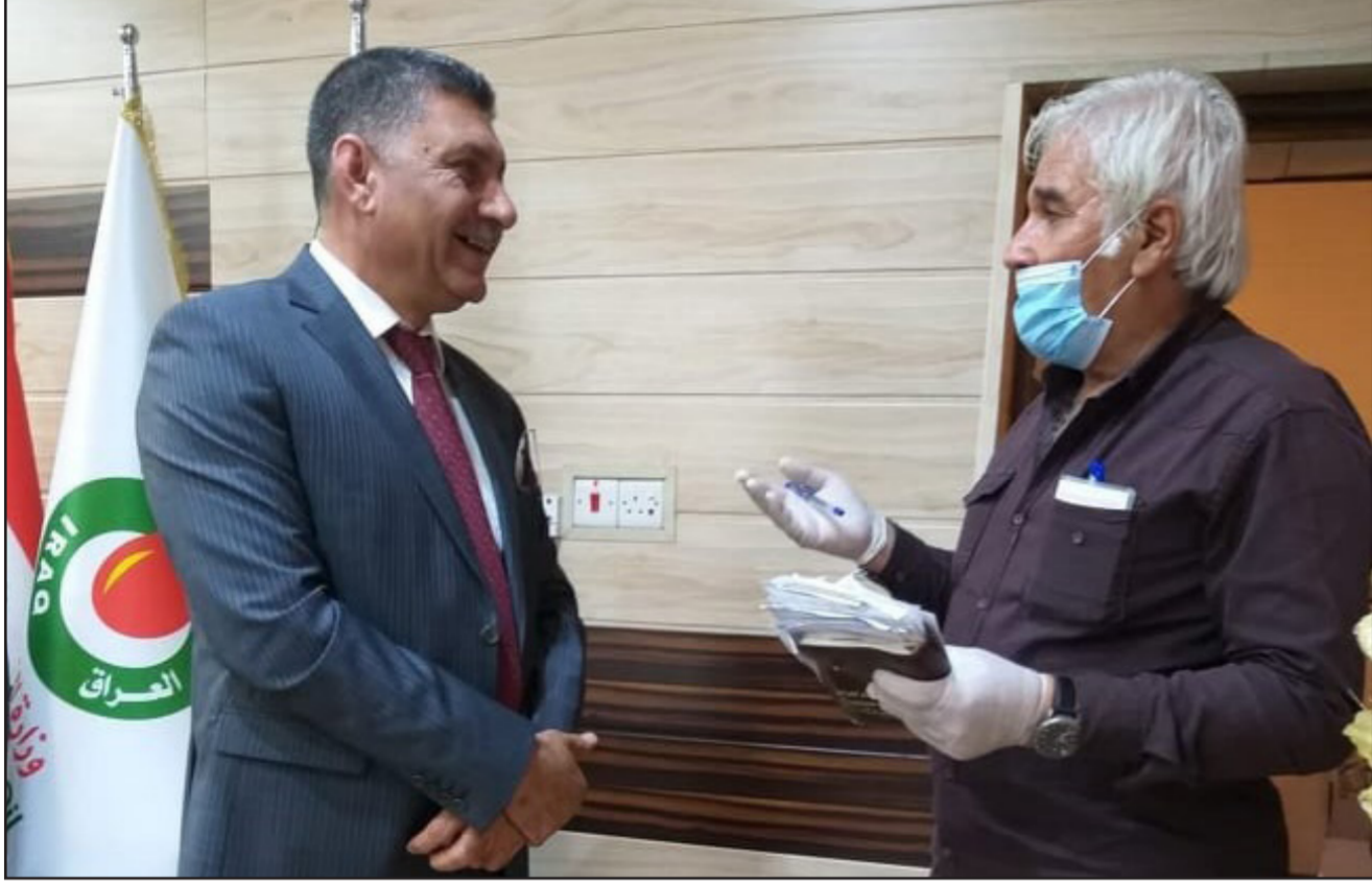
مدير عام شركة ناقلات النفط العراقية يتحدث لمراسلنا في البصرة

والنمو التكنولوجي . حلقة مهمة في الصناعات النفطية العراقية وتكاملها يذكر ان شركة ناقلات النفط العراقية احدي شركات وزارة النفط ومقرها بالبصرة وتقوم بنقل المنتجات النفطية والنفط الخام وجهز السفن بالوقود وقد تأسست عام 19٧٢ بعد ان ادركت الحكومة العراقية أهمية وتأثير نقل النفط عن طريق البحار واعتبرها حلقة مهمة ضمن الصناعات النفطية العراقية