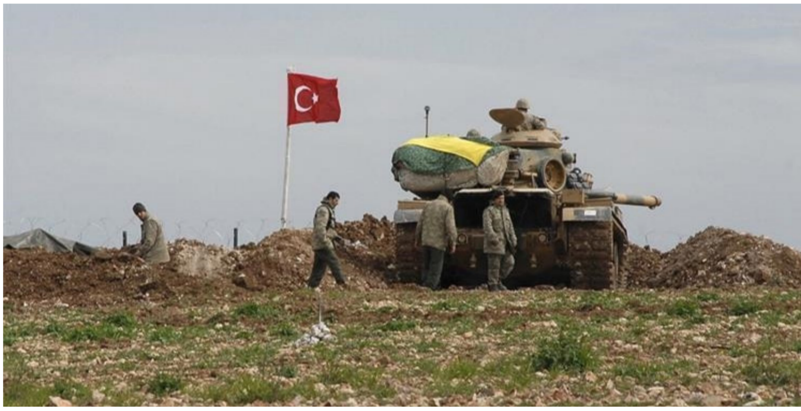
القوات التركية شمال البلاد "ارشييف"

الضغوط بإجاء إيقاف التغلغل التركي". يشار إلى أن طائرة مسيرة كانت قد قصفت أمس الأول قوات حرس ضابطين واحد المنتسبين، وأدى ذلك إلى صدور قرار من وزارة الخارجية إضافة إلى الجامعة العربية ومنظمة المؤتمر الإسلامي من أجل يستغل عدم وجود اتفاق أممي بين الحكومة الأخابية وإقليم كردستان، لاحتلال أراض عراقية". وأشار الركاكي، إلى أن "العراق أمام خيارات عدة لرد تمثيل بطرق أبواب المنظمات الدولية بينها الأمم المتحدة ومجلس الأمن الدولي، إضافة إلى الجامعة العربية ومنظمة المؤتمر الإسلامي من أجل يستغل عدم وجود اتفاق أممي بين الحكومة الأخابية وإقليم كردستان، لاحتلال أراض عراقية". وأشار الركاكي، إلى أن "العراق أمام خيارات عدة لرد تمثيل بطرق أبواب المنظمات الدولية بينها الأمم المتحدة ومجلس الأمن الدولي، إضافة إلى الجامعة العربية ومنظمة المؤتمر الإسلامي من أجل يستغل عدم وجود اتفاق أممي بين الحكومة الأخابية وإقليم كردستان، لاحتلال أراض عراقية".