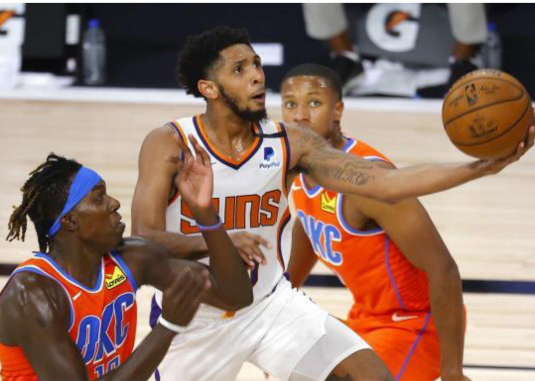
صنز يواصل نتائجه الإيجابية