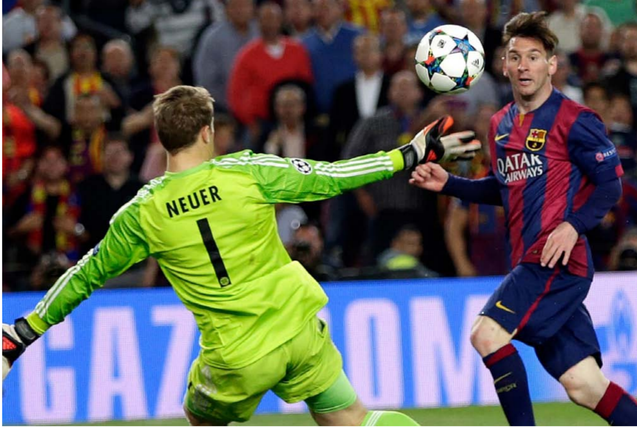
ميسي ضد بايرن ميونخ في لقاء سابق

يعبر البلوجرانا ويتوج باللقب في نهاية المطاف. أما ثالث مواجهة كانت كارثية على ميسي ورفاقه. في موسم (2012-2013). بالدور نصف