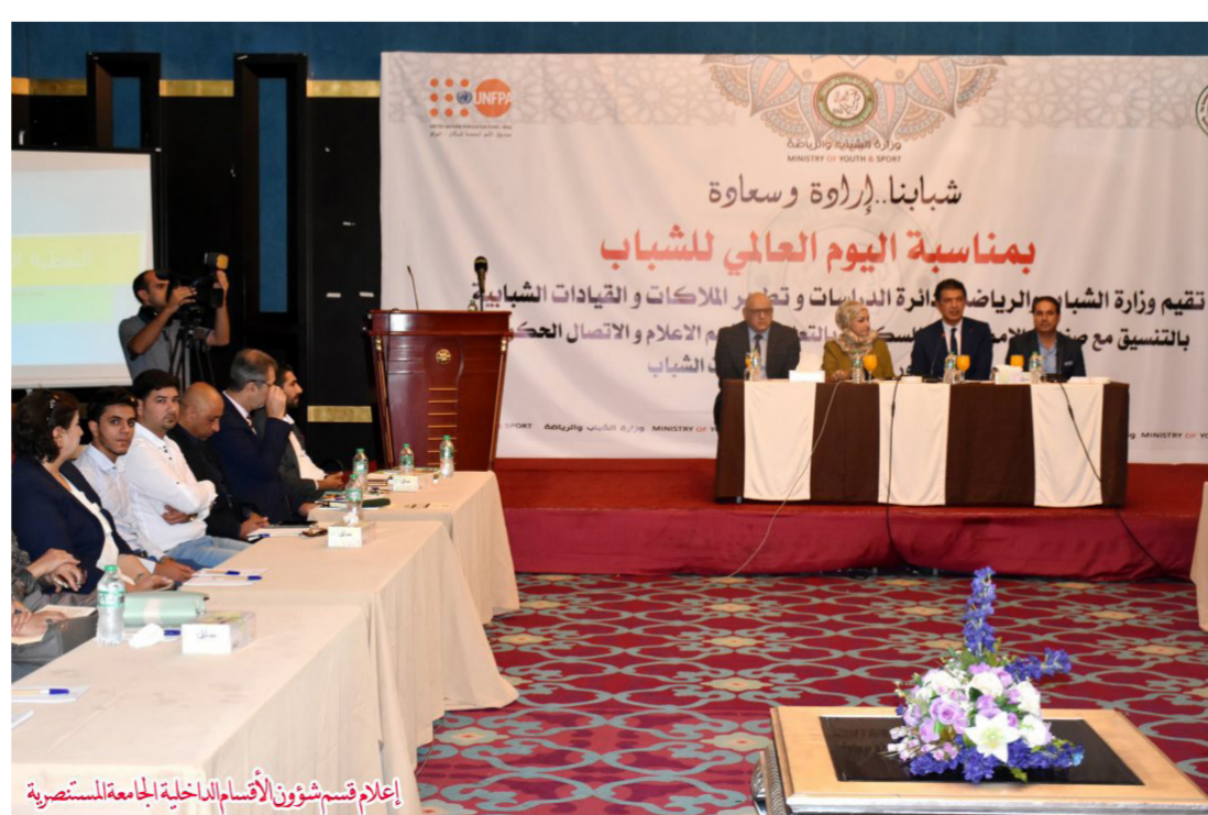
إعلام قسم شؤون الأقسام الداخلية الجامعة المستنصرية

جانب من مؤتمر سابق بمناسبة اليوم العالمي للشباب