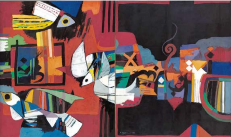
من اعمال الفنان ضياء العزاوي

الأحداث. بلغة سردية فيها الخوف والقلق والندم. ويحاول قدر استطاعته جعل العائلة المكتونة من الجدة. والأب. والأم. أن يهتموا به أو يلتفتوا له بعض الشيء. رغم تفوقه في الدراسة وإجبارهم بنجاحاته المدرسية التي تكون دائما بتفوق. الأمر الذي وجدته يضر بنفسيته ويجعله يرضخ ويستسلم