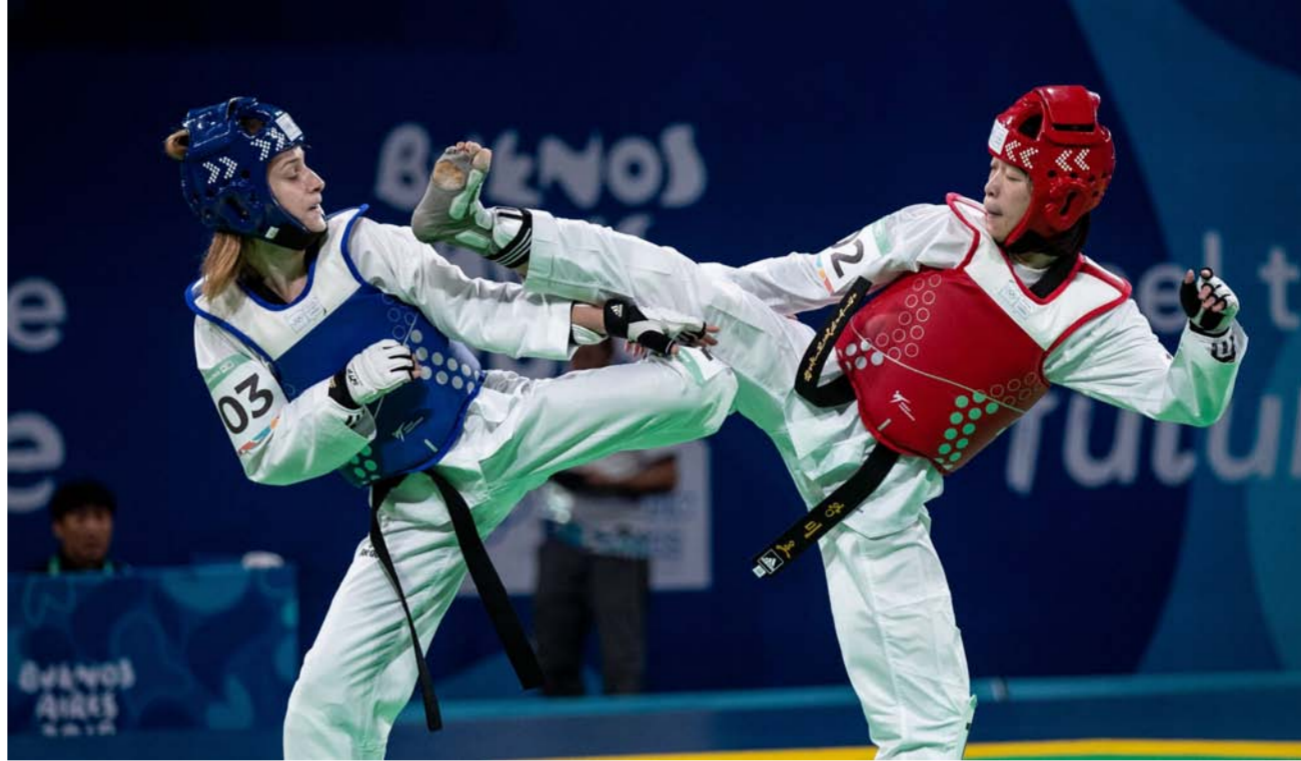
لقطة تاكواندو نساء