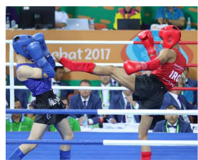
نزاع سابق للاعبي منتخبنا بالمواي تاي