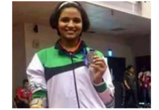
نزاع سابق للاعبي منتخبنا بالمواي تاي