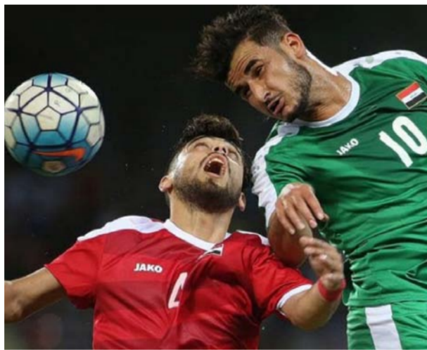
مباراة سابقة بين العراق وسوريا

سيلعب منتخب عُمان بالثالث من أيلول المقبل، وبعدها سيعدو إلى أربيل للدخول بمعسكر تدريبي داخلي يستمر عدة أيام قبل مواجهة نسور فاسيون». وأوضح: «إن هناك اتصالات تجري مع عدد من المنتخبات لتأمين مباراة ثالثة لأسود الرافدين تقام أيضاً في محافظة أربيل ضمن النهج الذي أعده المدرب السلوفيني ستريشكو كاتانيتش قبل التوجه لخوض مباراة هونغ كونغ بالثالث عشر من تشرين الأول المقبل». ويتصدر منتخبنا الوطني مجموعته الثالثة للتصفيات الآسيوية المزدوجة برصيد 11 نقطة.