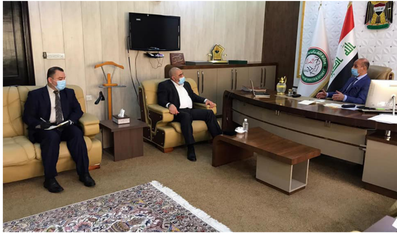
جانب من لقاء درجال مع وفد مركز الكفيل للطباعة الرقمية

رافقت المرحلة الماضية، كما ناقش مع رئيس الهيئة الوطنية للاستثمار والوفد المرافق له قانون الاستثمار الرياضي والضرورة القصوى لإقراره ليكون نافذاً بمحادثته التي تنظم العمل مع الاتحاد بالحسبان الفائدة الاستثمارية للموارد البشرية وأهميتها لمستقبل البلاد معززة بـ عددٍ من النماذج داخل العراق وخارجه فضلاً عن الامكانيات التي يتمتع بها الخبراء العراقيين في مجال الاستثمار في قطاع الرياضة والجووى الاقتصادية التي توفر للبلاد مدخولات كبيرة تسهم في تحسين الاقتصاد المحلي.