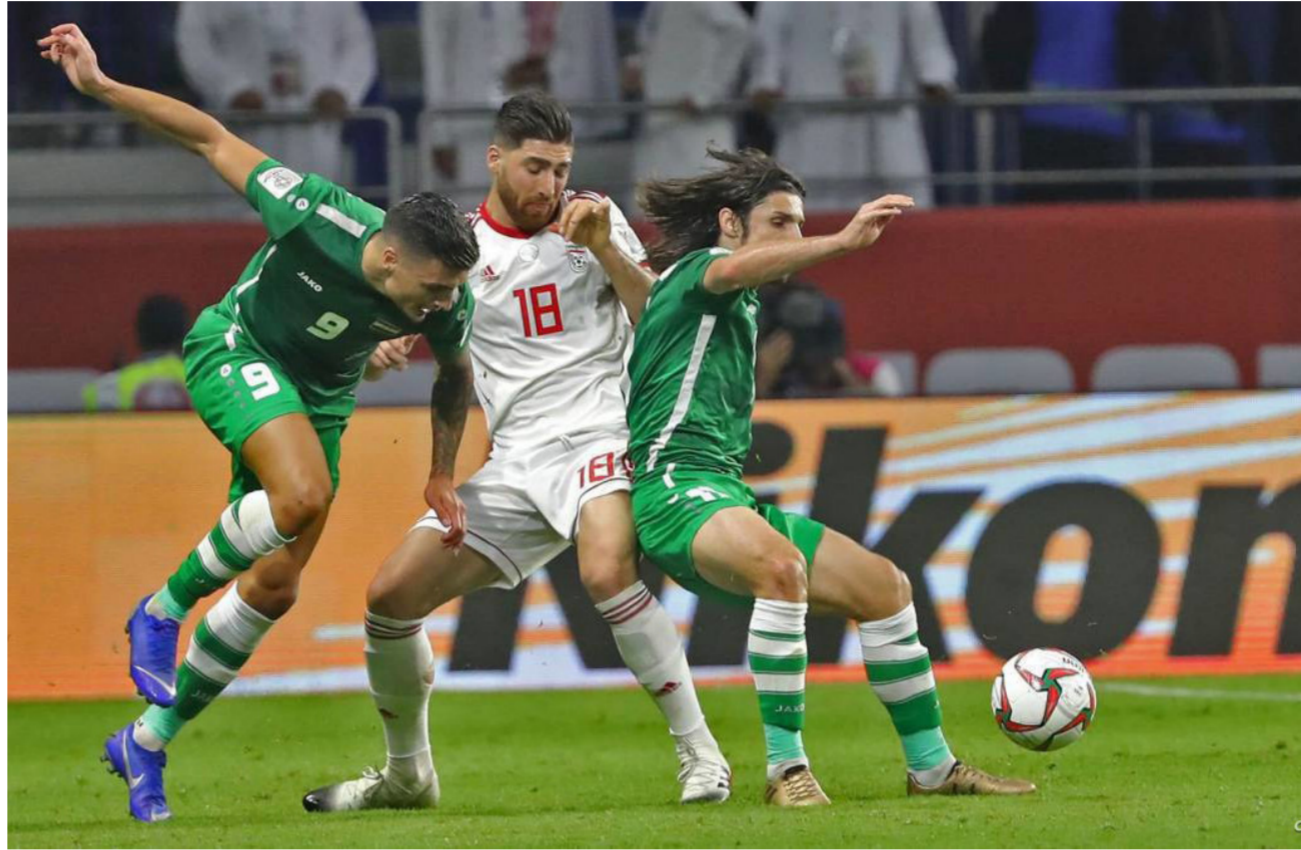
جانب من لقاء الوطني امام إيران في التصفيات المزدوجة