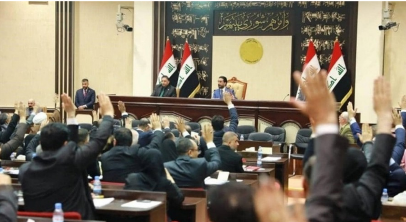
مجلس النواب "ارشيف"

دراسته قبل عرضه للمقرراتين الأولى والثانية ومن ثم التصويت ويقدّر قده، بأن "تستغرق نقاشات القانون داخل اروقة مجلس النواب قبل عرضه للتصويت بنحو ثلاثة أسابيع من الحوارات والتعديلات". وتابع، ان "موازنة 2020 سوف تكون تقشفية وخاصة تستهدف العراقي". لما تجر به البلاد من أزمات اقتصادية وصحية". وانتهى قده بالقول، إن "السلطتين التشريعية والتنفيذية تدرجان حجم المخاطر الاقتصادية التي يعاني منها العراق، وبالتالي تسعين لإقرار الموازنة بما لا يسوف تكون تقشفية وخاصة تستهدف العراقي".