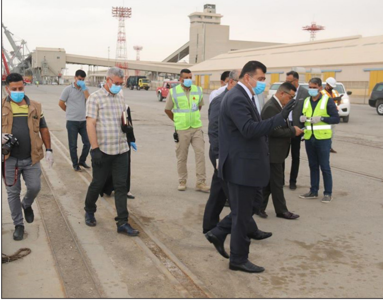
مدير عام شركة موانئ العراق يتفقد ميناء خور الزبير

من الظروف التي يمر بها البلد جراء جائحة كورونا حيث لم تتوقف عمليات استقبال البواخر خلال هذه الفترة. واجتمع مدير عام الشركة العامة لموانئ العراق بإدارة ميناء خور الزبير واطلع على سير العمل وبارك وثنى جهودهم المبذولة في الارتقاء بالخدمات التي يقدمها الميناء، واطلع على المشاريع المقامة في الميناء ومنها أعمال رصيف رقم 1 متنسوبيشي وأحد مشاريع القرض الياباني. وأكد ان مشروع رصيف 1 يعد من المشاريع الرائدة في الميناء وسيحقق قفزة كبيرة في حال إنجازه. وقال خلال الاجتماع مدير إدارة ميناء خور الزبير انه يجب تطبيق جميع إجراءات الوقاية من مرض كورونا وكذلك الاهتمام بنظافة جميع مرافق الميناء وتنسيق