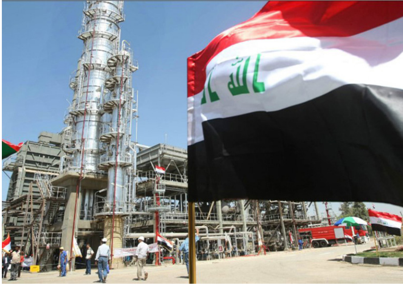
أحد الحقول النفطية

مجموعة أوبك. لاتفاق خفض قياسي للإمدادات قدره 9.7 مليون برميل يومياً بدأ سريانه هذا الشهر. ولم يخطر العراق بعد مستشري فطه مدينة بلانسو في خفض في الصادرات. بما ينشئ بأنه يجد صعوبة في الامتثال الكامل لتخفيضات الإمداد.