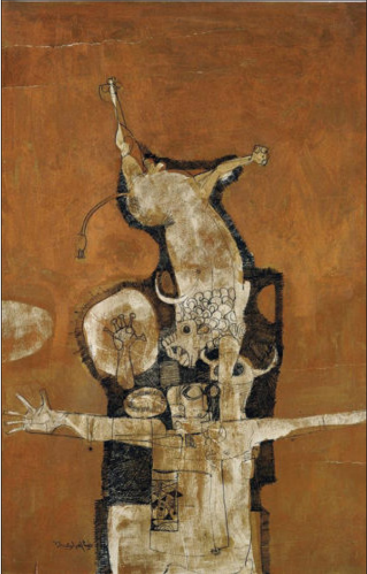
من أعمال الفنان ضياء العزاوي

الى حدود أصابع قدميه . و تتساقط تلك الآثار من عينيه على هيئة قطرات