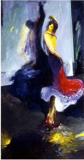
من أعمال الفنان جبر علوان

في لجوء أهل أوروك التي الالهة لطلب الشكوى ضد تلك الأفعال. واستجابة الالهة لهم عبر خلق غرم له بضاهيه في الفوة وهو أنكيدو. هذا الغرم. كان مخططا له ان يصارع كلكامش. ويلهيه عن أهل أوروك. كي يعم السلام بينها. لكن ما حدث كان مختلفا تماما. ولو انه توصل الى نفس النتيجة التي كانت مرجوة. وهي إرغام كلكامش على التوقف عن ممارسة الاغتصاب والسخره وغيرها من الأمور التي تطير منها أهل أوروك. ولكن حين اكتشف كلكامش انه سيموت. تظهر له مشاكله الوجودية. واهمها مشكلة الموت. ما يضطره الى السفر عبر المحيطات ليحصل على عشبة الخلود. التي تسرفها منه الأفعى. وبعدها يوقن ان الموت هو قدر البشرية. بعد كلام سيدوري صاحبة الحانة. المفارقة ان كلكامش. توقف عن افعاله بمجرد التقائقه بأنكيدو. وعقد صداقة معه. حيث ان طاقته توجهت الى خارج أوروك. وأول شيء فعله هو عزمه الذهاب الى الغابة. لقتل حارسها خمبابا). وهو الأمر الذي جعل أنكيدو يبكي.. اي معرفته بالموت. لم تكن السبب الذي جعله يتوقف عن ممارساته الأولى بل أنكيدو وظهوره كقوة مفارية لقوته. هي التي جعلته يتوقف ويتجه الى أمور أخرى.