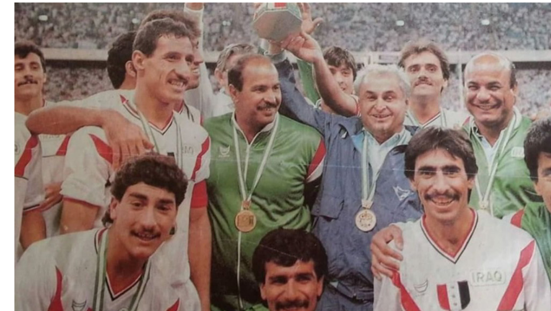
عمو بابا وجنود المنتخب يحتفلون بإنجاز سابق

ولفت الموقع إلى انه «بحسب لعمو بابا كلاعب أنه أول من يسجل هدفا للمنتخب العراقي الأولي وكان ذلك في شبابك منتخب لبنان الأولي ضمن التصفيات المؤهلة لدورة الألعاب الأولمبية في روما عام 1960. لتجربة الإصابة على ترك ميادين كرة القدم عام 1966 بعد أن مثل خلال مسيرته صفوف فريق القوة الجوية وأمانة بغداد».