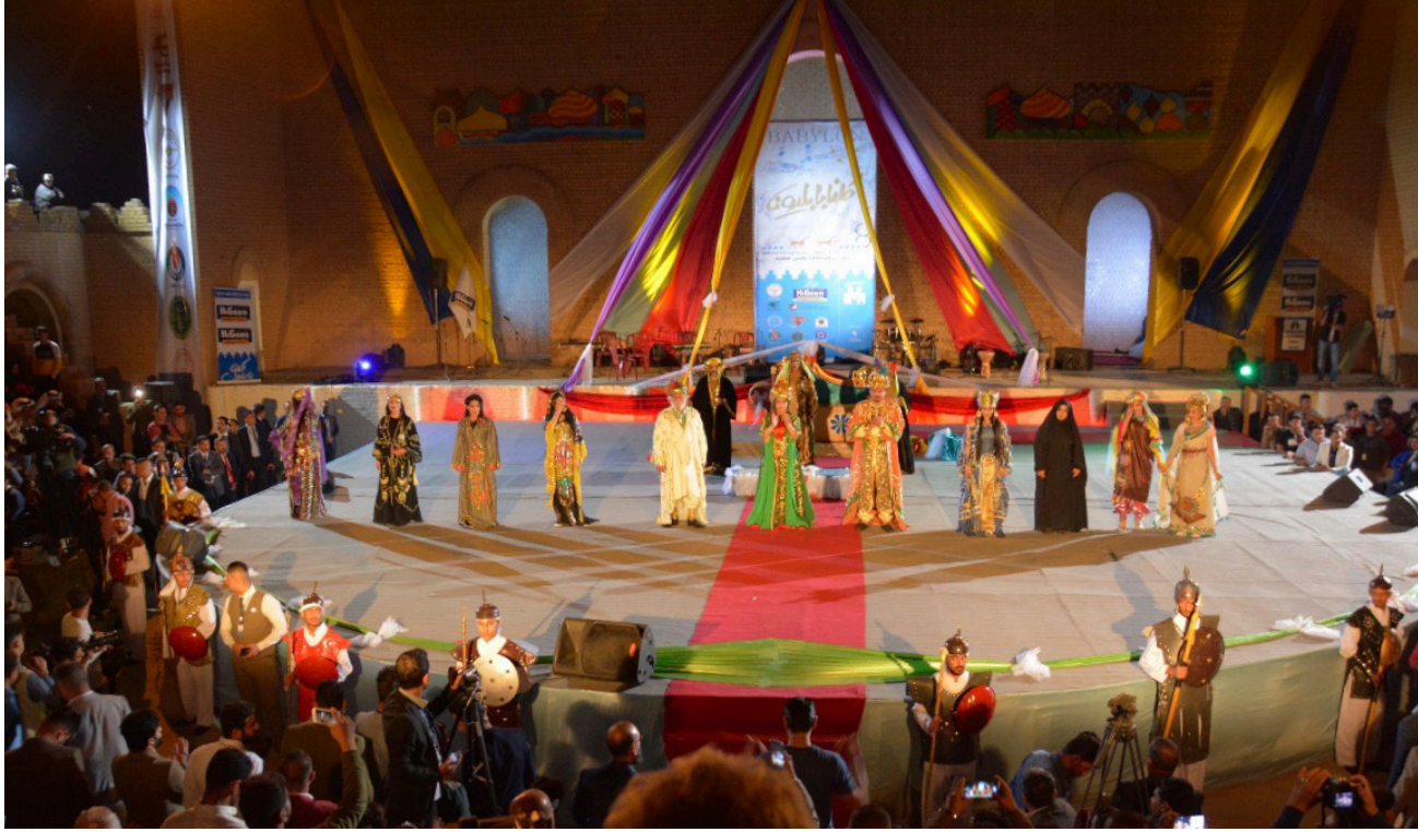
التيارات الشبابية والرياضية. مشاركات واسعة في مهرجانات للفنون