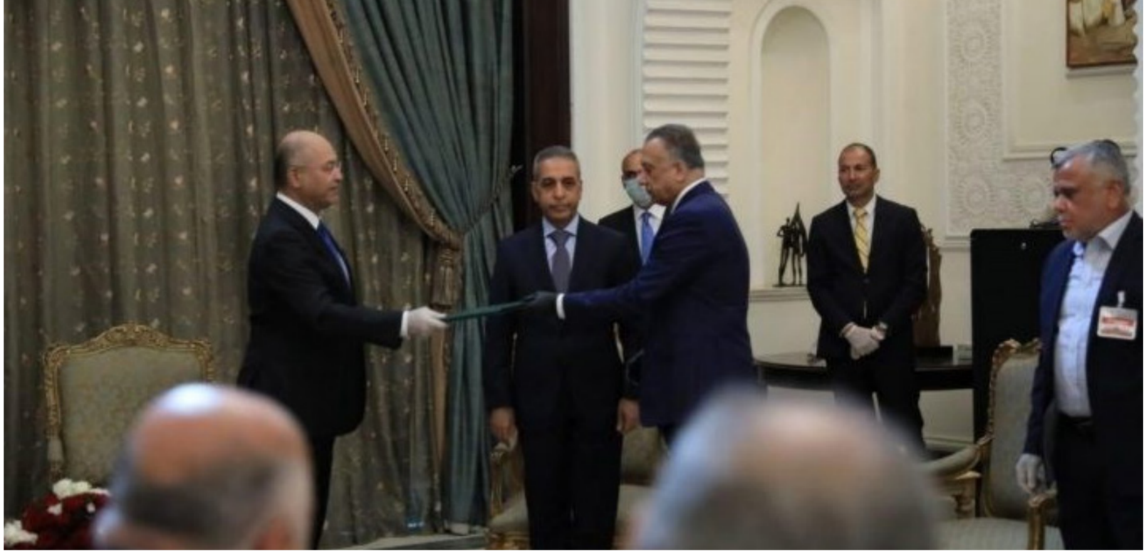
لحظة تكليف الكاظمي