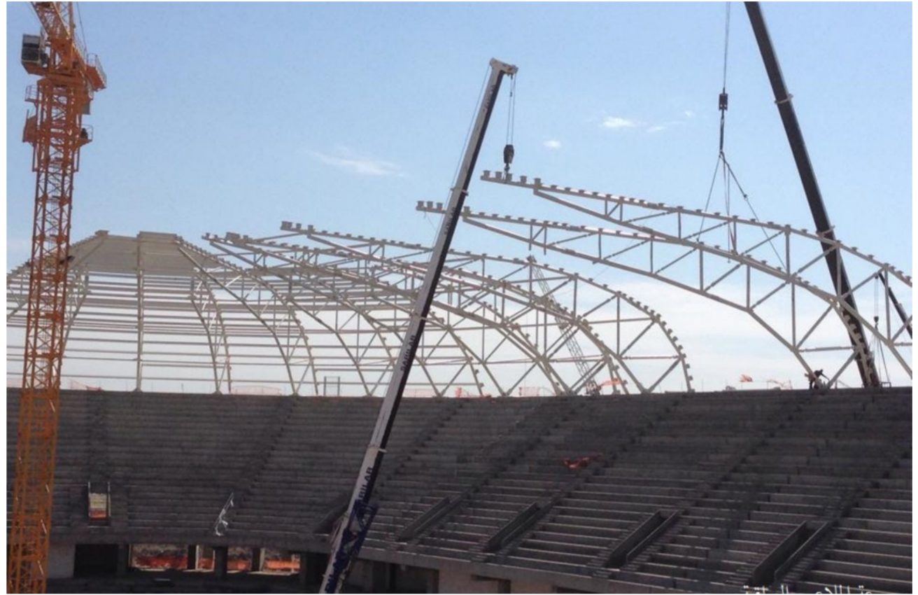
احد الملاعب الرياضية قبل الإنجاز

احتراف لي خارج العراق، عام 2004 بعد أولياد أبنائه، واعتقد أن هناك أمور أثرت على ظهوره بالمستوى المطلوب على رأسها أنني لم أكن أعلم الاحتراف الحقيقي وقتها ولو