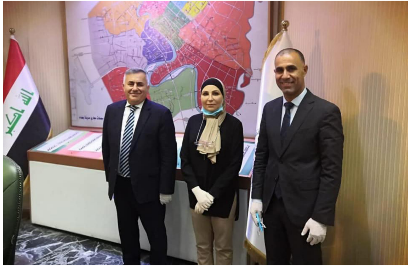
الهيئة التطبيقية في ضيافة أمانة بغداد

الجمهورية التي تتطلع لحبة جديدة تعيد كرة العراق لجادة الإنجازات. جدير بالذكر أن الهيئة التطبيقية