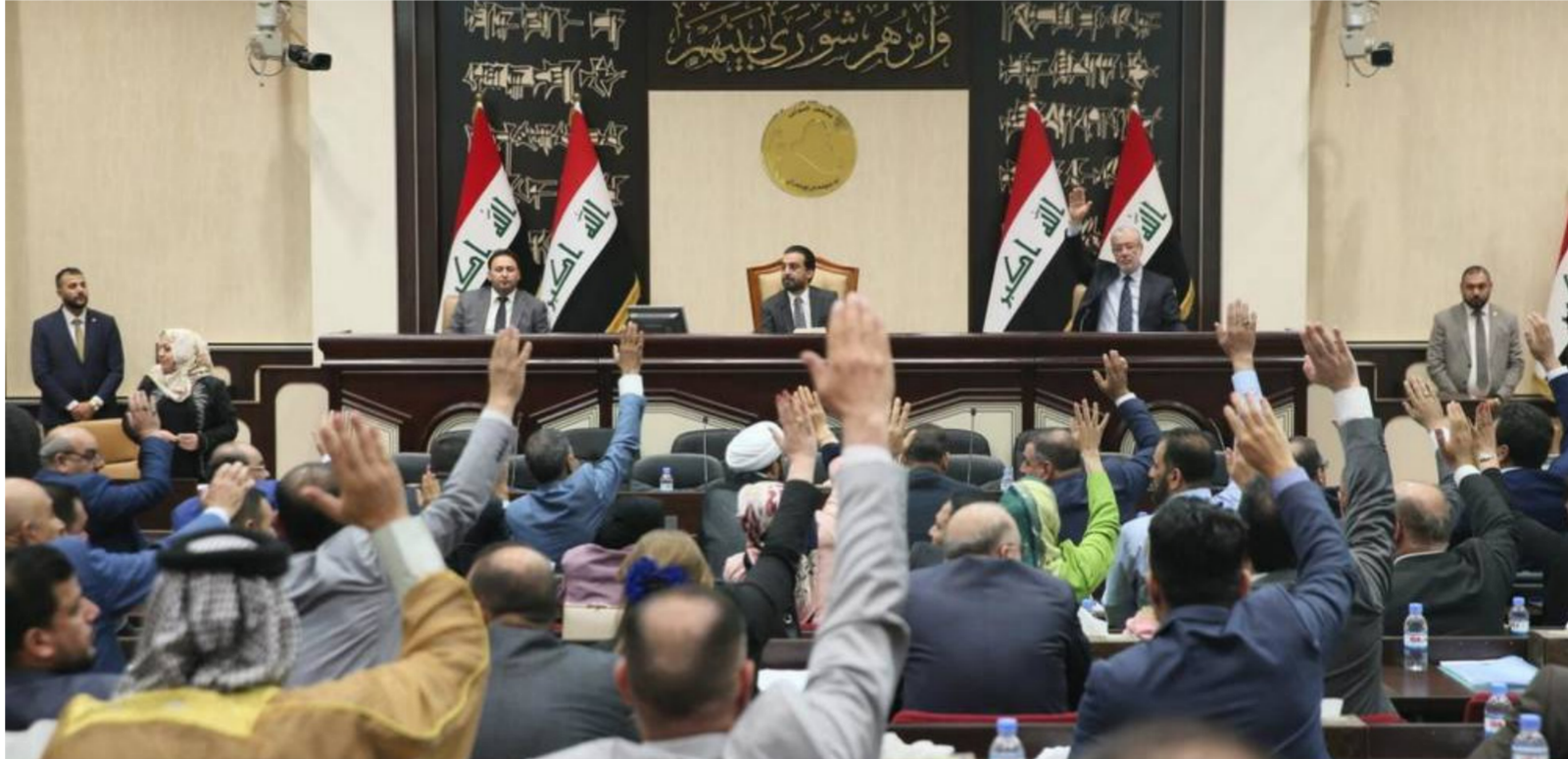
مجلس النواب "رشيف"