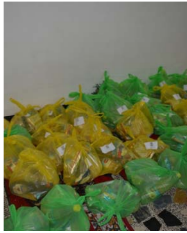
السيدات الغذائية على العوائل المتعففة، تركزت حركتنا في اطراف مدينة بغداد ووسطها. وبضيف " نحن نعتمد على

انفسنا في تهيئة مفردات المساعدات ولا يتوفر مقر ثابت لنا لاننا لا نملك دعماً ولانقلق اي دعم من اي جهة باستثناء قطاع التجاري للرعاية الصحية الأولية الذي قدم لنا المساعدة".