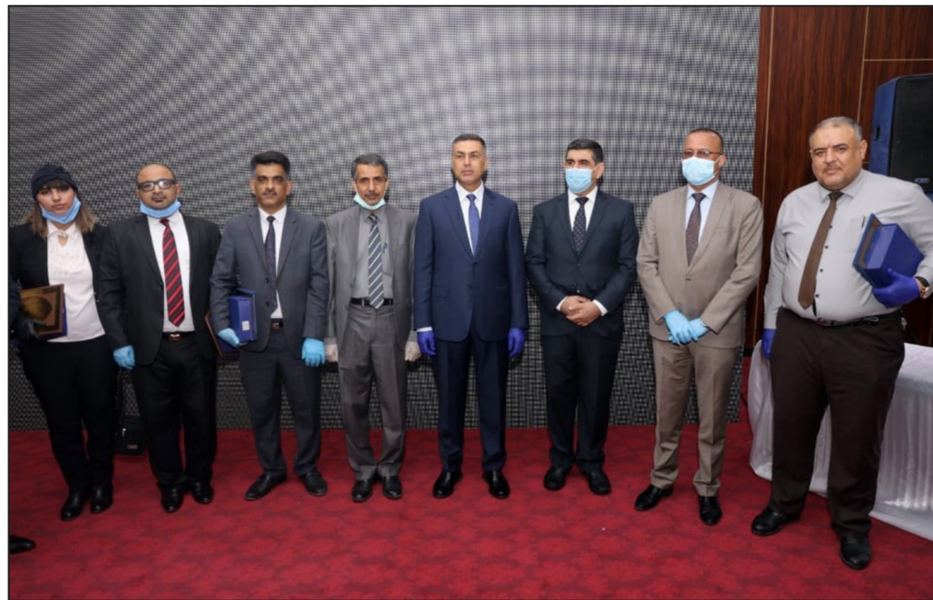
جانب من احتفالية تكريم الملاكات الطبية في البصرة

تكريما لجهودهم الكبيرة في التصدي لفايروس كورونا