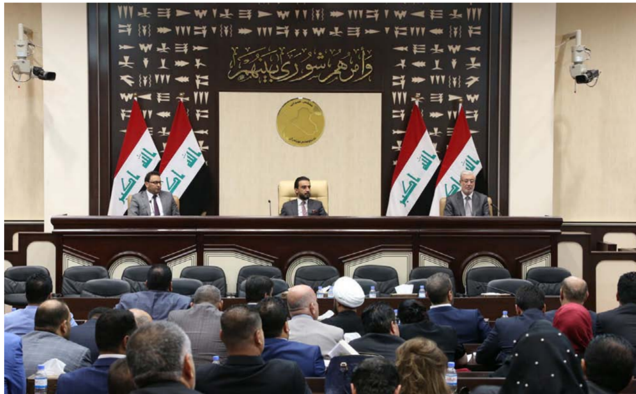
مجلس النواب "رشيدي"

بغداد - وعد الشمري: استبعدت قوى شيعية، أمس الأربعاء، تمرير حكومة مصطفى الكاظمي من دون اعتماد مبدأ "المحاصصة". مشيرة إلى أن الكتل تقاسمت الوزارات بحسب ثقلها في مجلس النواب، متوقعة رفضاً شعبياً، واتساعاً في نطاق التظاهرات الشعبية بعد منح الثقة. وقال النائب عن كتلة النصر فلاح الخفاجي، في حديث إلى "الصباح الجديد"، إن "رئيس الوزراء المكلف مصطفى الكاظمي لا يتمتع بأي حرية في اختيار حكومته". وتابع الخفاجي، أن "ضعف كفاءة الكاظمي على الكاظمي من الكتل برغم قناعتها بأن عمر حكومته قصير ولا يمكن خلاله تحقيق الإنجازات". وتوجه إلى أن "أي محاولة لتجاوز المحاصصة سوف تؤدي إلى فشل تمرير الحكومة". وكشف عن "تعثر في المباحثات بين القوى السياسية الباحثة عن المنصب والمكلف". ويتوقع الخفاجي، "رفضاً شعبياً لأزمة جعفر علاوي أمس جاءت بالمحاصصة مرة أخرى، ومن الممكن أن تحصل ردة فعل حين يتم التصويت عليها، كونها لن تلبى طموحاته". وشدد، على أن "ترك الخبار للكتل في تقديم المرشحين سوف يؤدي إلى مزيد من التسلط الحزبي على مؤسسات الدولة بعيداً عن تقديم الخدمات