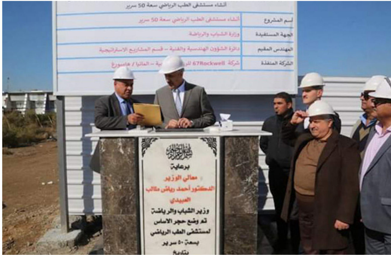
وضع حجر الأساس لمستشفى الطب الرياضي

وتم الاتفاق مبكراً على تجهيزه بأحدث الأجهزة والمعدات الطبية والمختبرية. وكان المستشفى الذي أبرم عقد البناء فيه قبل عدة