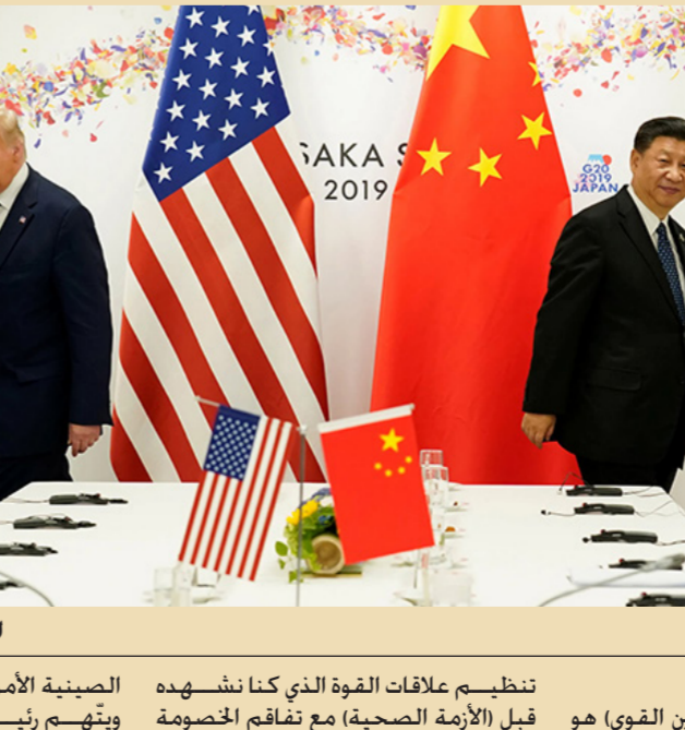
الصراع الاميركي الصيني تنظيم علاقات القوة الذي كنا نشهده قبل الأزمة الصحية مع تفاقم الخصومة ويتهم رئيس الولايات المتحدة، الدولة

بغداد - الصباح الجديد : اعتبر وزير الخارجية الفرنسي جان-إيف لودريان أمس الاثنين أن وباء كوفيد-19 يفاقم "الانقسامات" العالمية والخصومة الصينية الأمريكية ويضعف في نهاية المطاف التعددية الدولية. وقال في مقابلة مع صحيفة "لوموند" نشرت أمس، "أخشى أن يصبح عالم ما قبله، لكن أسوأ". وأضاف "يبدو لي أننا نشهد تفاقم الانقسامات التي تقوض النظام العالمي منذ سنوات، الوباء عطل استثمارية الصراع بين القوى من خلال وسائل أخرى". وعلق الرئيس الأمريكي دونالد ترامب خصوصا المساهمة المالية الأمريكية في منظمة الصحة العالمية التي يتهمها بأنها منحازة إلى الصين منشأ كوفيد-19، في خضم أزمة الوباء العالمي. وقال الوزير الفرنسي، "إنه التشكيك القديم عينه بتعددية الأطراف"، إذ إن الولايات المتحدة سبق أن علقت تمويلها للعديد من المنظمات الدولية في ظل