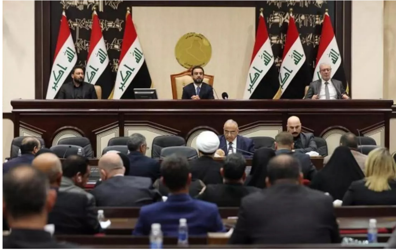
مجلس النواب "رشيف"

عمل على تحقيقه خدمة لمصالح جمهورنا". ويواصل، أن "أي اجتماع لم نعهده مع الكاظمي لغاية الآن". منها إلى أن "المساء المرتقب الثالث في مجلس النواب إلى الأساس إلى مناهج عمله، ومن ثم تأتي بالمرحلة التالية على آلية اختيار الوزراء". وانتهى الدهلكي، إلى أن "الحكومة يجب أن تمر بشكل يلبى طموح جميع العراقيين، ولن نسمح لأفئسنا أن ندخل في سجال سياسي أو إعلامي مع أي طرف".